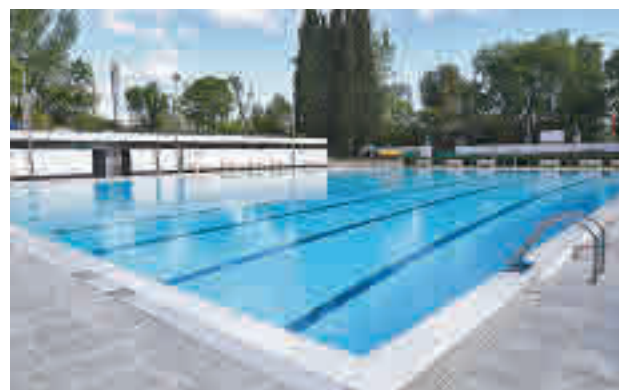
La piscina municipal de Casa de Campo

Un total de 17 instalaciones deportivas comenzarán a prestar servicio y otras tres,