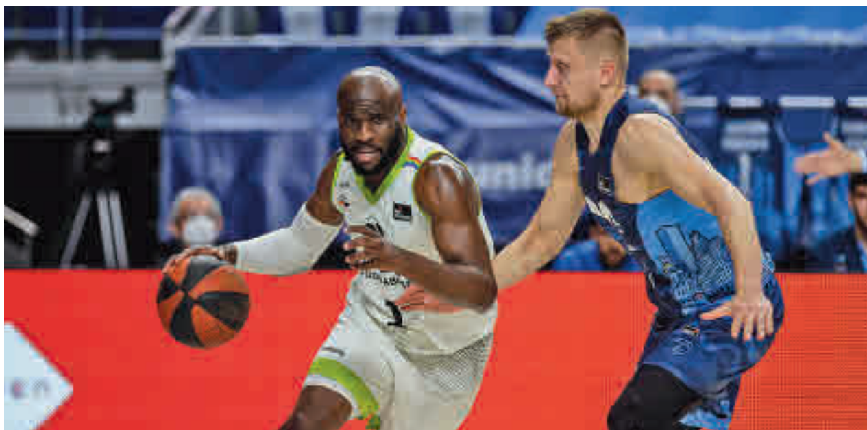
Urbas Fuenlabrada y Movistar Estudiantes pelean por el mismo objetivo MOVISTAR ESTUDIANTES

Un poco más tendrán que esperar los semifinalistas del 'play-off' de la Liga Iberdrola. Entre ellos está el CR Majadahonda, que se cruzará con el Eibar RT.