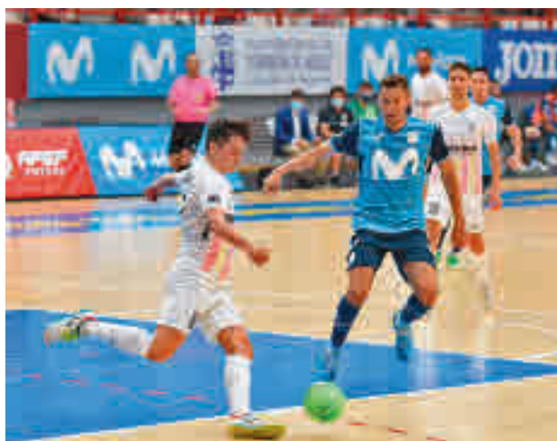
Su rival en semifinales será Industrias Santa Coloma