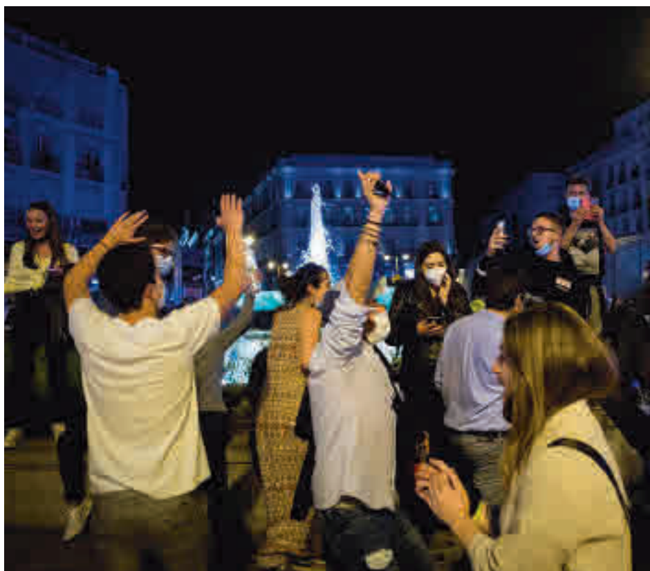
Concentraciones de jóvenes tras el final del estado de alarma

Sobre lo que el consejero Enrique López no se mostró tan receptivo fue la apertura a corto plazo del ocio nocturno. "Tenemos razones de salud pública para no abrir el ocio nocturno de momento. No se