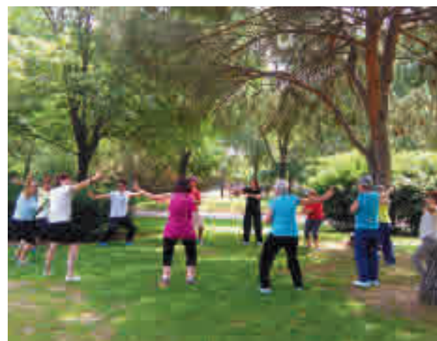
Personas haciendo ejercicio

Para inscribirse, el procedimiento pasa por formalizar la plaza a través del número de teléfono 91 674 84 60, en horario de lunes a viernes de 10:30 a 13:30 horas; o mediante la página web Sanfer-