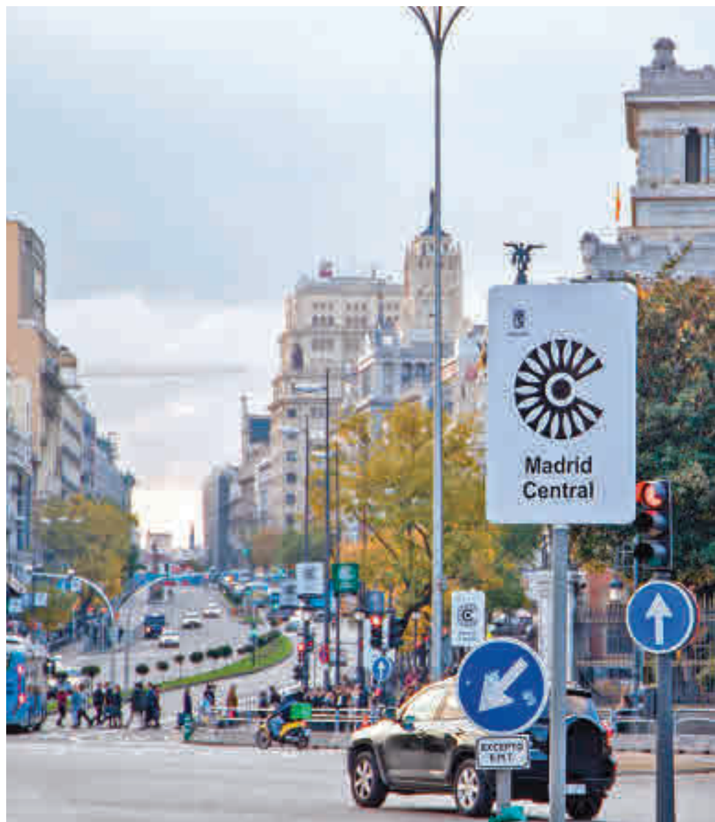
Uno de los carteles indicadores de Madrid Central

En ese caso, se podrían plantear medidas alternati-