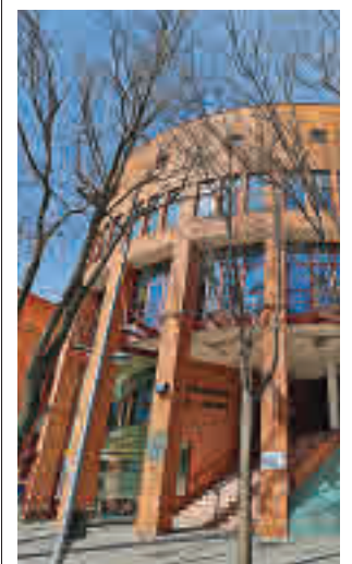
Ayuntamiento de Coslada

Se trata pues de un refuerzo para los servicios de salud que abonará anualmente, durante sesenta años, en torno a un millón de euros al Ayuntamiento, tanto por el canon de arrendamiento de la parcela municipal, como por los