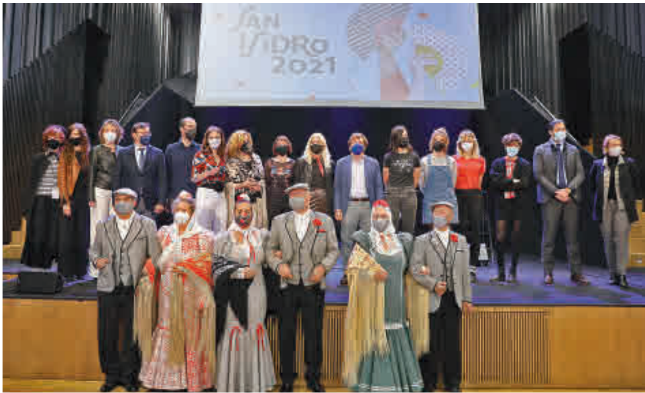
La presentación de la programación de los festejos tuvo lugar en el auditorio de Condeduque el pasado 11 de mayo