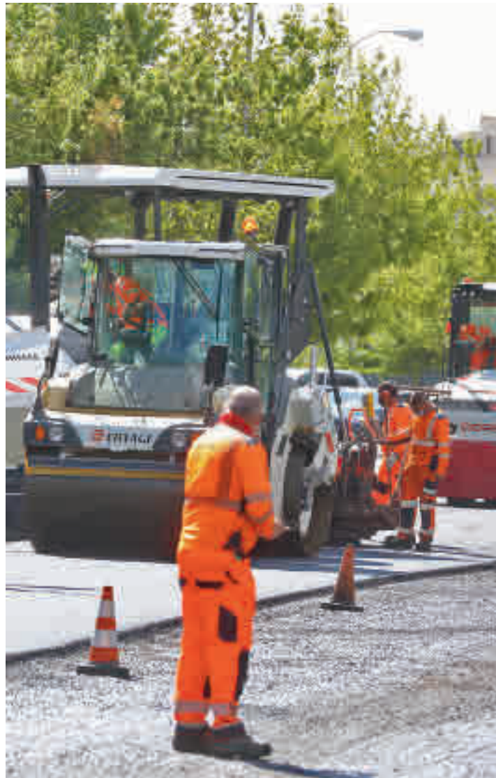
Varios trabajadores extienden el nuevo firme en una calle de la capital

El alcalde de Madrid, José Luis Martínez-Almeida, presentó el pasado 10 de mayo una actuación urbanística que definió como la mayor de la historia del municipio y que afectará a 965 viarios de toda la ciudad con una inversión de 61,4 millones de eu-