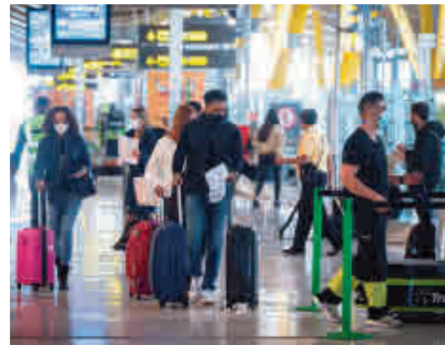
Aeropuerto de Barajas

La presidenta madrileña insistió en que "para ser más eficientes y, sobre todo, para proteger a los ciudadanos de cara al verano esto es importante que se estudie". Respecto a los plazos, espera que se ponga en marcha nada más formarse la Asamblea.