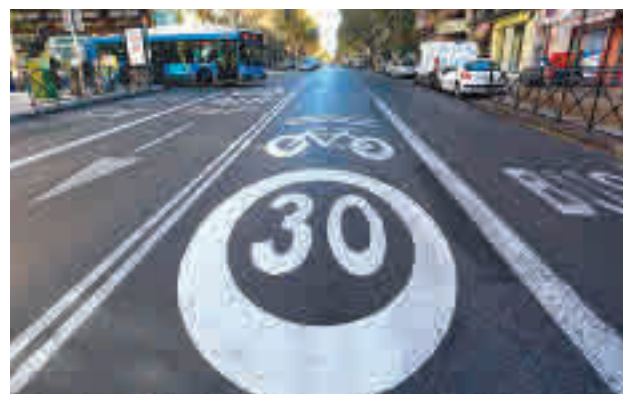
Limitación de velocidad en Madrid

Este martes 11 de mayo entraron en vigor los nuevos límites de velocidad para vías