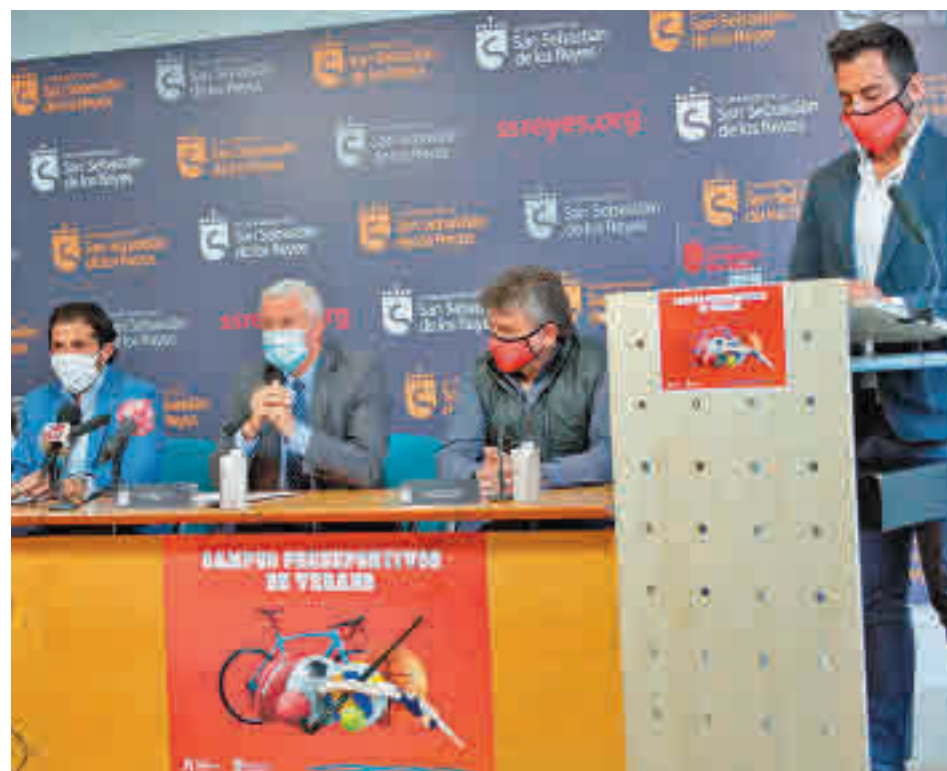
Presentación de estas actividades veraniegas

Toda la actualidad de Sanse y Alcobendas, en nuestra web