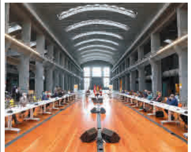
La reunión tuvo lugar en La Nave, en Villaverde

La campaña supondrá la utilización de más de 480.000 toneladas de asfalto y, según las estimaciones de la Asociación Española de Fabricantes de Mezclas Asfálticas (ASEFMA), se crearán más de 1.900 puestos de trabajo entre empleos directos e indirectos.