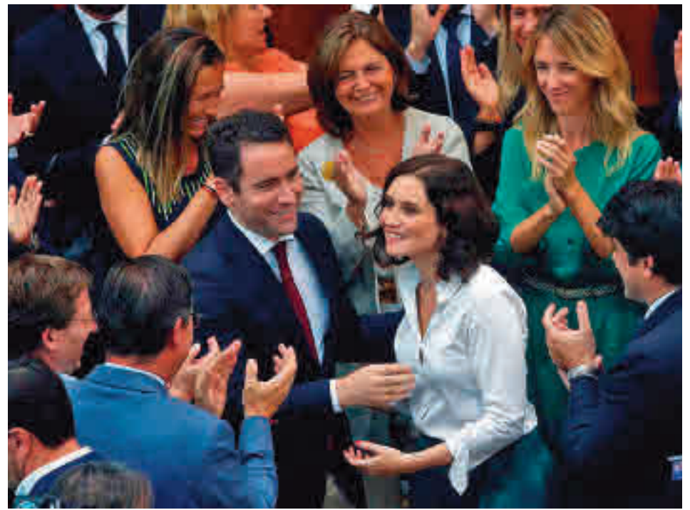
Díaz Ayuso será investida en las próximas semanas

Una de las principales novedades de ese nuevo Parla-