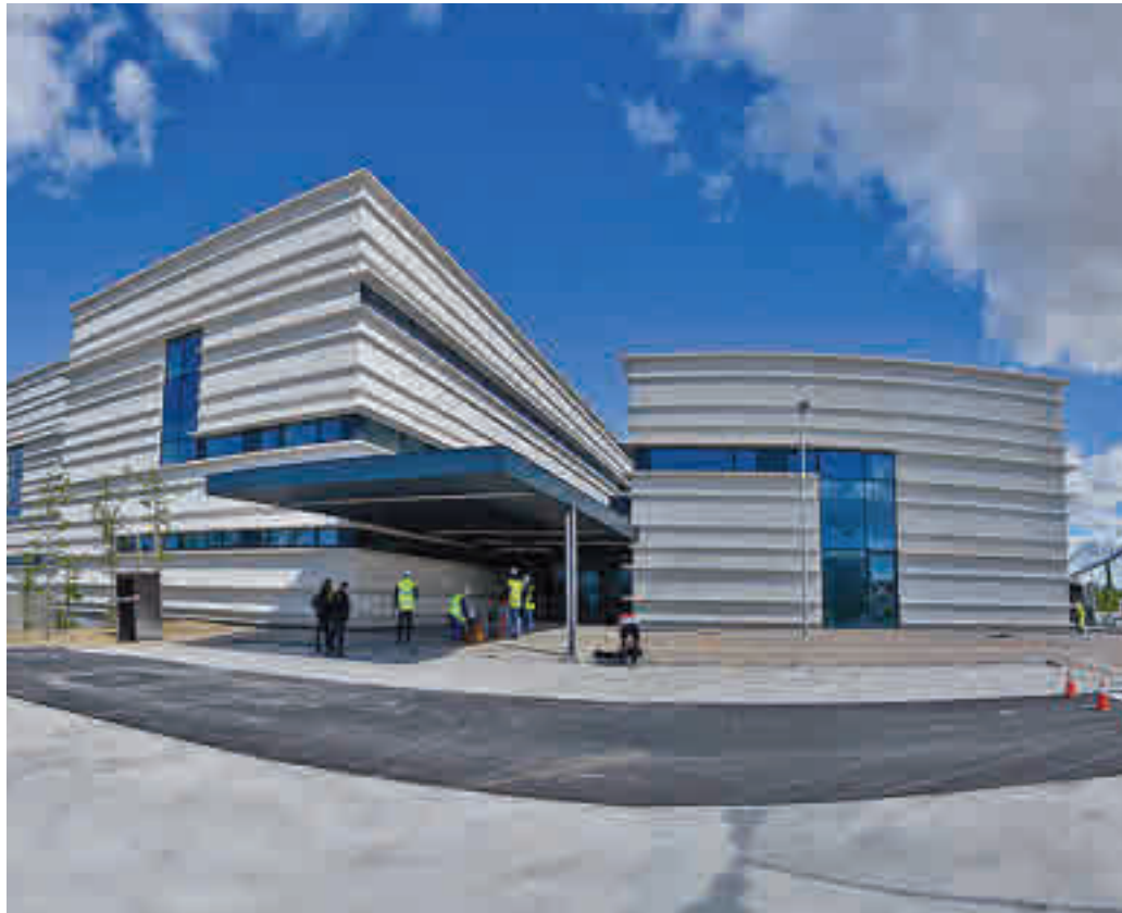
Las obras, a punto de terminar AYUNTAMIENTO DE TORREJÓN DE ARDOZ

En lo que respecta a sus instalaciones, albergará den-