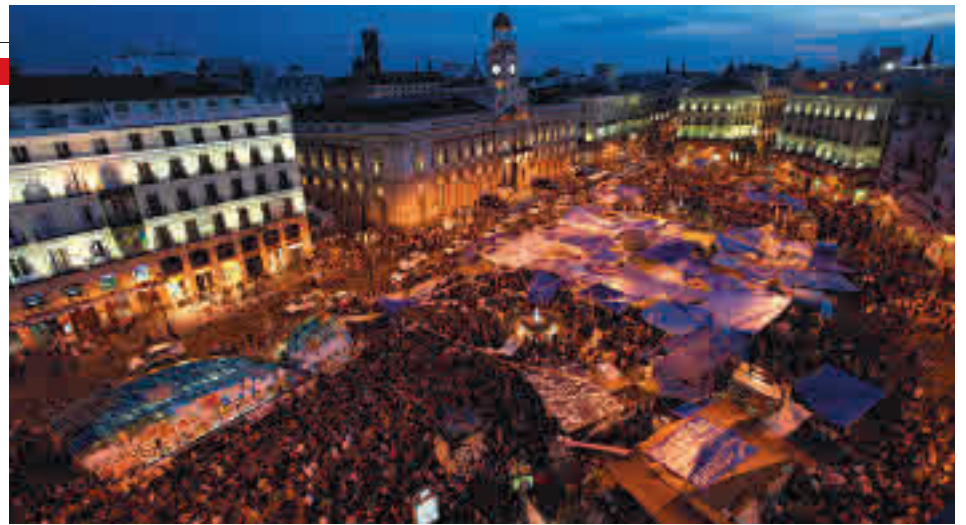
Campamento del 15M en la Puerta del Sol GENTE

jóvenes pensaban, pero es innegable que aquel movimiento, inicialmente desligado de opción política alguna, ha condicionado gran parte de lo que ha sucedido en nuestro país en la última década.