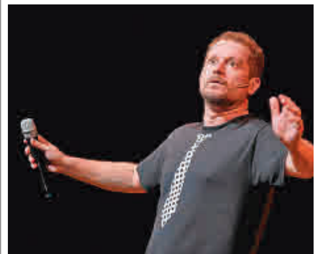
El monólogo de El Monaguillo, uno de los eventos estrella

Estos campus deportivos, que se desarrollarán durante los meses de julio y agosto y estarán divididos en cuatro quincenas, contarán asimismo con plazas para el servicio de guardería desde las 8:30 horas, comenzando las actividades justo una hora después, a las 9:30. Además, habrá un servicio de comedor, que se establece en función de los turnos entre las 13:30 y las 15 horas. La actividad finaliza a las 16:30 horas y contempla un servicio de guardería hasta las 17 horas.