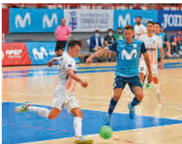
Su rival en semifinales será Industrias Santa Coloma