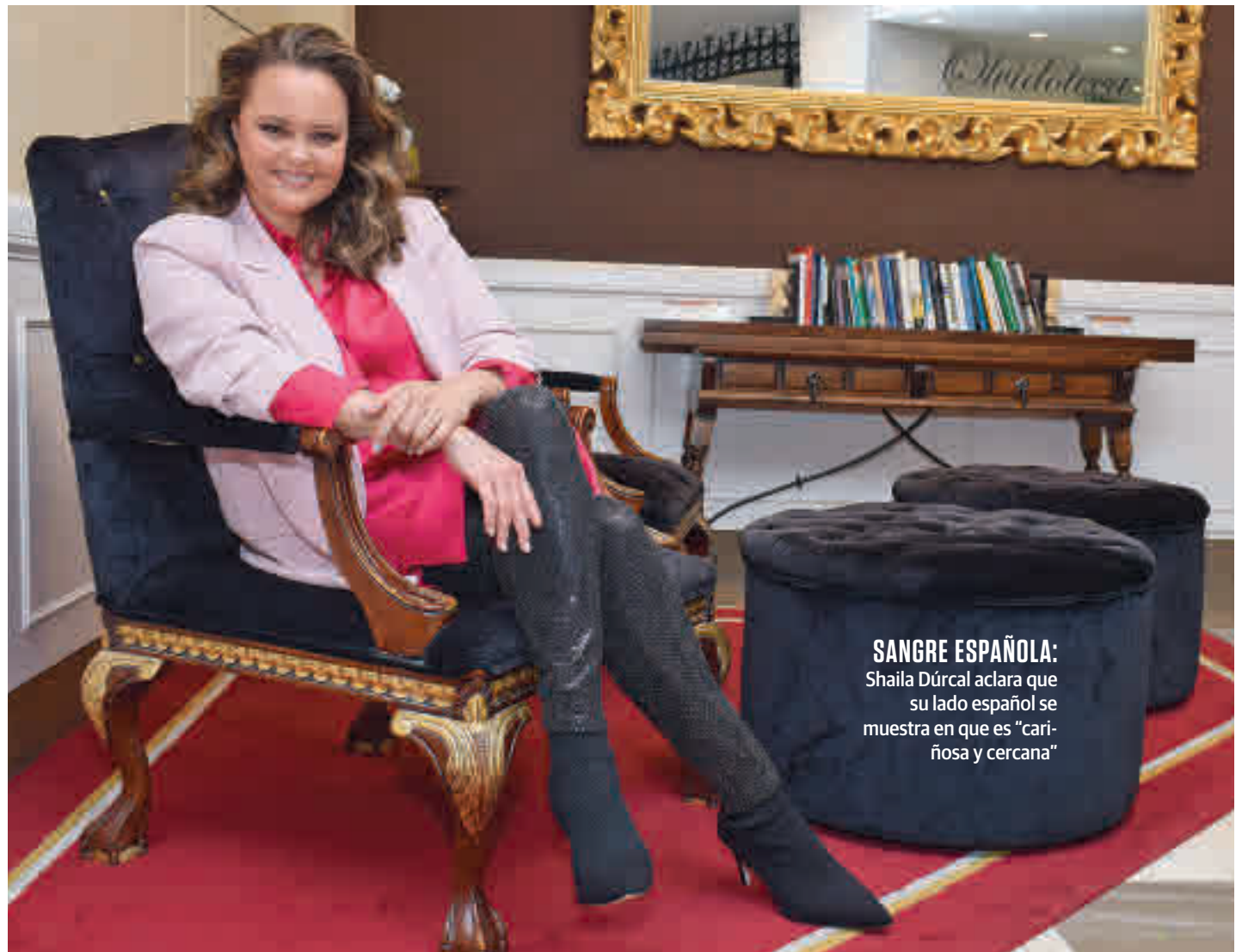
SANGRE ESPAÑOLA: Shaila Dúrcal aclara que su lado español se muestra en que es "cariñosa y cercana"