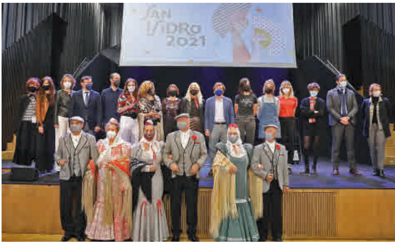
La presentación de la programación de los festejos tuvo lugar en el auditorio de Condeduque el pasado 11 de mayo