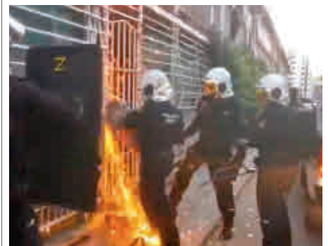
Un momento de la actuación de los agentes

El nuevo equipamiento, que estará ubicado en la calle Peña Vieja, 4, esquina con la calle Mirasierra, tendrá cuatro plantas. El edificio dispondrá de un vestíbulo en el que estarán situados el mostrador de información y las zonas destinadas a la lectura de prensa, acceso a Internet y espera. Además, contará con áreas para talleres, nuevas tecnologías, biblioteca y sala de lectura, así como gimnasio salas polivalentes, un comedor y una cafetería.