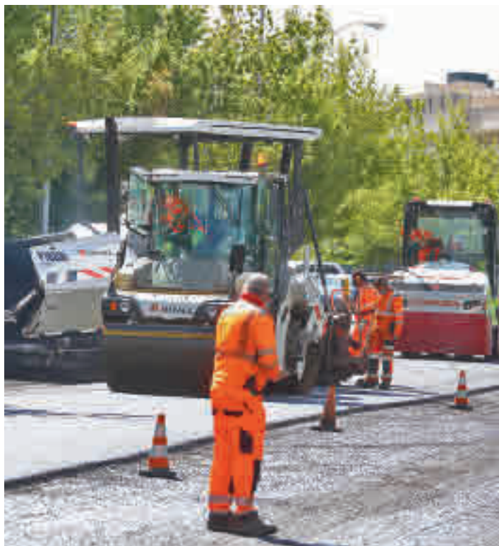
Varios trabajadores extienden el nuevo firme en una calle de la capital

“Entre la Operación Asfalto del año pasado y la de este año vamos a actuar sobre más del 20% de las calles que tiene la ciudad de Madrid, lo