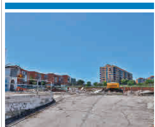
Obras de derribo de los concesionarios

Los agentes han comenzado a visitar los comercios de la ciudad para presentarse a los y las propietarias de los establecimientos y ofrecerles consejos de seguridad.