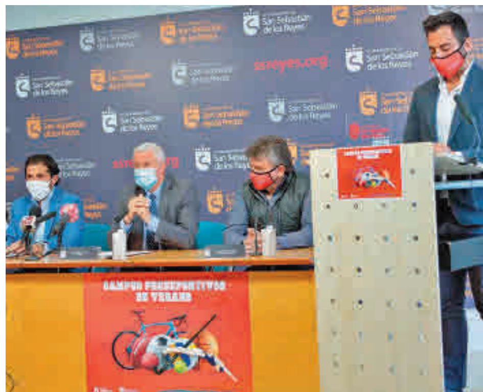
Presentación de estas actividades veraniegas

Toda la actualidad de Sanse y Alcobendas, en nuestra web