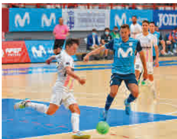
Su rival en semifinales será Industrias Santa Coloma