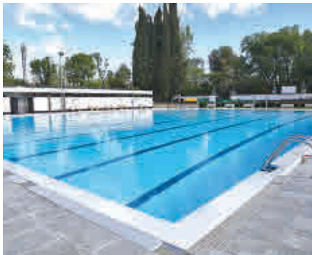
La piscina municipal de Casa de Campo

Un total de 17 instalaciones deportivas comenzarán a prestar servicio y otras tres, las ubicadas en el Centro Deportivo Margot Moles (Vicálvaro), en el Centro Deportivo Entrevías y Santa Ana (Fuen-