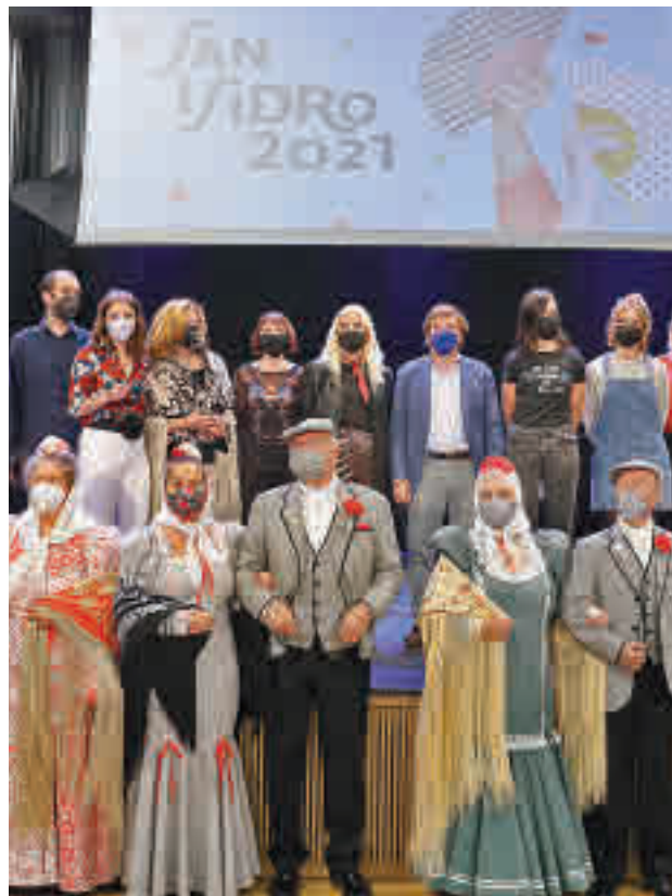
Presentación de la programación de los festejos

Por otro lado, las fiestas contarán con una variada programación musical a base de conciertos gratuitos que, con aforos y medidas de seguridad contra el virus, llegarán a tres escenarios dife-