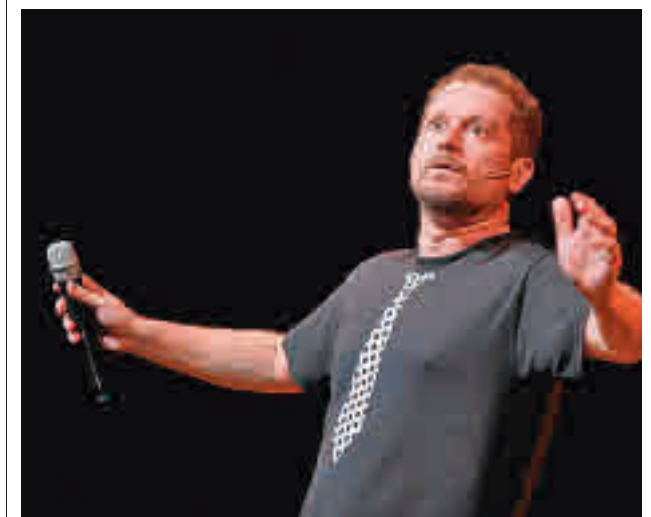
El monólogo de El Monaguillo, uno de los eventos estrella

Estos campus deportivos, que se desarrollarán durante los meses de julio y agosto y estarán divididos en cuatro quincenas, contarán asimismo con plazas para el servicio de guardería desde las 8:30 horas, comenzando las actividades justo una hora después, a las 9:30. Además, habrá un servicio de comedor, que se establece en función de los turnos entre las 13:30 y las 15 horas. La actividad finaliza a las 16:30 horas y contempla un servicio de guardería hasta las 17 horas.