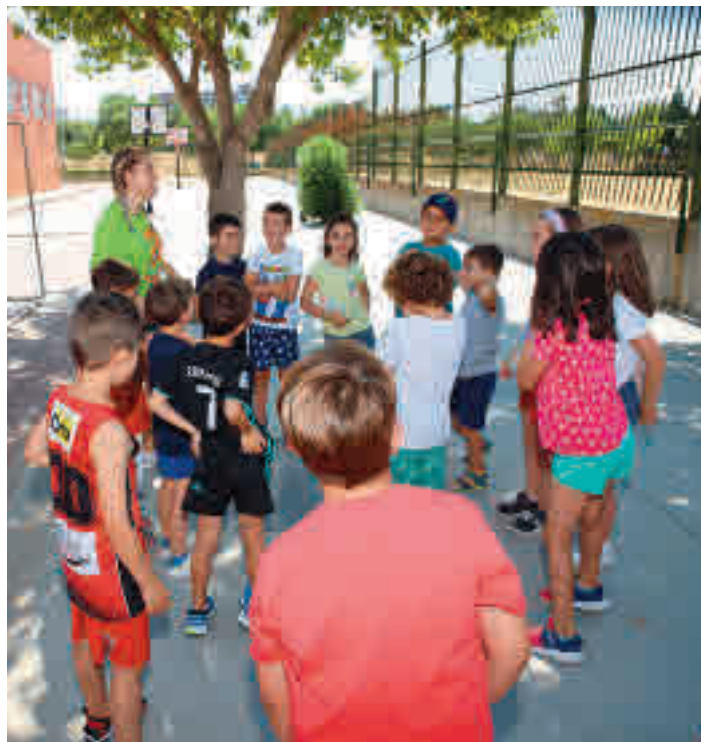
Edición pasada de las Fuenlicolonias

La Fuenlicolonia Verde La Pollina estará centrada en la educación medioambiental y se desarrollará en el Centro Municipal La Pollina durante en julio. Los niños y jóvenes