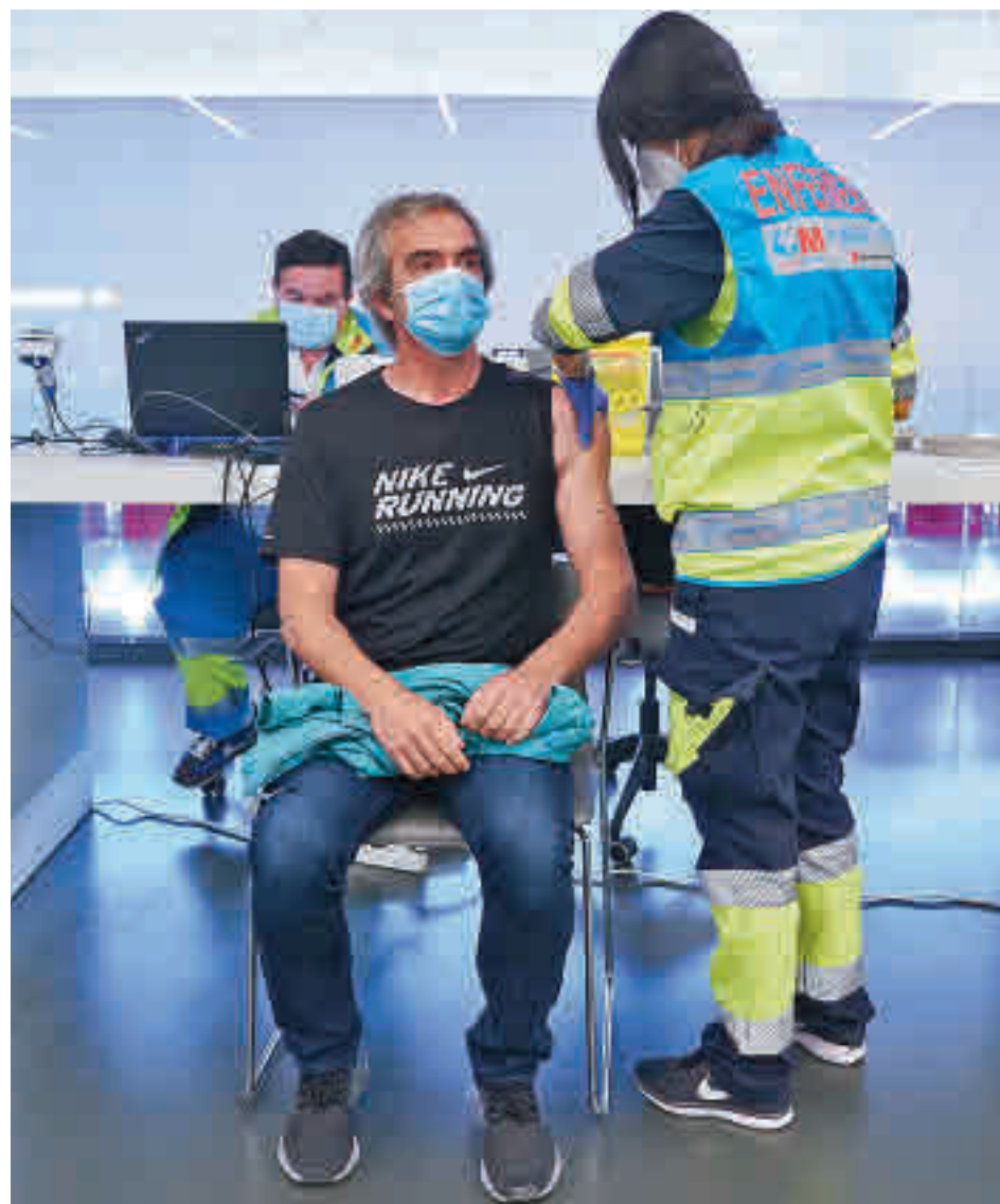
Los menores de 60 años recibieron la vacuna de AstraZeneca hace más de dos meses

embargo, ante la resistencia de varios consejeros, como los de Madrid, Cataluña o Andalucía, la ministra Carolina Darias abrió la puerta a que "las personas que prefieran recibir la segunda dosis de AstraZeneca firmando un consentimiento informado".