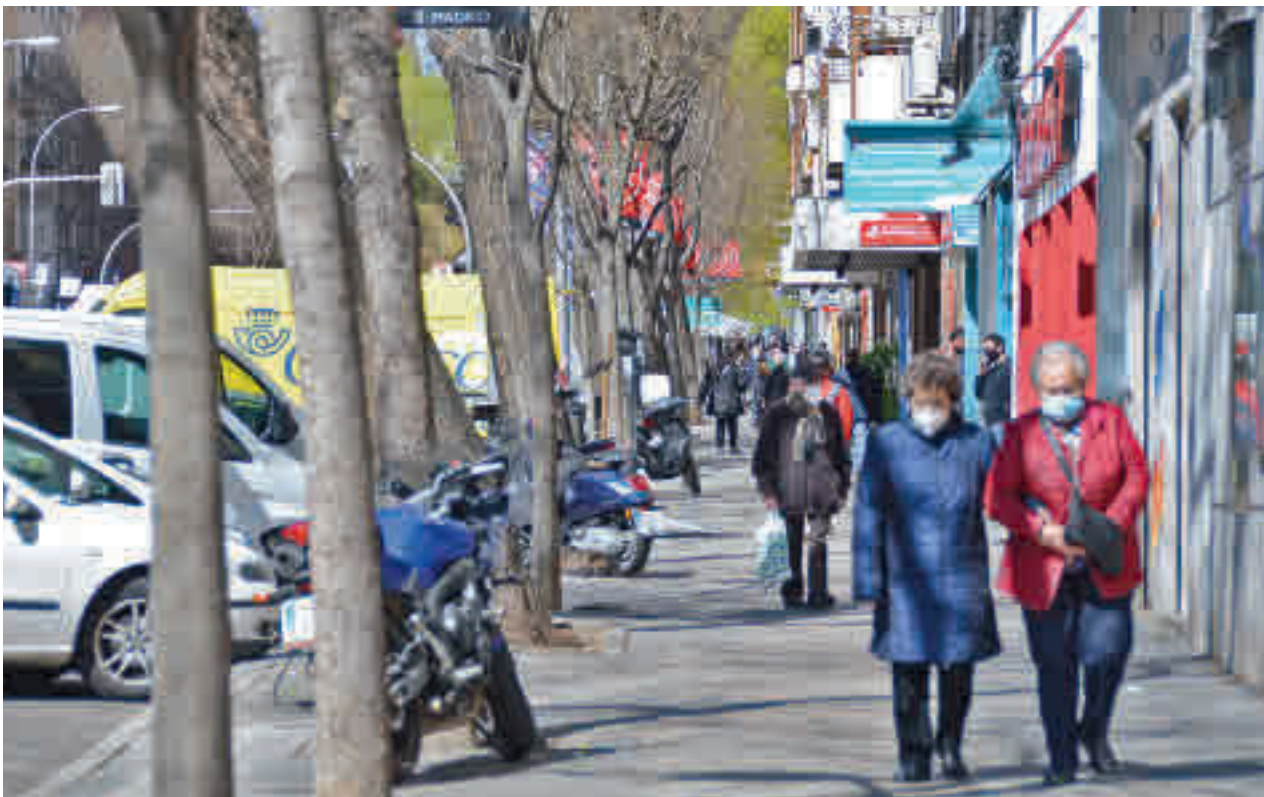
Más de 3,3 millones de madrileños vivían en la ciudad a 1 de enero de 2021