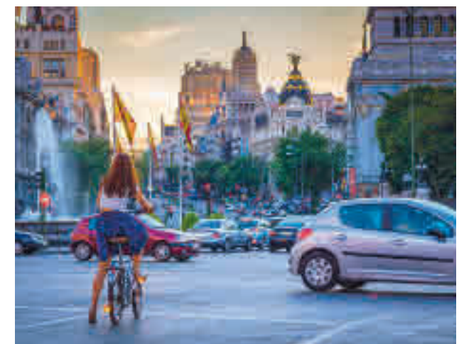
Un ciclista transita por una calle de la capital

Además, añaden que, antes de finales de julio, estarán colocadas 305 nuevas horquillas aparcabicis, comenzando su instalación en un plazo de 15 días. En cada horquilla cabrán dos bicicletas, por tanto, se podrán aparcar 610 más en 61 situaciones nuevas.