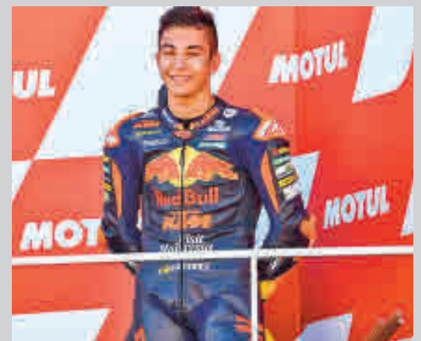
Fernández ya ha subido en tres ocasiones al podio

La otra gran noticia para el equipo de Torrejón de Ardoz es que el balance aún no es definitivo. Con varios partidos pendientes de la fase regular, los interistas miran a un 'play-off' por el título que promete estar más reñido que nunca. Levante, Jimbee Cartagena o Palma Futsal se han mostrado como sólidas alternativas al dominio que años atrás ejercieron el propio Inter, ElPozo y el Barça. Antes de esas eliminatorias, el Inter tendrá que afrontar un maratón de cuatro partidos de Liga en apenas nueve días.