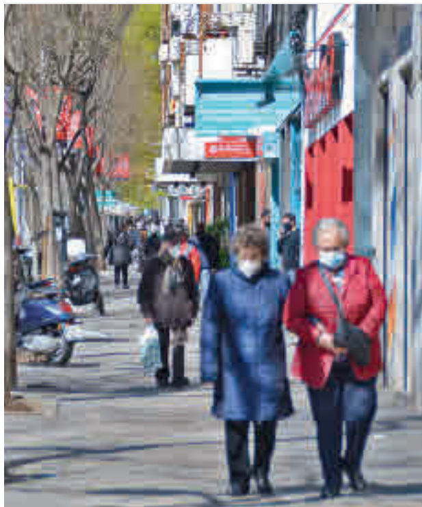
Unos 3,3 millones de madrileños vivían aquí a 1 de enero

Los datos arrojan una disminución de 22.456 personas con respecto al año anterior. Según fuentes municipales, este descenso rompe la tendencia alcista de los últimos cinco años en los que la capital vio incremen-