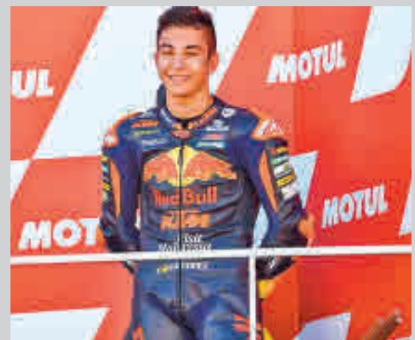
Fernández ya ha subido en tres ocasiones al podio

La otra gran noticia para el equipo de Torrejón de Ardoz es que el balance aún no es definitivo. Con varios partidos pendientes de la fase regular, los interistas miran a un 'play-off' por el título que promete estar más reñido que nunca. Levante, Jimbee Cartagena o Palma Futsal se han mostrado como sólidas alternativas al dominio que años atrás ejercieron el propio Inter, ElPozo y el Barça. Antes de esas eliminatorias, el Inter tendrá que afrontar un maratón de cuatro partidos de Liga en apenas nueve días.