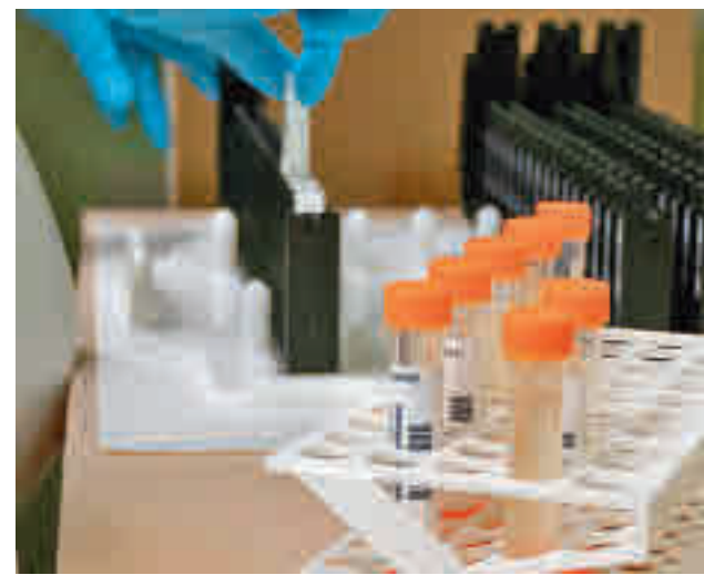
Las vacunas son clave en la lucha contra la Covid-19