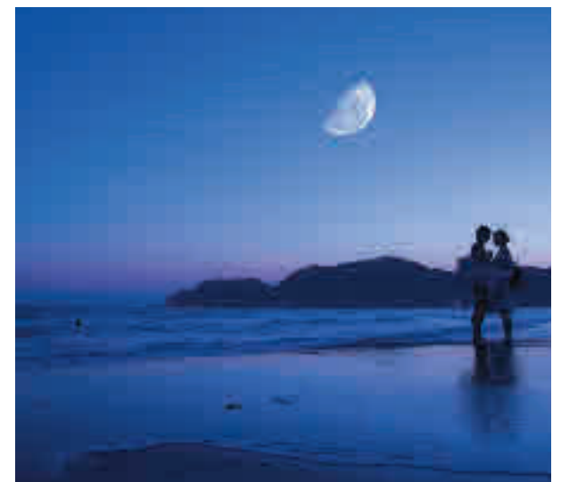
La costa es uno de los destinos recurrentes

Con todo, puntos exóticos como Maldivas, Riviera Maya o Punta Cana siguen estando entre las predilecciones de los cónyuges. Sin salir del territorio nacional, tanto Baleares como Canarias sigue apareciendo como lugares ideales para la luna de miel.