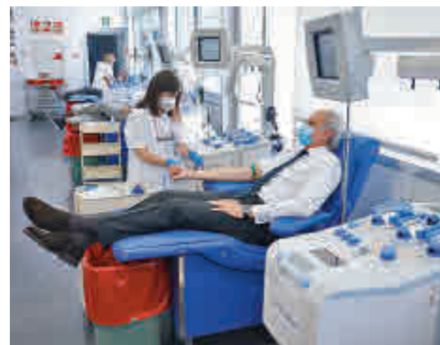
Ruiz Escudero donó sangre

Actualmente hay un déficit superior al 35% en las reservas de sangre y el stock se sitúa en torno a las 3.200 bolsas cuando debería estar en las 5.000. Escudero puso el foco en que tres grupos (O-, A- y O+) están en alerta roja y dos (A+ y AB-) en amarilla. El consejero insistió en que donar sangre es una actividad "totalmente segura".