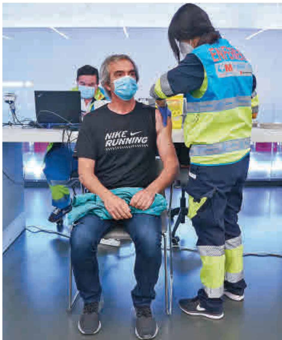
Los menores de 60 años recibieron la vacuna de AstraZeneca hace más de dos meses

embargo, ante la resistencia de varios consejeros, como los de Madrid, Cataluña o Andalucía, la ministra Carolina Darias abrió la puerta a que "las personas que prefieran recibir la segunda dosis de AstraZeneca firmando un consentimiento informado".