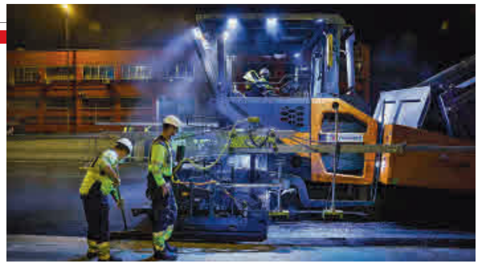
Trabajos sobre la calzada de la M-506

tenimiento de las instalaciones semafóricas y luminosas de la red. Por último, el quinto eje de actuación se centra en las actuaciones de acondicionamiento y conservación de las travessías, márgenes e isletas.