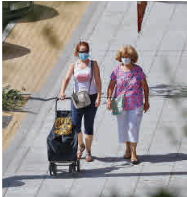
Los contagios bajan en la zona Sur

Por debajo de los 250 contagios por cada 100.000 habitantes que marcan el riesgo extremo están otras cuatro