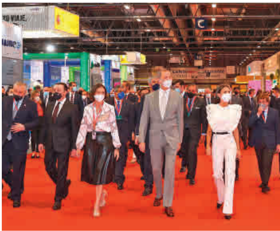
Inauguración de Fitur 2021 en Ifema

Organizada por Ifema Madrid, del 19 al 23 de mayo, la feria reúne a más de 5.000 participantes de los cinco continentes, con presencia de todas las comunidades autónomas, empresas y destinos de 55 países, y 37 representaciones oficiales, a lo que se suma en esta edición la participación de profesionales de 79 nacionalidades en su nueva plataforma digital Fitur