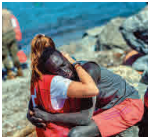
Una voluntaria de Cruz Roja en Ceuta

EL PERIÓDICO GENTE NO SE RESPONSABILIZA NI SE IDENTIFICA CON LAS OPINIONES QUE SUS LECTORES Y COLABORADORES EXPONGAN EN SUS CARTAS Y ARTÍCULOS