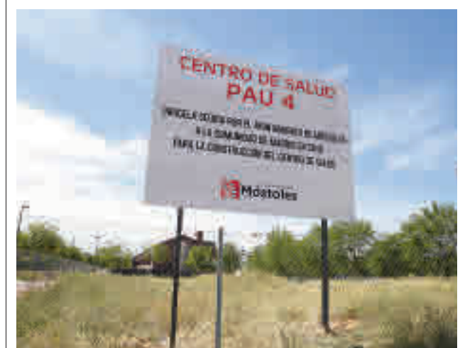
Parcela cedida para el centro de salud

La Policía Nacional ha detenido a tres individuos por sustraer productos cosméticos valorados en 50.000 euros de una nave de Valdemoro.