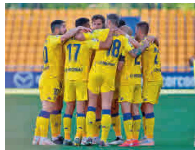
Los alfareros sumaron tres puntos vitales ante el Sabadell

el ascenso. El Leganés tiene al alcance de la mano ese objetivo, aunque se dejara dos puntos en el camino en su visita a Anduva (empate sin goles) ante un Mirandés que solo se jugaba la honra. Este lunes, Leganés-Málaga. Los otros dos representantes madrileños, Rayo y Fuenlabrada, se medirán a Castellón y Sporting, respectivamente.