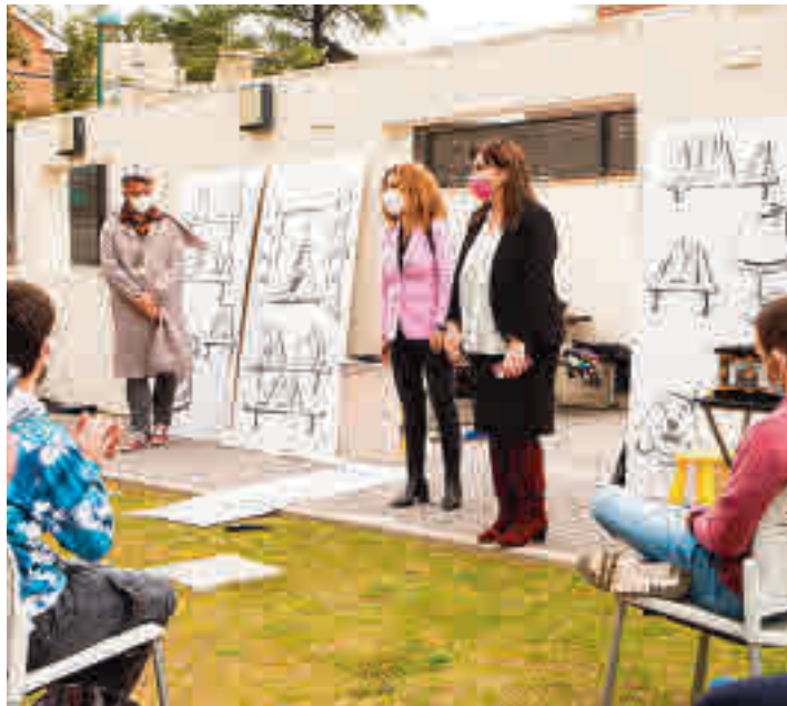
Un acto de la alcaldesa de la localidad

Según fuentes municipales, el plazo de preinscripción