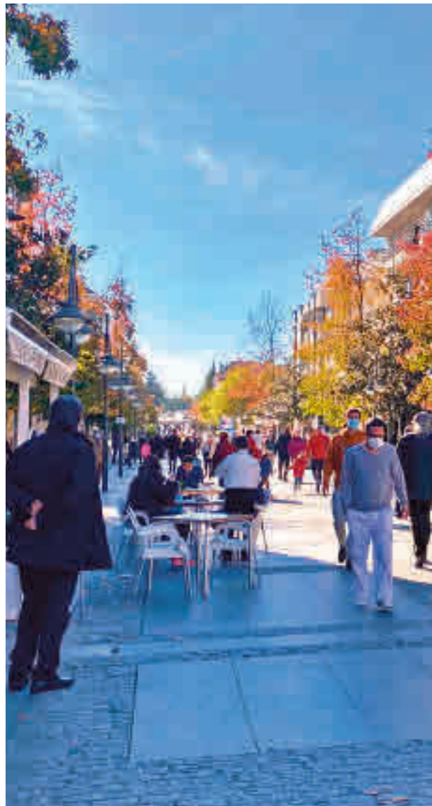
Majadahonda podría salir de su cierre perimetral

Precisamente Majadahonda sigue siendo, a pesar de su evidente mejoría, la localidad con un índice de contagios más elevado de todo el