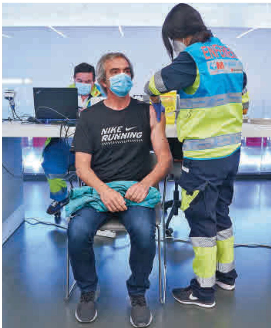
Los menores de 60 años recibieron la vacuna de AstraZeneca hace más de dos meses

embargo, ante la resistencia de varios consejeros, como los de Madrid, Cataluña o Andalucía, la ministra Carolina Darias abrió la puerta a que "las personas que prefieran recibir la segunda dosis de AstraZeneca firmando un consentimiento informado".