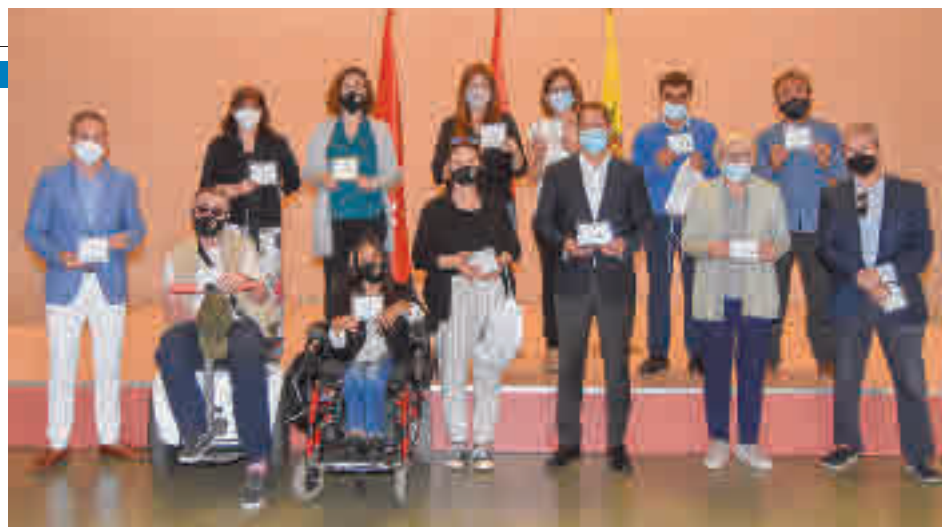
Acto de entrega

Destinadas a personas con diversidad funcional sin recursos • En la iniciativa colabora la asociación Mírame Torrejón