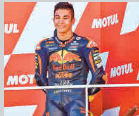
Fernández ya ha subido en tres ocasiones al podio

La otra gran noticia para el equipo de Torrejón de Ardoz es que el balance aún no es definitivo. Con varios partidos pendientes de la fase regular, los interistas miran a un 'play-off' por el título que promete estar más reñido que nunca. Levante, Jimbee Cartagena o Palma Futsal se han mostrado como sólidas alternativas al dominio que años atrás ejercieron el propio Inter, ElPozo y el Barça. Antes de esas eliminatorias, el Inter tendrá que afrontar un maratón de cuatro partidos de Liga en apenas nueve días.