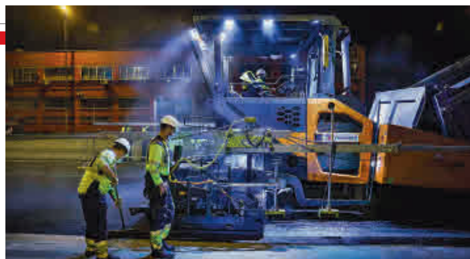
Trabajos sobre la calzada de la M-506

tenimiento de las instalaciones semafóricas y luminosas de la red. Por último, el quinto eje de actuación se centra en las actuaciones de acondicionamiento y conservación de las travessías, márgenes e isletas.