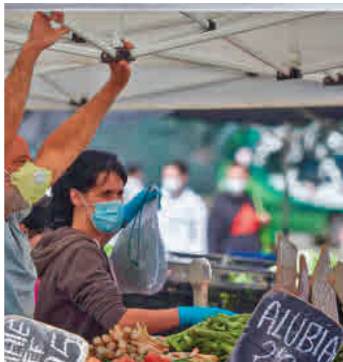
El gremio del comercio ambulante, muy afectado por la pandemia

En la actualidad son ciento cuarenta y ocho los pue-