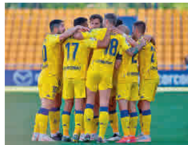
Los alfareros sumaron tres puntos vitales ante el Sabadell

el ascenso. El Leganés tiene al alcance de la mano ese objetivo, aunque se dejara dos puntos en el camino en su visita a Anduva (empate sin goles) ante un Mirandés que solo se jugaba la honra. Este lunes, Leganés-Málaga. Los otros dos representantes madrileños, Rayo y Fuenlabrada, se medirán a Castellón y Sporting, respectivamente.