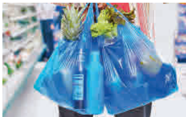
Bolsas de plástico

0,45 euros el kilo. Entre los productos de plástico de un solo uso sujetos a reducción están los vasos para bebidas, incluidos sus tapas y tapones, y los recipientes alimentarios destinados al consumo inmediato, cuya comercialización ha de reducirse un 50% en 2026 con respecto