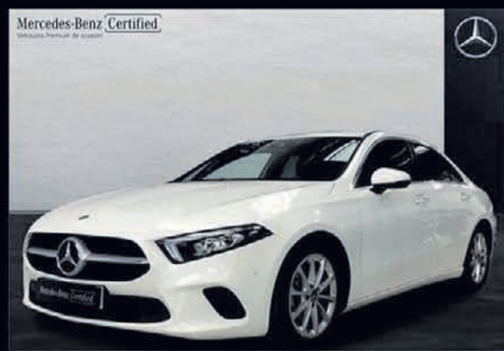
Clase A 180 d. Sedan. Automático. 7G-DCT. 32.900€*