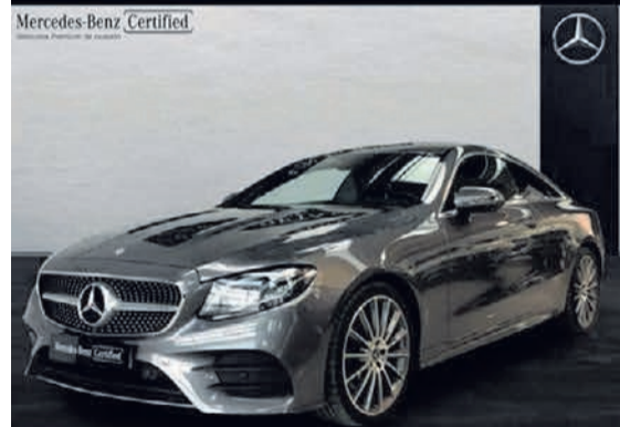
Clase E 220 d Coupé. AMG Line. Automático. 9G-TRONIC. 39.500€*