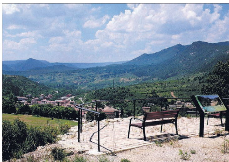
Uno de los espacios naturales que ofrece la provincia de Burgos.