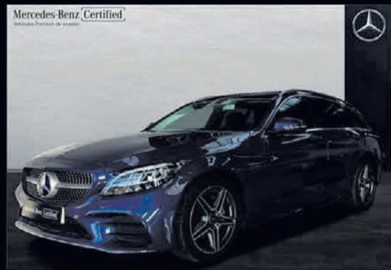
Clase C 220 d Estate. AMG Line. Automático. 9G-TRONIC. 35.900€*