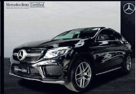
GLE 350 d Coupé. 4MATIC AMG Line. Automático. 9G-TRONIC. 58.900€*