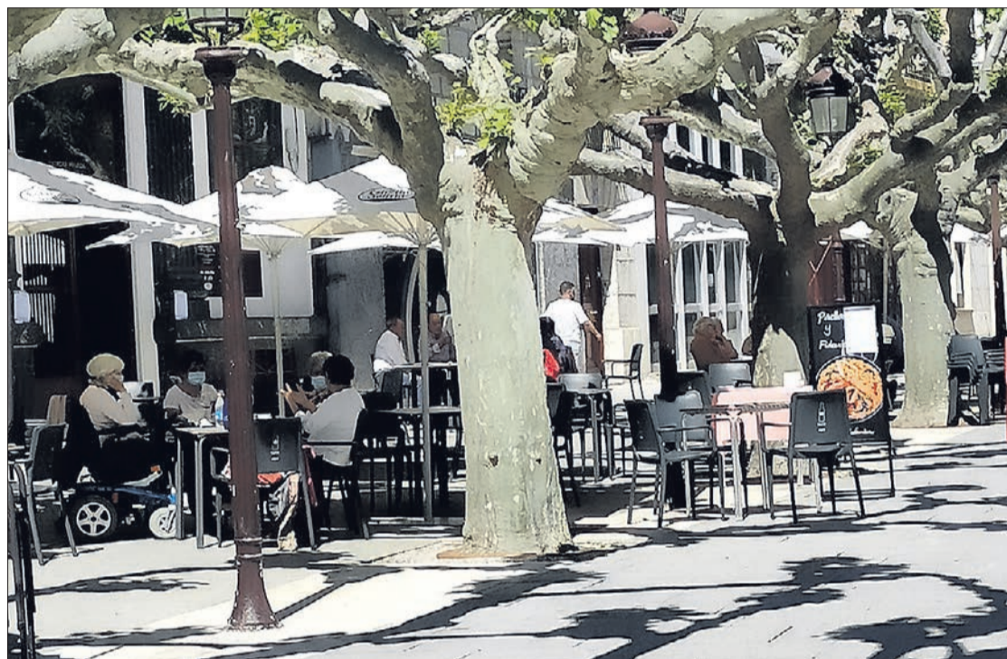
Imagen de la terraza de un establecimiento hostelero en la ciudad.