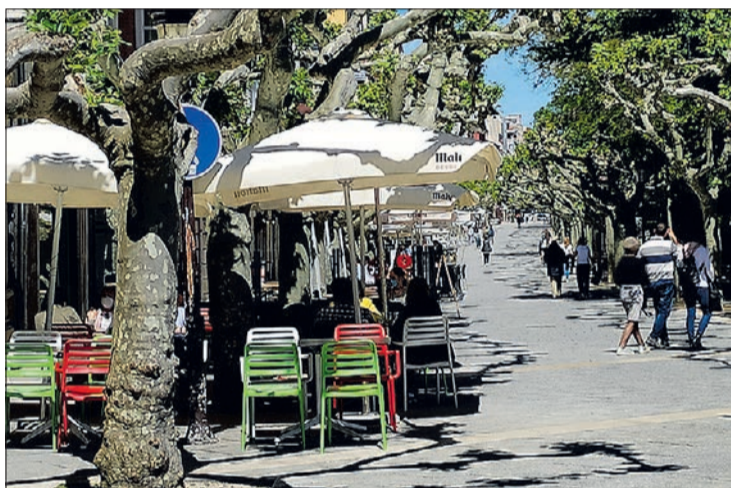
En el nivel 3 se establece como horario de cierre la una de la madrugada para terrazas.

Lo que ha motivado la rebaja del nivel de alerta pandémica es la paulatina mejora de la situación epidemiológica y asistencial, directamente relacionada con el avance de la vacunación de la población castellana y leonesa frente a la COVID-19.