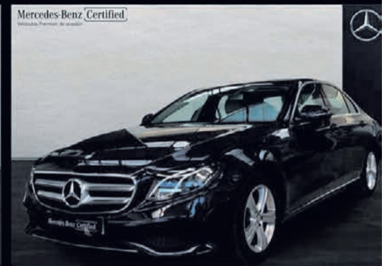
Clase E 220 d. AVANTGARDE. Automático. 9G-TRONIC. 29.900€*