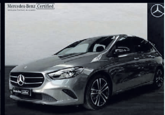
Clase B 200 d. Progressive. Automático. 8G-DCT. 29.900€*