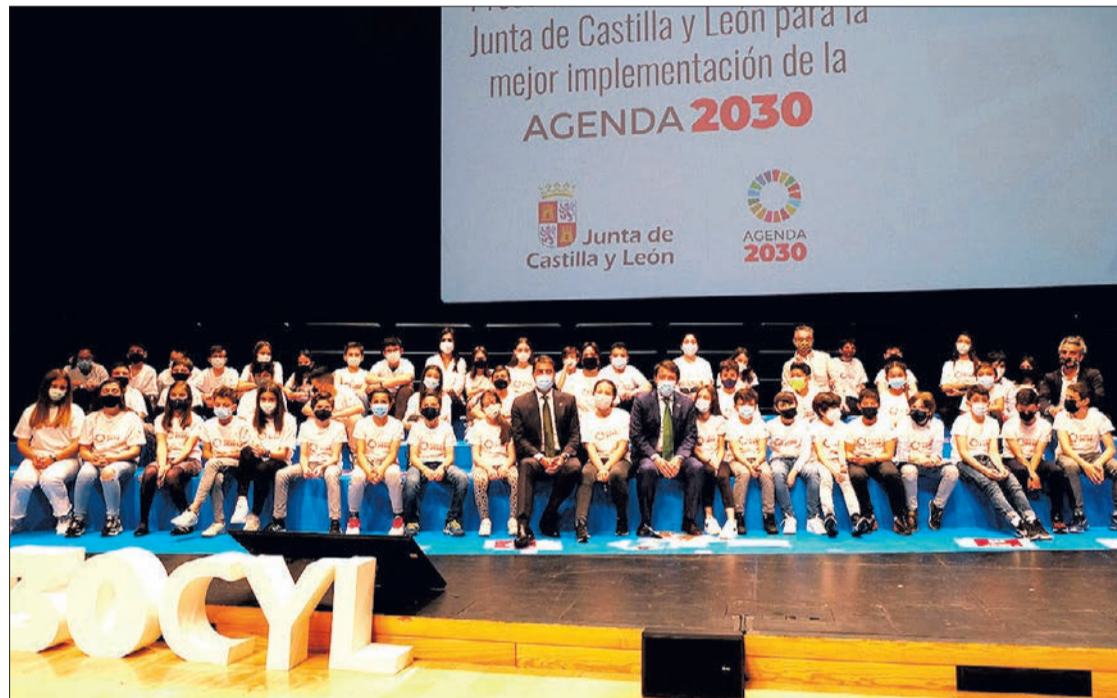
Foto de grupo al final de la ceremonia en la que se presentó el plan sostenible de la Junta, en el Fórum Evolución, el martes 18.

De este modo, Mañueco puso de relieve otras cuestiones, como que Castilla y León también presenta cifras mejores que la media en crecimiento, empleo y peso industrial, con una tendencia creciente en investigación e innovación, situándose en el