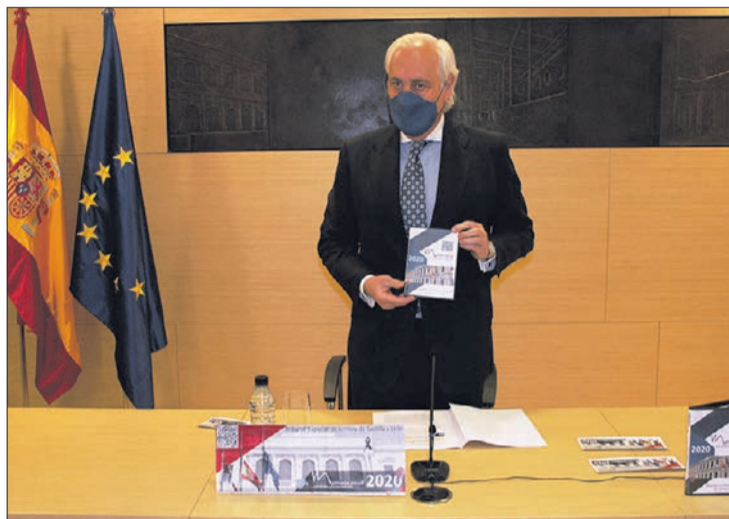
El presidente del TSJCyL, José Luis Concepción, el lunes 17.

No obstante, en cuanto a los asuntos en trámite, los datos se mantienen constantes, "ascendiendo ligeramente". De los 107.399 pendientes que existían al finalizar el año 2019, se ha pasado a los 117.597 que se contabilizan en 2020. Del mismo modo,