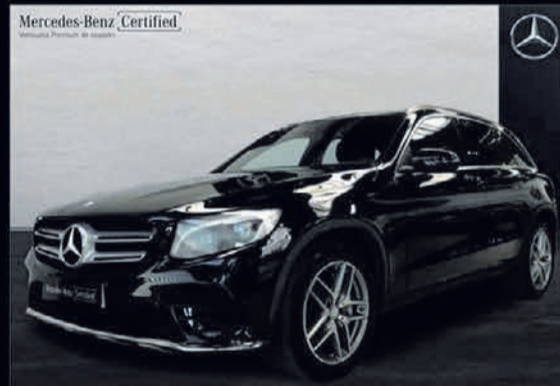
GLC 220 d. 4MATIC AMG Line. Automático. 9G-TRONIC. 39.500€*