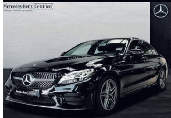
Clase C 200 d. AMG Line. Automático. 9G-TRONIC. 34.500€*