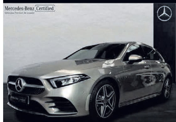
Clase A 180 d. AMG Line. Automático. 7G-DCT. 29.900€*