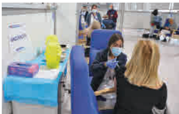
Vacunación en el Hospital Isabel Zendal

vocándoles para recibir AZ, que podrán aceptar o rechazar y que permitirá también solicitar un cambio de cita. Aunque el usuario acepte el mensaje para recibir AZ, in situ tendrá la opción de poder ser inoculado con Pfizer. En ambos casos, se deberá firmar previamente un consen-