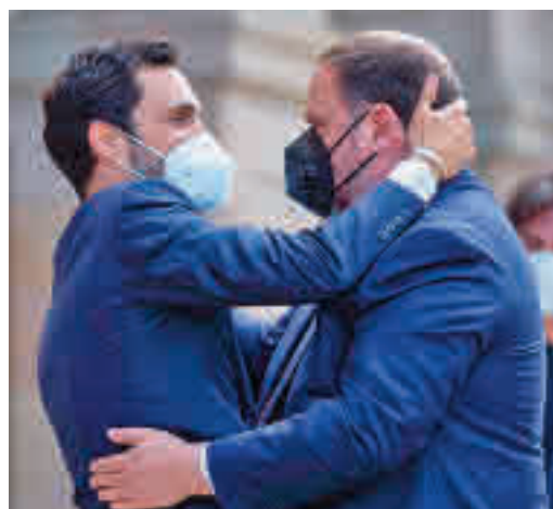
Los presos del procès vuelven a ser noticia

EL PERIÓDICO GENTE NO SE RESPONSABILIZA NI SE IDENTIFICA CON LAS OPINIONES QUE SUS LECTORES Y COLABORADORES EXPONGAN EN SUS CARTAS Y ARTÍCULOS