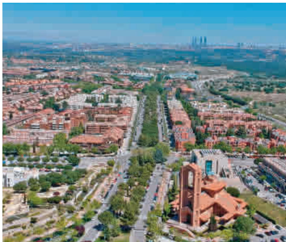
Pozuelo de Alarcón

Por su parte, Deliveroo ha asegurado que respeta el fallo del Alto Tribunal que considera que los 532 repartidores de la plataforma de 'delivery' son asalariados al inadmitir su recurso, pero que "no comparte" la decisión. La plataforma de reparto a domicilio ha subrayado que su modelo de negocio "siempre ha proporcionado a los 'riders' la flexibilidad".