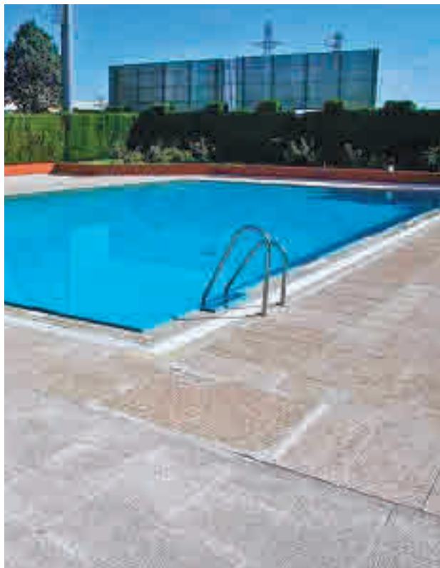
Las piscinas de Getafe abrirán el 1 de junio