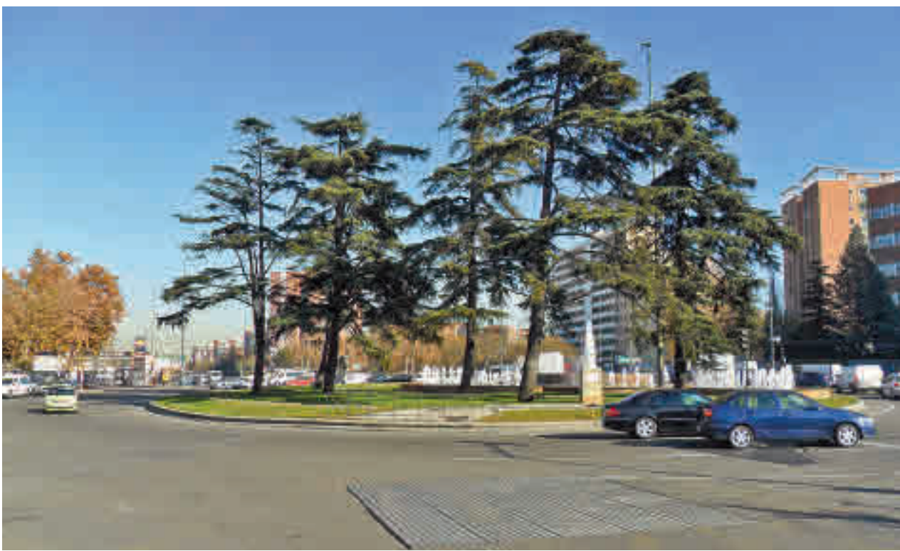
Varios vehículos circulan por el entorno de Plaza Elíptica