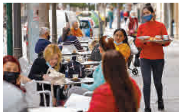
Una terraza del Centro de la capital

Madrid, José Luis Martínez-Almeida, tras reunirse este miércoles 26 de mayo con miembros de la Asociación Empresarial de Hostelería de la Comunidad de Madrid, AMER, Hostelería Madrid y el Gremio de Hosteleros Plaza Mayor. El primer edil aseguró que los hosteleros ga-