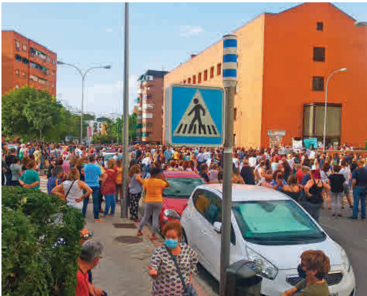
AV LA INCOLORA