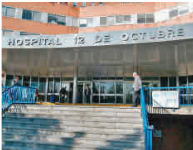
Investigadores del 12 de octubre están detrás del estudio

rique Ruiz Escudero, replica que no se cerrará ningún centro de salud este verano en la región, aunque se adaptarán a la actividad asistencial, “como todos los veranos o cuando hay una situación de pandemia”.