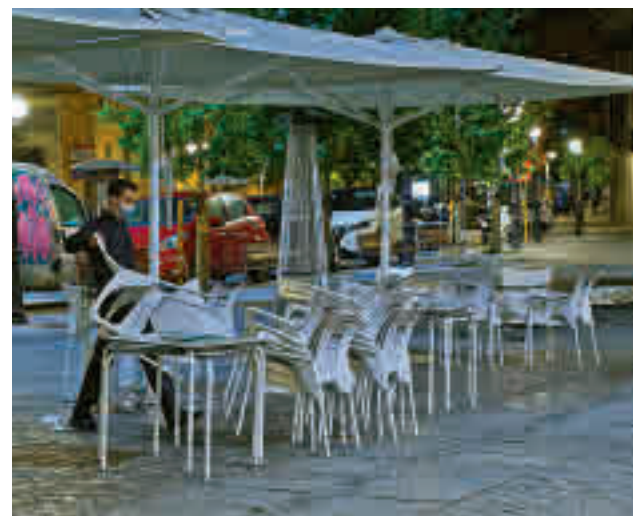
La normativa regula también la hostelería