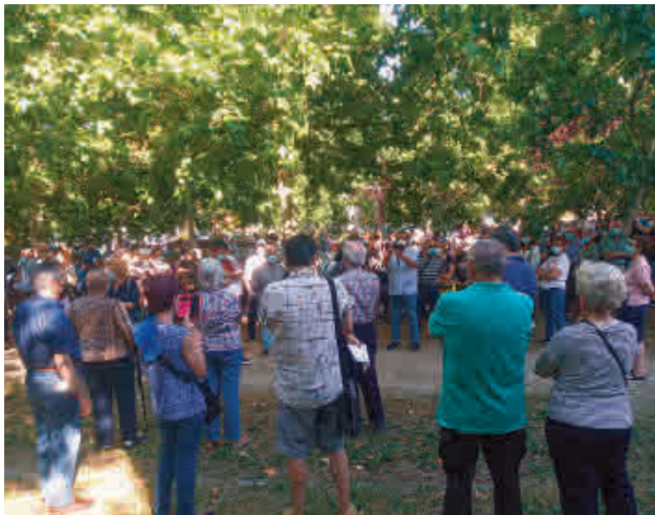
La protesta vecinal que tuvo lugar en el distrito de Usera

“Es muy grave lo que está ocurriendo en este centro de Atención Primaria, ya que se