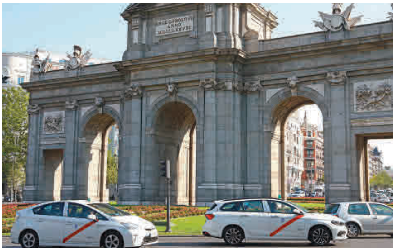
Varios taxis transitan por el entorno de la Plaza de Cibeles