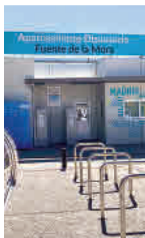
El parking Fuente de la Mora

el Ayuntamiento de Madrid para la construcción del aparcamiento intermodal de Tres Olivos, cuyo contrato de obras por importe de 14,8 millones de euros fue aprobado la semana pasada. El estacionamiento estará ubicado en las