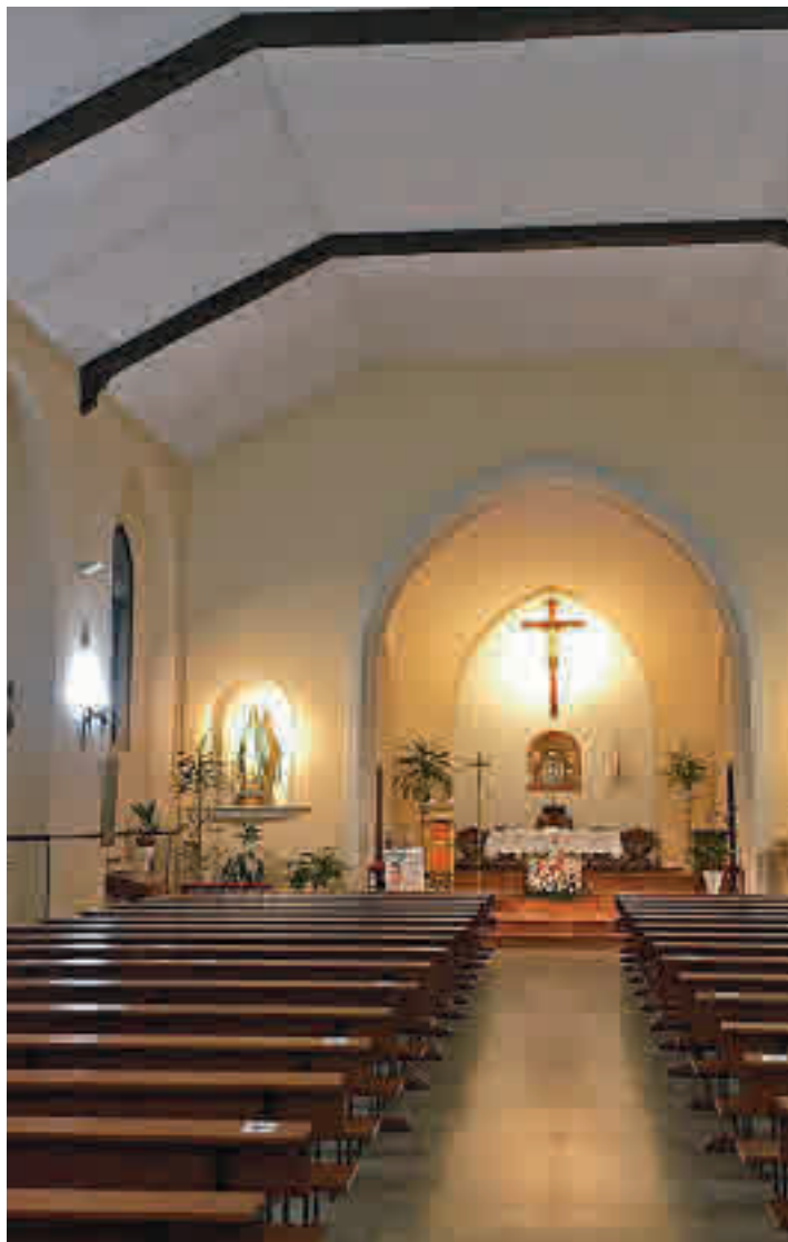
El interior del templo neomudéjar obra del arquitecto Enrique Repulles

SU ENTORNO SE VIO EN PELIGRO POR LA FALLIDA CREACIÓN DE UN MACROGIMNASIO