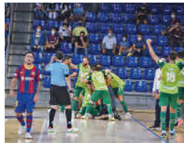
El conjunto de Torrejón volvió a asaltar el Palau LNFS

minatoria de cuartos de final este mismo domingo 6 de junio (20 horas). Además, tiene la oportunidad de hacerlo al calor de su público, ya que el partido se disputará en el Jorge Garbajosa de Torrejón de Ardoz. En el caso de lograrlo, el Inter Movistar pensaría ya en las semifinales, donde se medirá al ganador del Palma Futsal-Zaragoza.