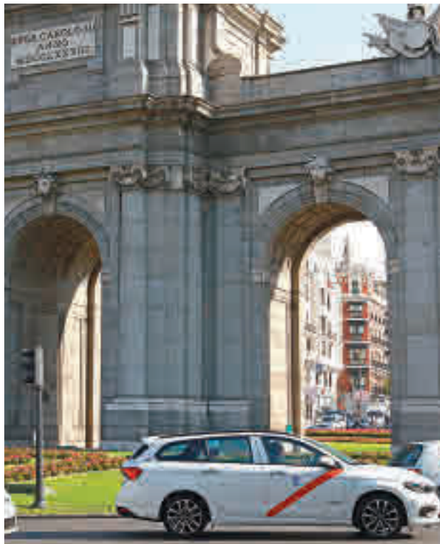
Varios taxis transitan por el entorno de la Plaza de Cibeles

Además, el servicio se ceñirá a una nueva licencia por puntos para evitar engaños