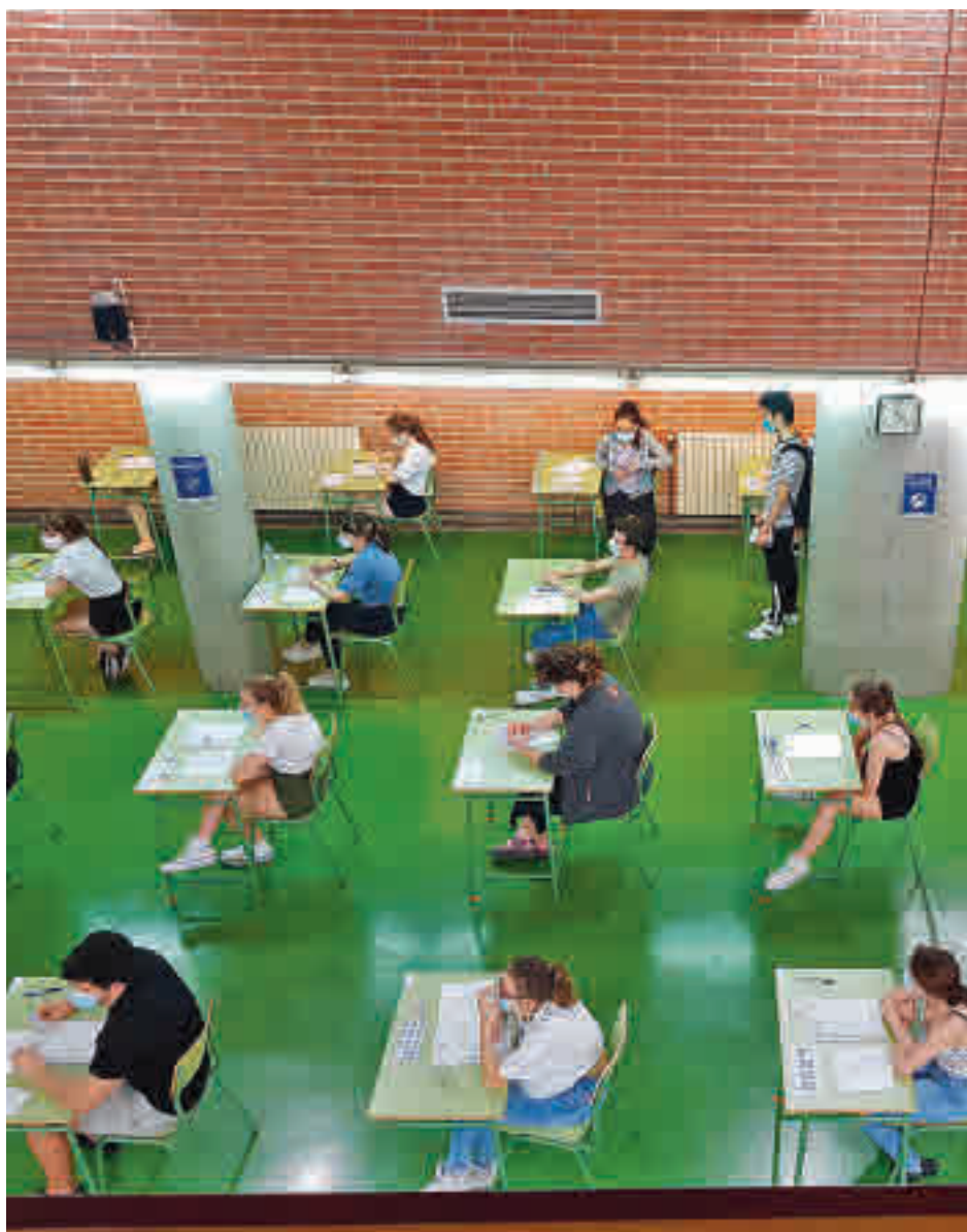
Estudiantes haciendo la selectividad en 2020

Por su parte, el Consorcio Regional de Transportes de Madrid (CRTM) ha puesto en marcha un Plan especial de Movilidad para los cuatro días de duración de la EBAU que contempla el refuerzo de las líneas de Metro, Metro ligero, autobuses urbanos e interurbanos que se dirigen a los campus, así como Cercanías de Renfe para garantizar las