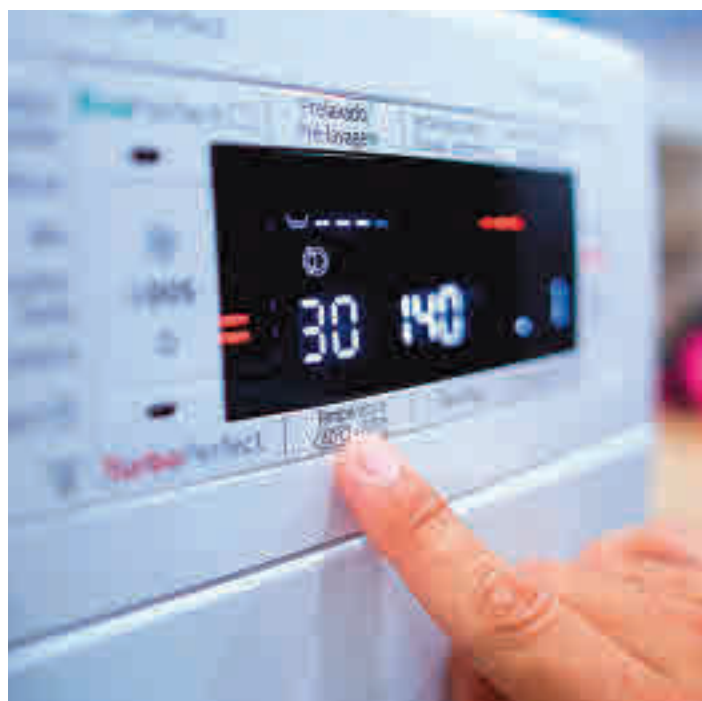
El uso de los electrodomésticos, bajo la lupa

Lo siguiente es un cambio en el recibo de la luz a partir del 1 de junio para aquellas viviendas acogidas a la tarifa regulada, que busca incenti-