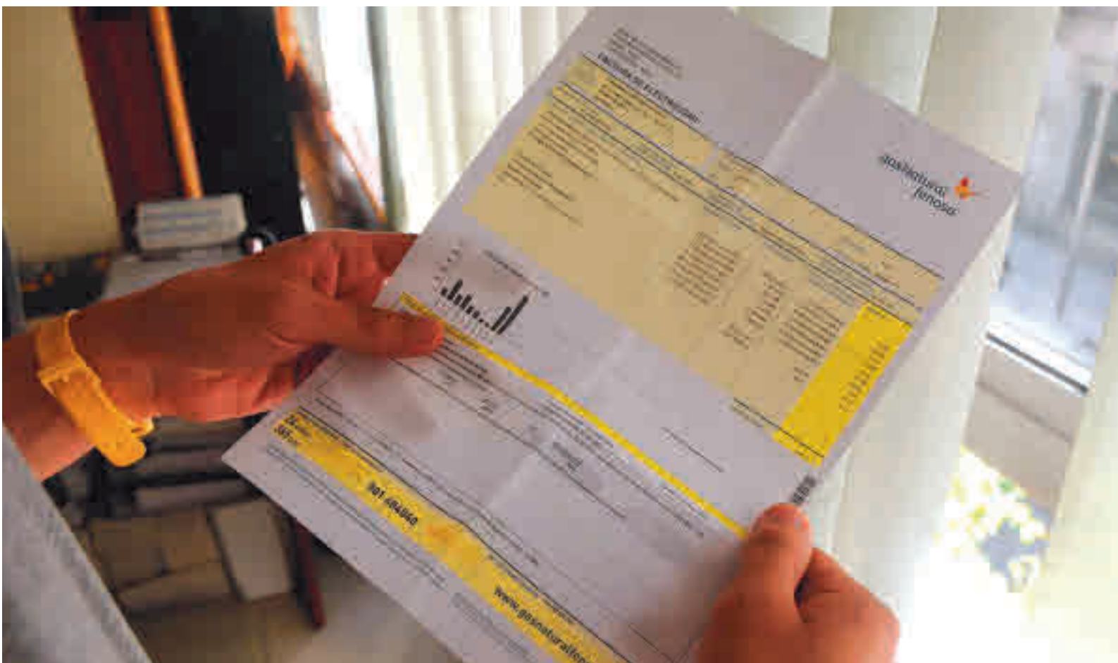
Los cambios en la tarificación afectan directamente a los consumidores GENTE