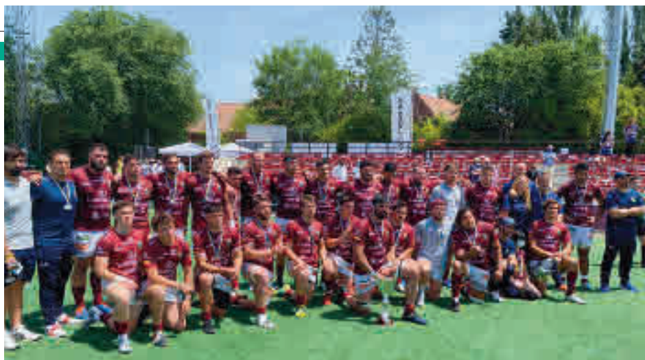
El Lexus Alcobendas Rugby se tuvo que conformar con el subcampeonato liguero

A pesar de la decepción sufrida por el Lexus Alcobendas, no todas las noticias para el rugby madrileño fueron nega-