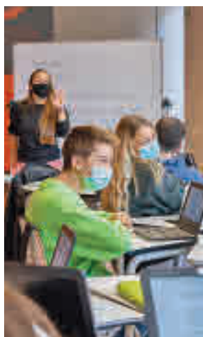
Uno de los proyectos

al EduCaixa Challenge 2021 con proyectos y análisis basados en los Objetivos de Desarrollo Sostenible (ODS) y vinculados a la nueva realidad ocasionada por la Covid-19. Todos debían tener una cosa en común: aportar valor a la sociedad empoderándose como agentes para el cambio social.