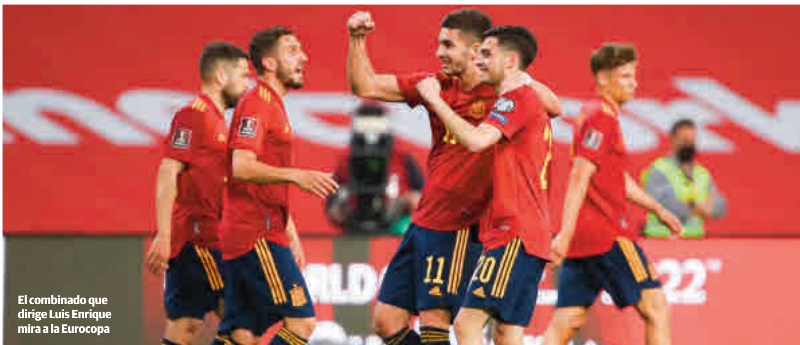
El combinado que dirige Luis Enrique mira a la Eurocopa

LAS CONEXIONES MADRID-SEVILLA SERÁN UNA CONSTANTE EN ESTAS SEMANAS