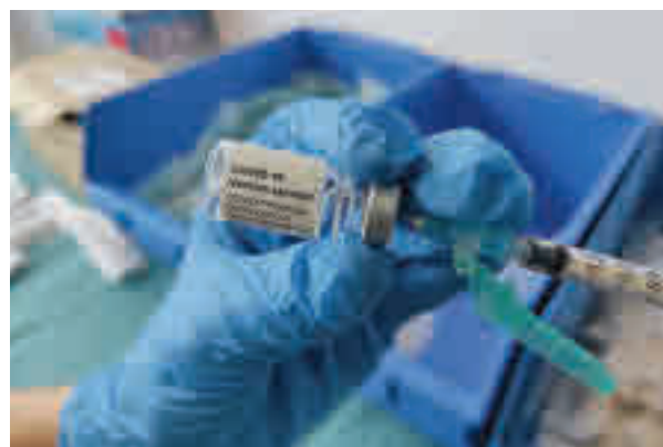
Vacunación con Janssen

Esta última es la gran novedad, ya que hasta esta semana solo se contemplaba su uso en los mayores de 50 años. El