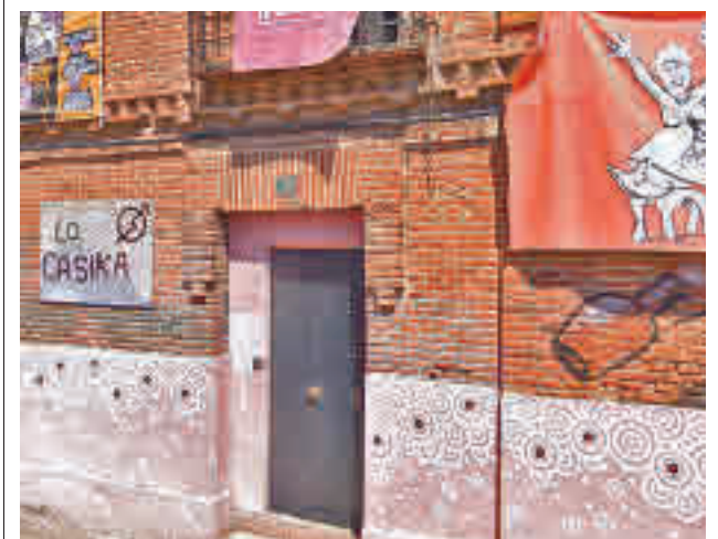
Fachada de La Casika

La Policía local de Valdemoro desalojó el pasado fin de semana a casi 500 personas que participaban en varios macrobotellones.