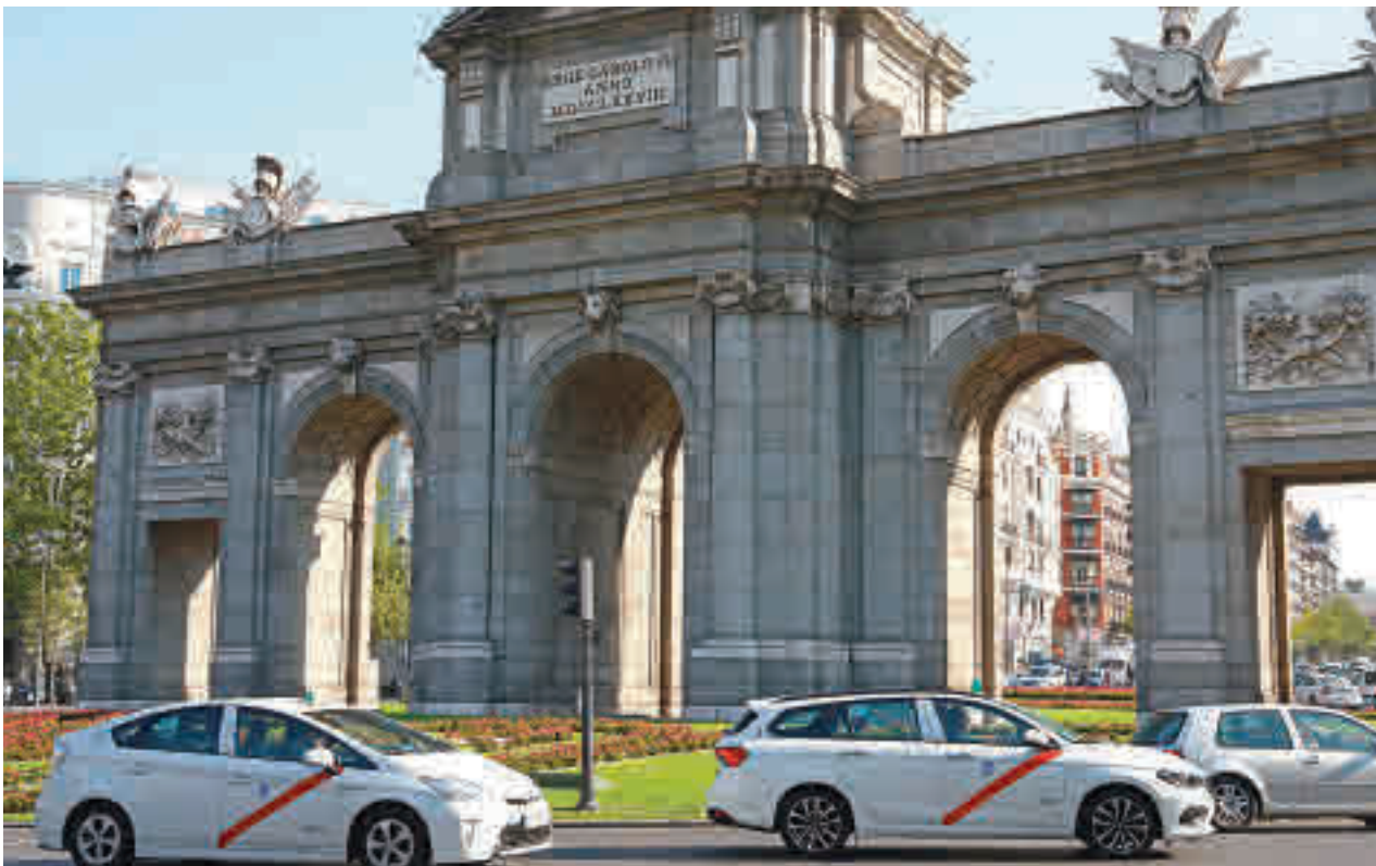
Varios taxis transitan por el entorno de la Plaza de Cibeles