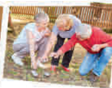
Juegos al exterior