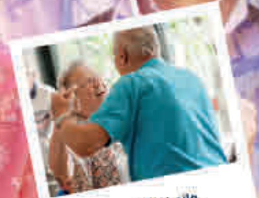
Clases de baile