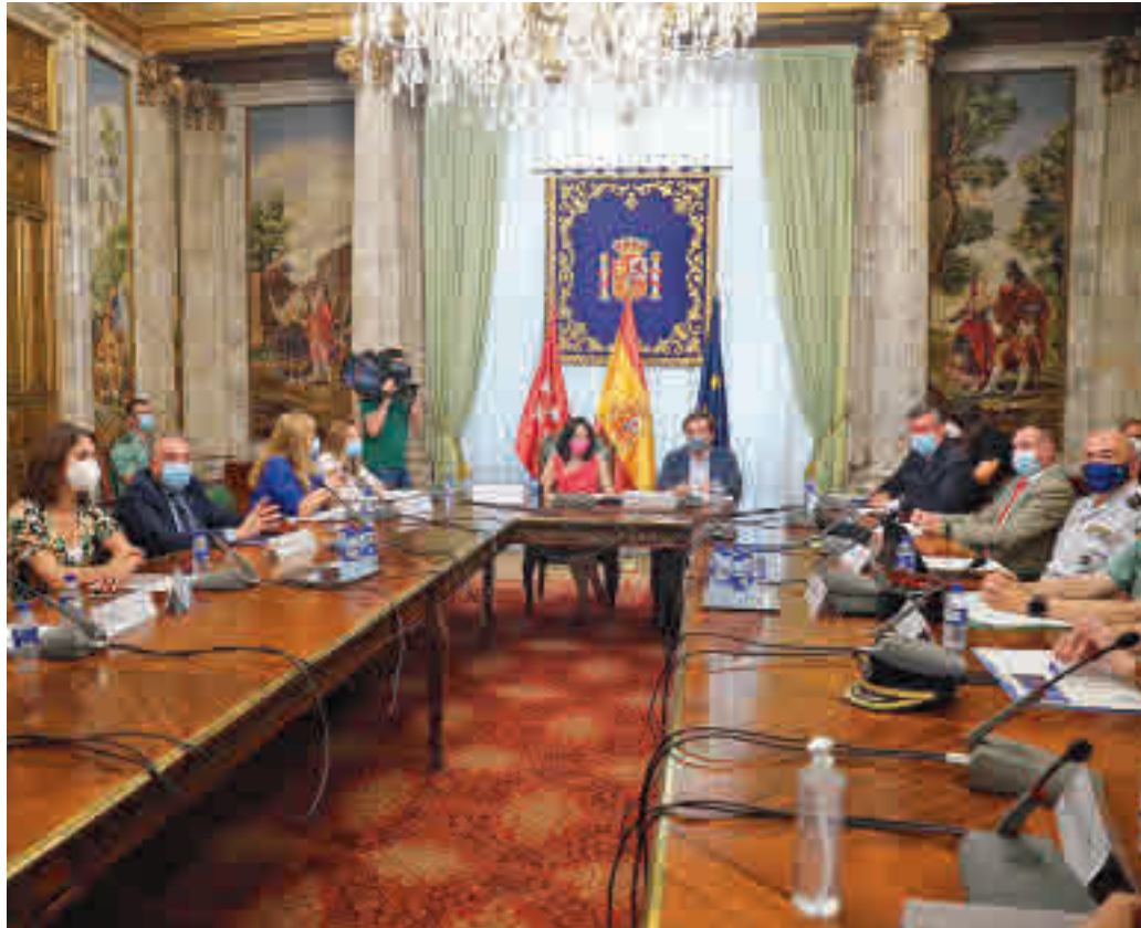
Los participantes en el Consejo Local y en la Junta Local de Seguridad

Más al detalle, los homicidios dolosos y asesinatos consumados pasaron de 16 en 2019 a 15 en 2020 (-6,3%). Descendieron también los delitos graves y menos graves de lesiones y riñas tumultuarias (de 1.447 a 1.310, un