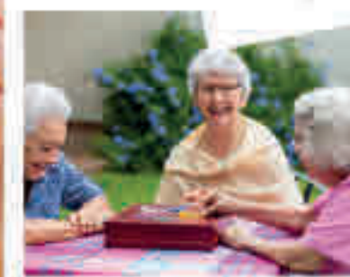
Juegos de mesa