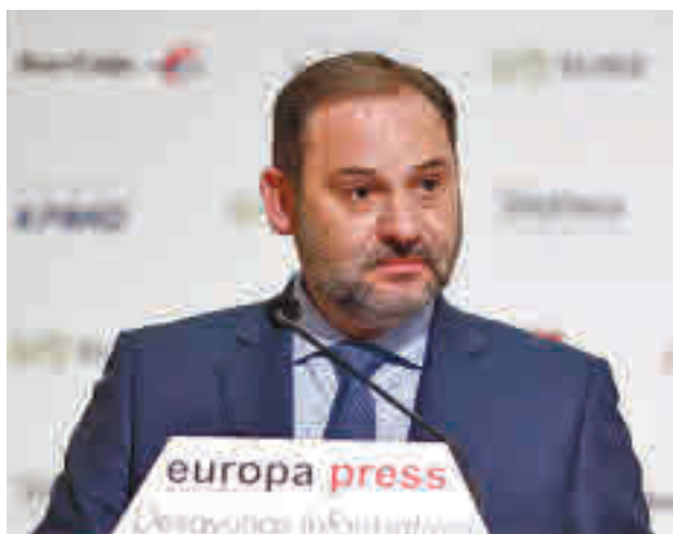
José Luis Ábalos

Se pretende conjugar la necesaria atención de las emergencias con la seguridad jurídica de propietarios.