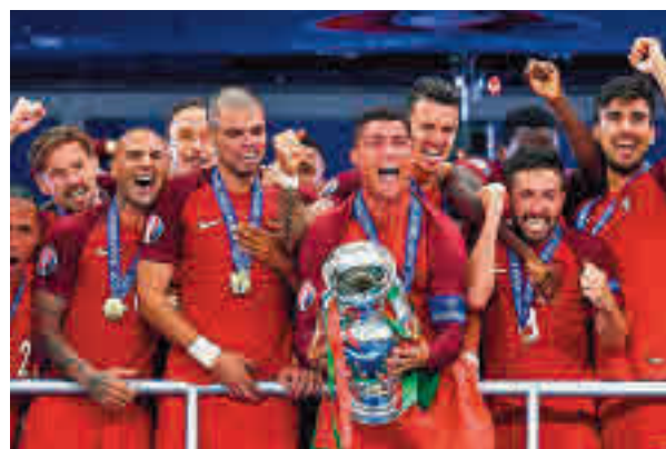
Portugal defiende la corona lograda hace cinco años

A pesar de su decisión inicial, Luis Enrique ha tenido que citar a varios jugadores a última hora para conformar una burbuja paralela. Futbolistas como Albiol, Kepa Arriabalaga o Brais Méndez tendrán unos días para ilusionarse con su presencia en la Eurocopa, ya que la lista puede modificarse hasta 48 horas antes del debut.