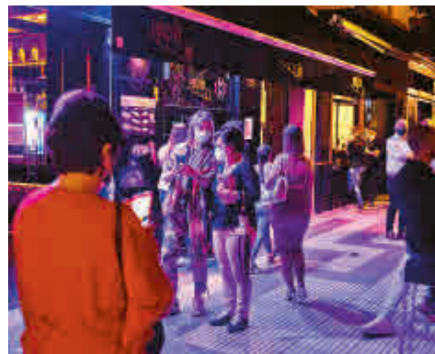
Las comunidades decidirán sobre el ocio nocturno

La actriz María Luisa Merlo sigue de gira con la obra 'Mentiras inteligentes'