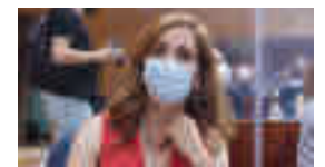
Mónica García: MÁS MADRID