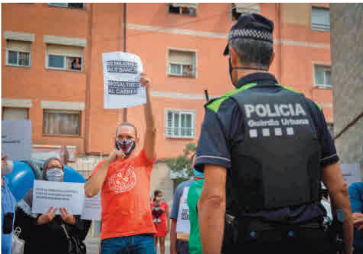
Los desahucios han crecido en el primer trimestre de este año