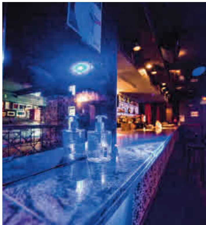
El ocio nocturno podría volver en breve

ahora. Madrid, Andalucía, País Vasco, Cataluña, Galicia y Murcia rechazaron esa propuesta e incluso Madrid consiguió que la Justicia la paralizase. En concreto, la Audiencia Nacional dio la razón al Gobierno de Isabel Díaz Ayuso y aceptó la suspensión cautelarísima de las medidas, señalando que “el escenario de incertidumbre se vería seriamente agravado y perjudicado si se admite un cambio en el nivel de restricciones”. “Se generarían así tres niveles distintos de restricción en un lapso temporal breve, lo que no es fácilmente justificable para el ciudadano”, concluía.