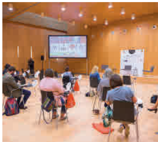
Asistentes al Congreso

En lo que respecta a las rutas 'foodies' urbanas, estas darán preferencia a experiencias exclusivas de vanguardia, como