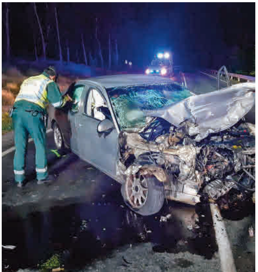
Los siniestros siguen teniendo protagonismo en tiempos de pandemia

Asimismo el número de coches con exceso de velocidad se incrementó un 39% mientras que el 20% de quienes se ponen al volante reconocen consumir más alcohol, drogas y medicación que antes de la pandemia y el 16% de los automovilistas cree que su habilidad para conducir es peor que antes de la crisis sanitaria. A la hora de analizar cuál