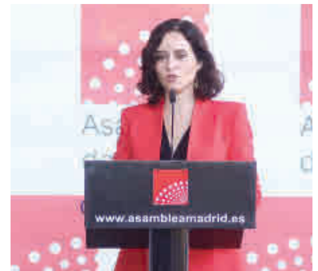
Isabel Díaz Ayuso

Desde el Partido Popular apuntan a que el objetivo es que el debate de investidura se realice la semana que viene. La primera sesión, con el discurso de Díaz Ayuso y la intervención de los portavoces, sería el jueves 17. Para el viernes 18 se dejaría la votación, en la que la popular no debería tener ningún problema. En caso de lograr la mayoría absoluta (más de la mitad de los votos favorables), el sábado 19 podría tomar posesión de un cargo que ya obtuvo hace menos de dos años.