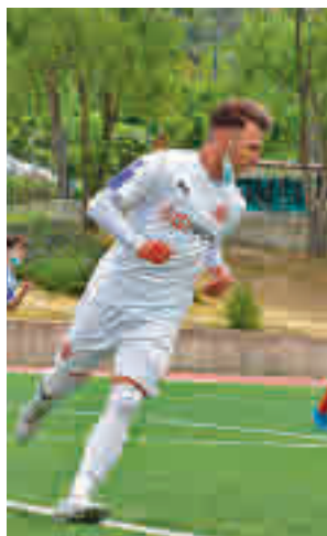
El Tres Cantos es segundo

dos últimas jornadas y lo hace con las dos plazas de ascenso prácticamente cerradas en el Grupo 1. El Galapagar y el Tres Cantos han calcado sus