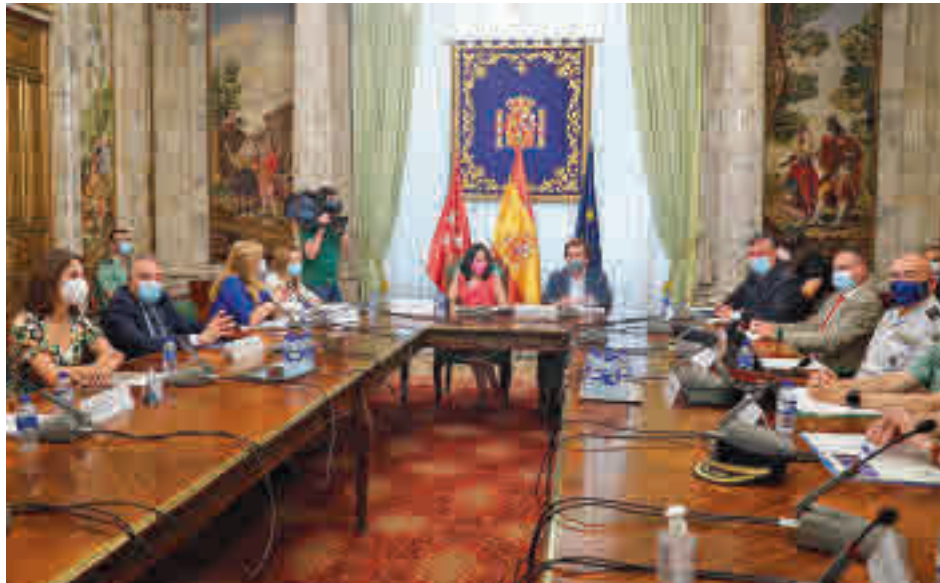
Los participantes en el Consejo Local y en la Junta Local de Seguridad

El número total de infracciones penales registradas en la ciudad se redujo un 27,3% en 2020 con respecto al año anterior, según los datos aportados por Policía Nacional, Guardia Civil y Policía Municipal en el transcurso de la reunión del Consejo Local y de la Junta Local de Seguridad de la capital, que tuvo lugar el 9 de junio en la sede de Delegación del Gobierno en Madrid. En este encuentro copresidido por la delegada del