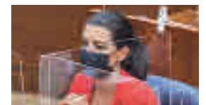
Rocío Monasterio: VOX