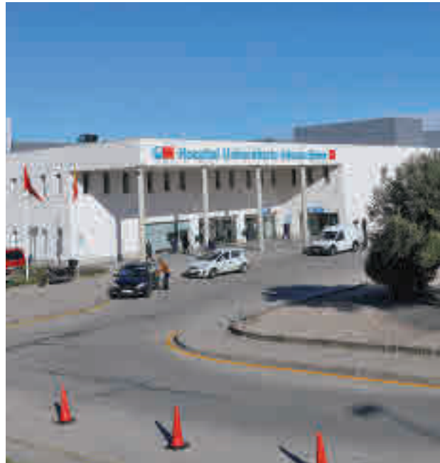
La incidencia solo sube en Valdemoro

En cuanto al resto, destacan en el apartado positivo dos