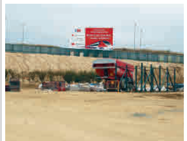
Obras abandonadas de la extensión ferroviaria

La Policía Local de Valdemoro ha detenido a un conductor que cuadruplicaba la tasa de alcohol permitida por una zona escolar.