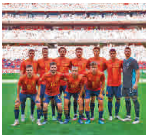
La selección, en un amistoso reciente en Madrid

EL PERIÓDICO GENTE NO SE RESPONSABILIZA NI SE IDENTIFICA CON LAS OPINIONES QUE SUS LECTORES Y COLABORADORES EXPONGAN EN SUS CARTAS Y ARTÍCULOS