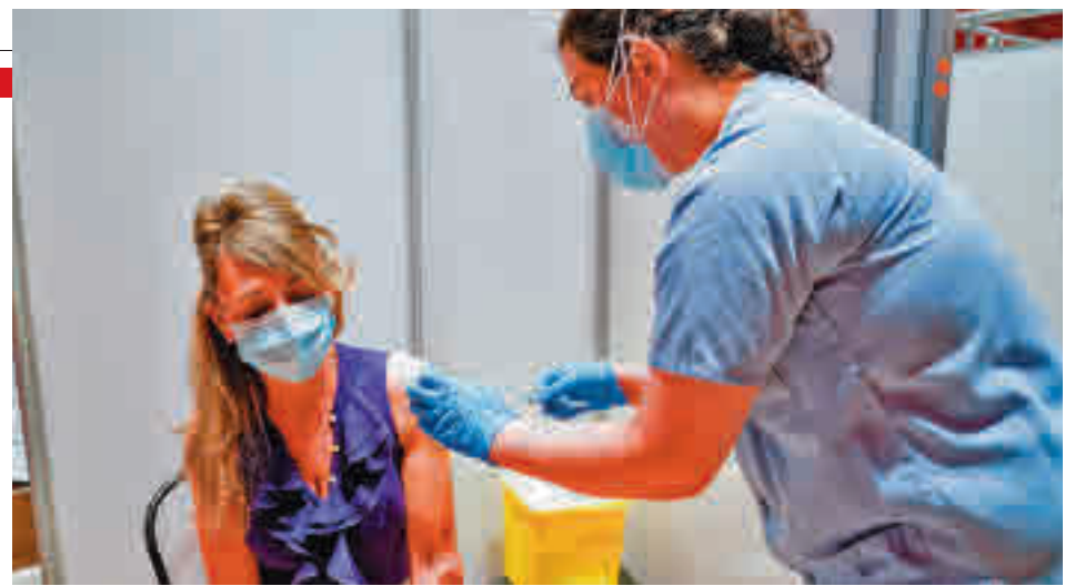
La vacunación sigue avanzando en la Comunidad de Madrid

Algunos dirigentes autonómicos ya han pedido que, en caso de que tengan que vacunar a ciudadanos desplazados desde otras comunidades, se les repongan las dosis o se rediseñe su reparto entre las regiones.