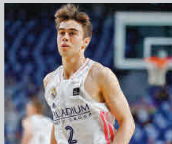
Núñez debutó con el primer equipo blanco

En el caso de repetirse ese resultado y el 0-0 de Montilivi, el Rayo regresaría a Primera, pero esos marcadores son solo meros antecedentes, ahora llega el turno de demostrarlo sobre el terreno de juego para recuperar, tres años después, el hueco entre los mejores equipos del país.