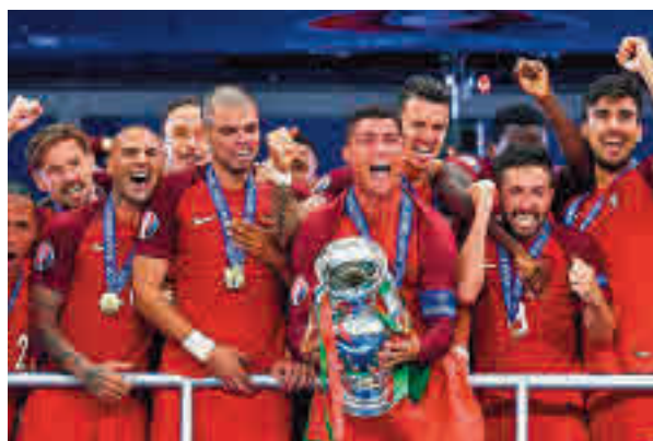
Portugal defiende la corona lograda hace cinco años

A pesar de su decisión inicial, Luis Enrique ha tenido que citar a varios jugadores a última hora para conformar una burbuja paralela. Futbolistas como Albiol, Kepa Arriabalaga o Brais Méndez tendrán unos días para ilusionarse con su presencia en la Eurocopa, ya que la lista puede modificarse hasta 48 horas antes del debut.