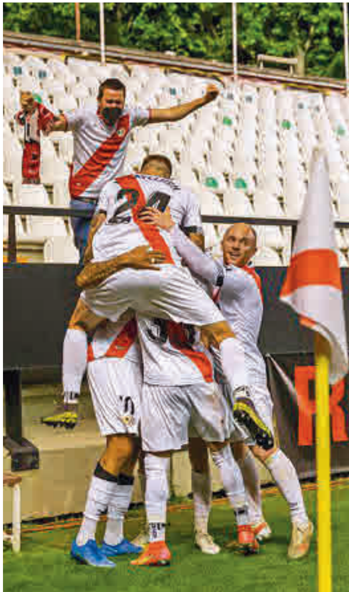
El público disfrutó en Vallecas de un triunfo clave ante el Leganés

El 3-0 en Vallecas ante uno de los rivales más sólidos en la faceta defensiva de toda la categoría, el CD Leganés, es