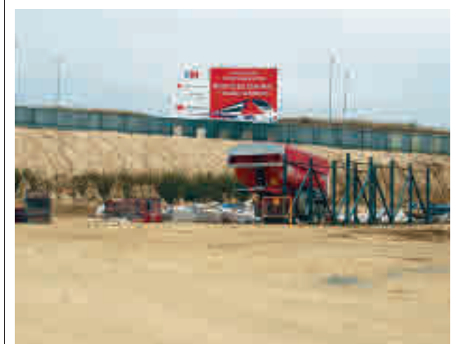
Obras abandonadas de la extensión ferroviaria

La Policía Local de Valdemoro ha detenido a un conductor que cuadruplicaba la tasa de alcohol permitida por una zona escolar.