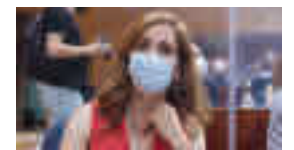
Mónica García: MÁS MADRID