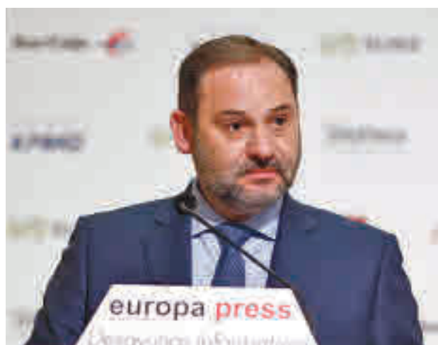
José Luis Ábalos

Se pretende conjugar la necesaria atención de las emergencias con la seguridad jurídica de propietarios.