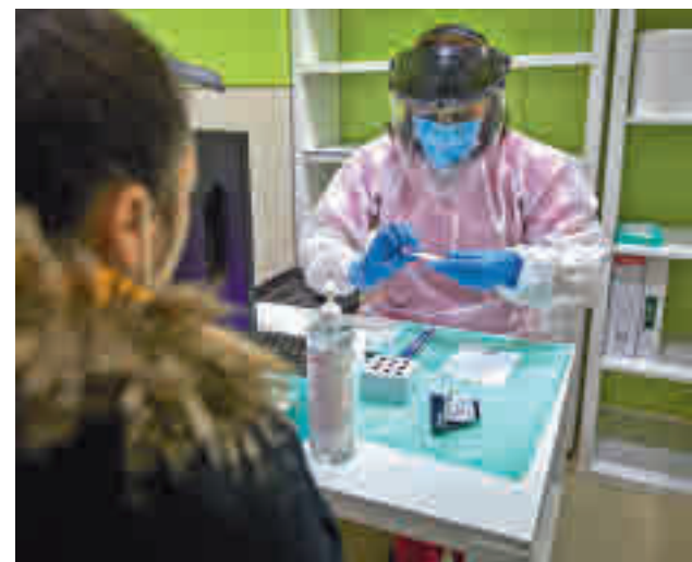
La incidencia continúa a la baja