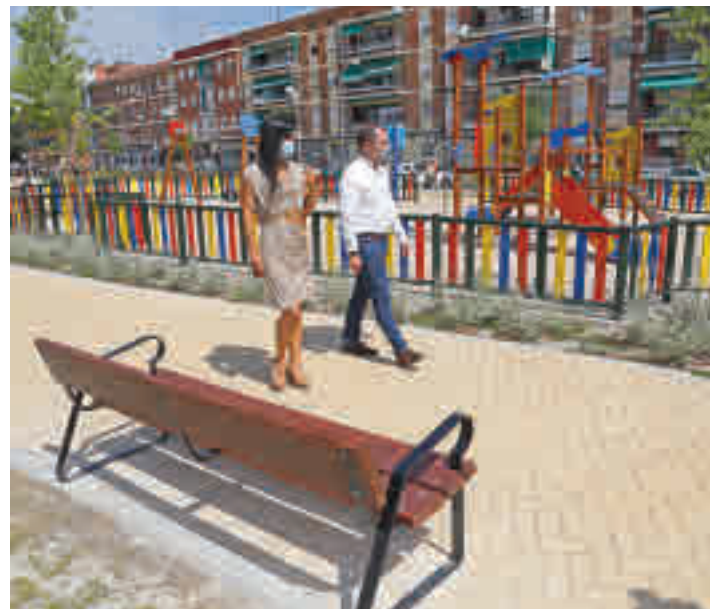
Villacís pasea por la el nuevo jardín de Villaverde

La zona estancial está situada en la calle Amadeo Fernández, en un solar utilizado como estacionamiento de vehículos ● La actuación ha dotado de un acceso más a un colegio cercano