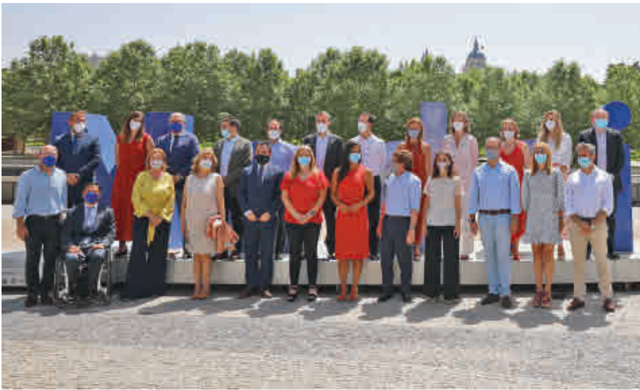
Foto de familia de los miembros del Gobierno municipal en Madrid Río