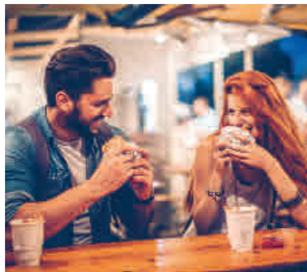
Una pareja conversa

gentedigital.es Toda la actualidad en nuestra página web