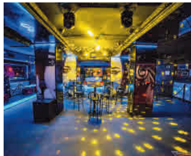
Las discotecas volverán a abrir