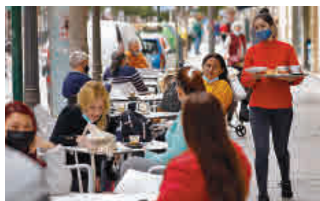
Una terraza situada en el Centro de la capital

Así lo avanzó este martes 15 de junio el alcalde de la capital, José Luis Martínez-Almeida, que incidió de nue-