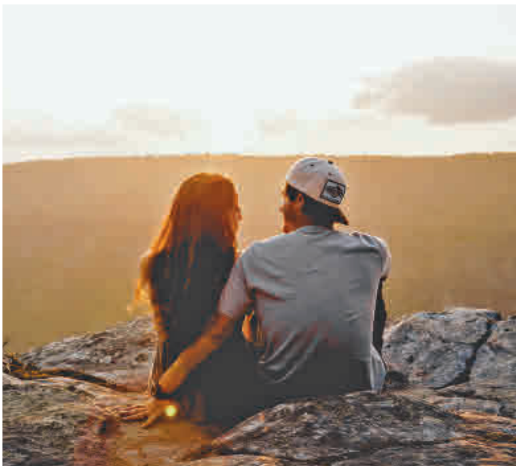
En busca de la pareja ideal

"Entender que no nos jugamos todo a una sola carta hace que nos dediquemos a conocer gente, vivir el momento y estar a gusto, algo que, por consecuencia, nos permite ser nosotros mismos y sacar nuestro verdadero yo", razona Esclápez.