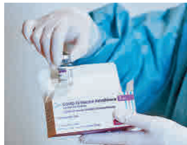
Vacunación con AstraZeneca

Los primeros estudios apuntan a que esta variante de la.. Covid-19 podría ser más contagiosa que las anteriores, aunque se desconoce si más dañina. Un informe publicado esta semana apunta a que las vacunas son efectivas contra ella, razón por la que la Comunidad pretende inmunizar cuanto antes a este grupo de edad.