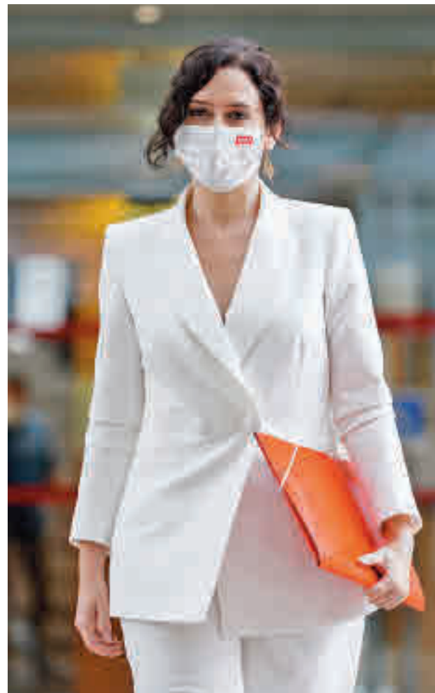
Isabel Díaz Ayuso dio su discurso de investidura

Con los votos favorables de los 65 representantes del Partido Popular garantizados, a la presidenta solo le hacen falta cuatro apoyos más para ser investida en la primera votación con mayoría absoluta. Esto sucedería si, como han