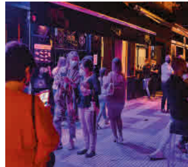
La noche madrileña vuelve a la actividad

El Gobierno regional señaló que será este viernes 18 cuando se dictará la modificación de la actual normativa, por lo que presumiblemente se publicará en el Boletín Oficial de la Comunidad de Madrid (BOCM) el sábado 19 y entrará en vigor el lunes 21. Los efectos no se empezarán a notar hasta el próximo fin de semana. La Consejería de Sanidad explicó que los siguientes pasos se tomarán gradualmente y que se revisarán cada 15 días en función de la situación sanitaria.