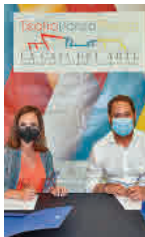
Firma del convenio

A cambio, la compañía realizará actividades como representaciones escenográficas, conferencias, exposiciones, talleres o clases online para acercar la danza a los torrejoneros. Además, cada actuación a nivel nacional que vaya a estrenar esta, se pre-estrenará en el Teatro José María Rodero de la ciudad.