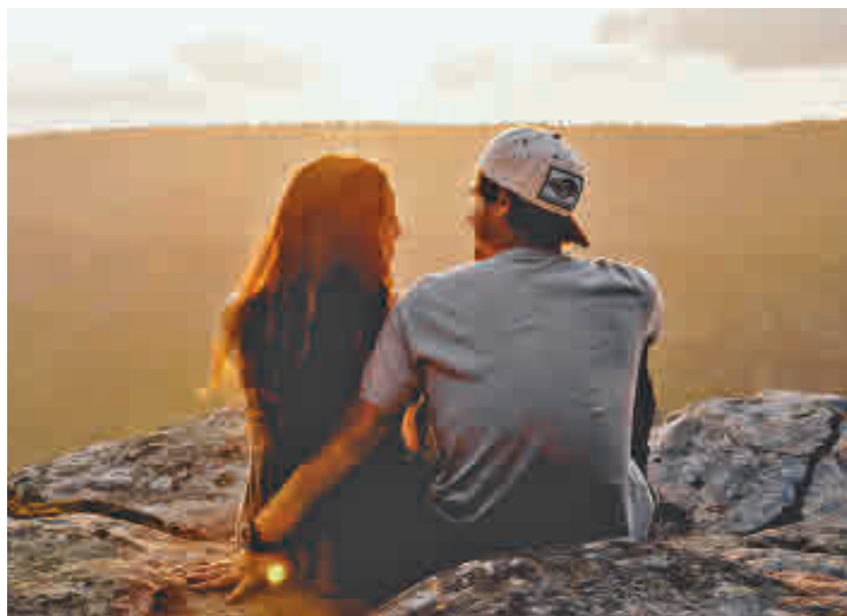
En busca de la pareja ideal