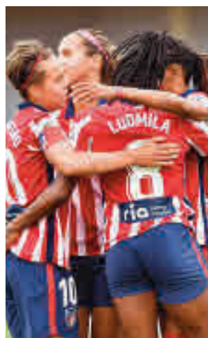
El Atlético es quinto

única incógnita de saber quién acompañará a EDF Logroño, Espanyol y Santa Teresa en el amargo viaje a Segunda División. Afortunada-