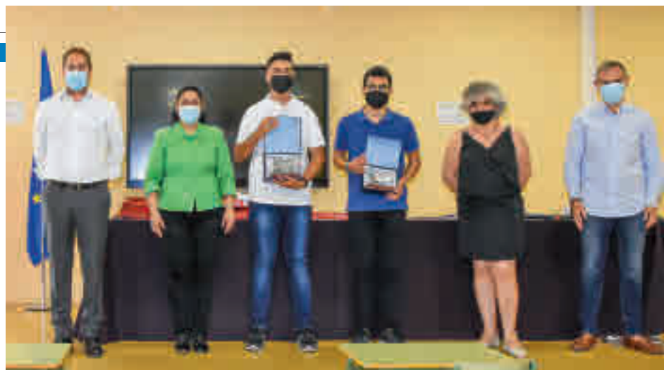
Los ganadores, junto a las autoridades locales

Ambos son estudiantes del IES Isaac Peral • Además recibieron un reconocimiento de manos del alcalde