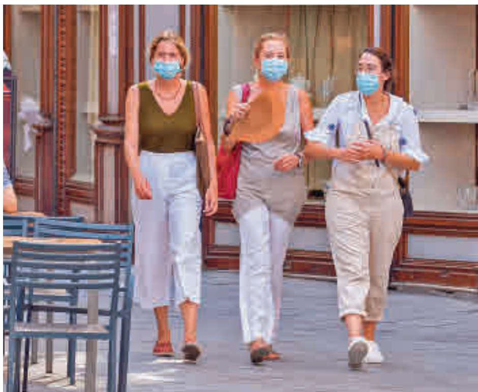
Las mascarillas siguen siendo obligatorias en el exterior

Algunas autonomías habían planteado este debate en el CISNS de esta semana, llegando incluso a proponer que se permita la flexibilidad a cada comunidad, pero por el