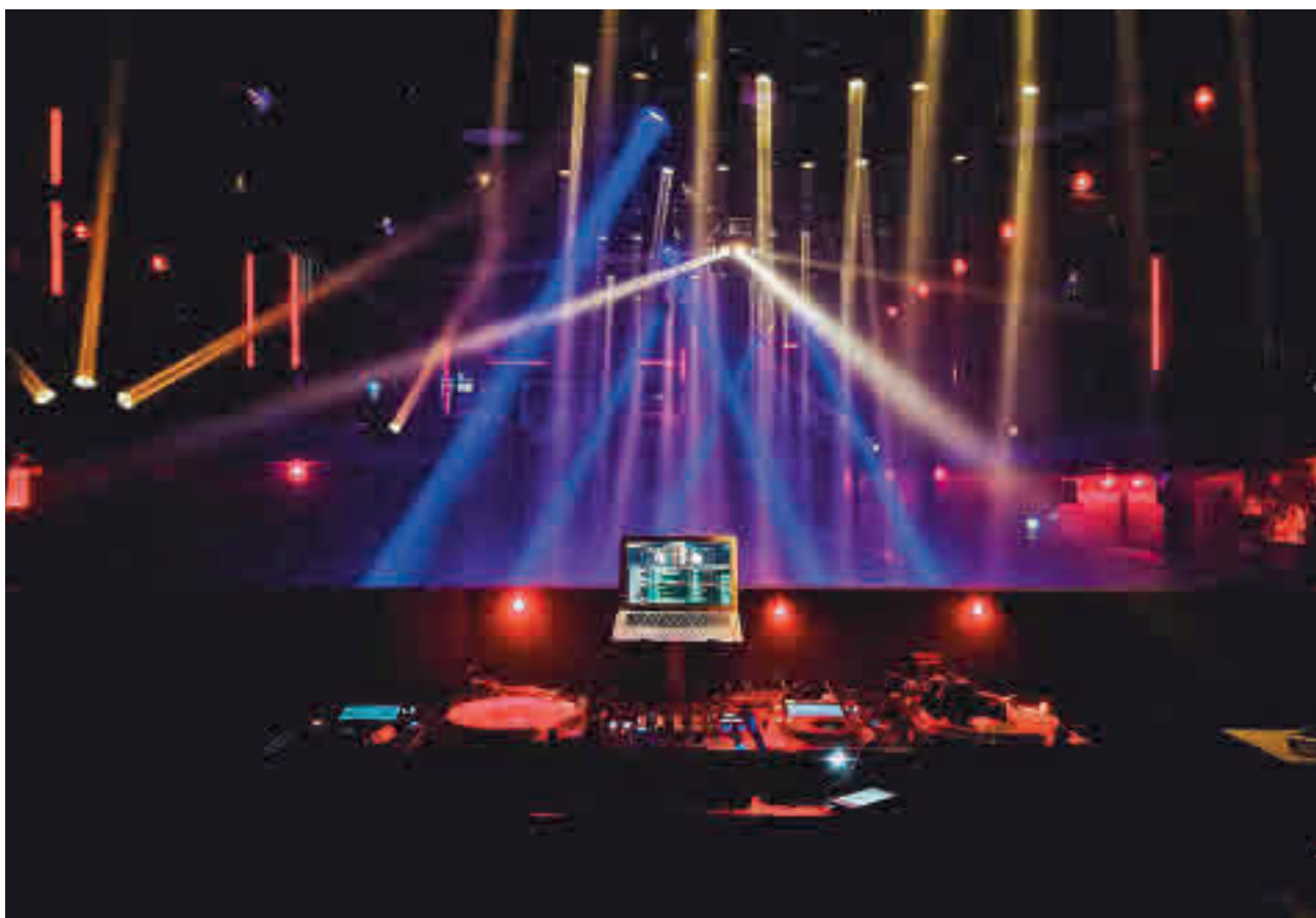
Los locales de ocio nocturno de la región ya tienen el visto bueno de la Comunidad