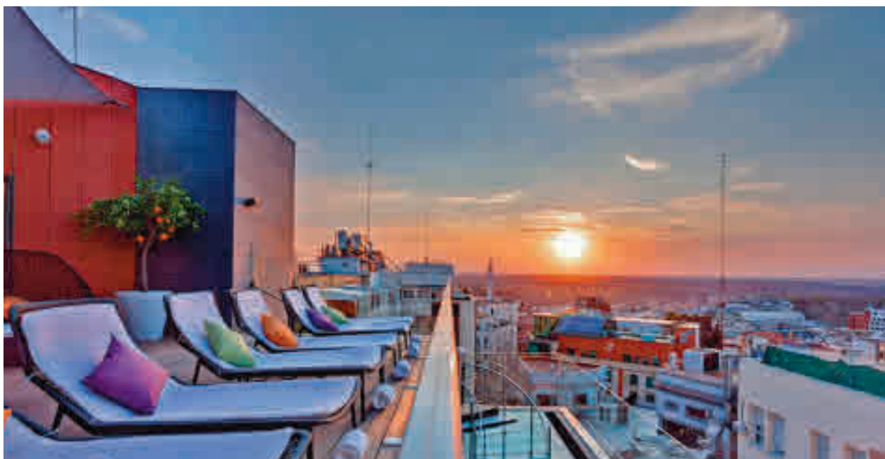
Los hoteles de la región, epicentro de esta iniciativa

» Centro de Arte de Alcobendas. Hasta el 30 de octubre.