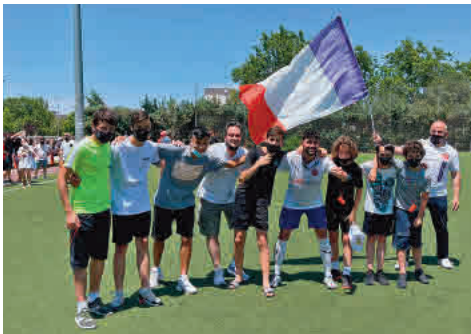
El Tres Cantos pudo celebrar con sus aficionados el ascenso en el José Caballero de Alcobendas

Dentro del Grupo 1, quien acompañará al Tres Cantos en el salto a Tercera es un Galapagar que nunca antes había llegado tan arriba. El po-