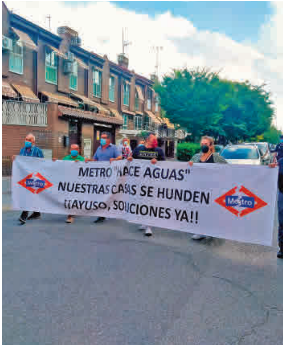
Un momento de la manifestación llevada a cabo el miércoles 16 AYTO DE SAN FERNANDO DE HENARES

"Hago un llamamiento a la ciudadanía para que se sume a esta marcha reivindicativa, porque queremos soluciones