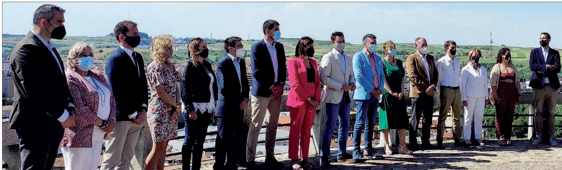
Foto de familia del equipo de Gobierno local tras las intervenciones del alcalde, vicecalde y portavoz municipal con motivo del balance ofrecido el martes 15 en el Mirador del Castillo coincidiendo con el ecuador del actual mandato.

DOS AÑOS DE GOBIERNO MUNICIPAL | En el ecuador de mandato, el alcalde reconoce que “aún nos queda mucho por hacer” y pide “un ejercicio de confianza”