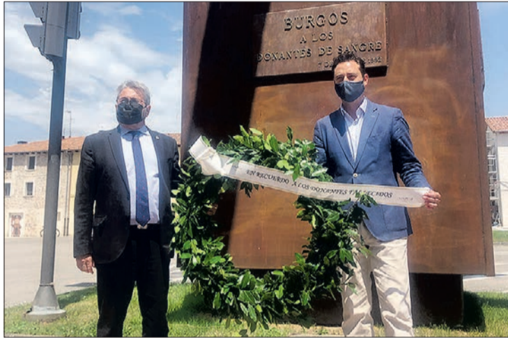
El acto de homenaje se produjo en la escultura dedicada a los donantes, el lunes 14.