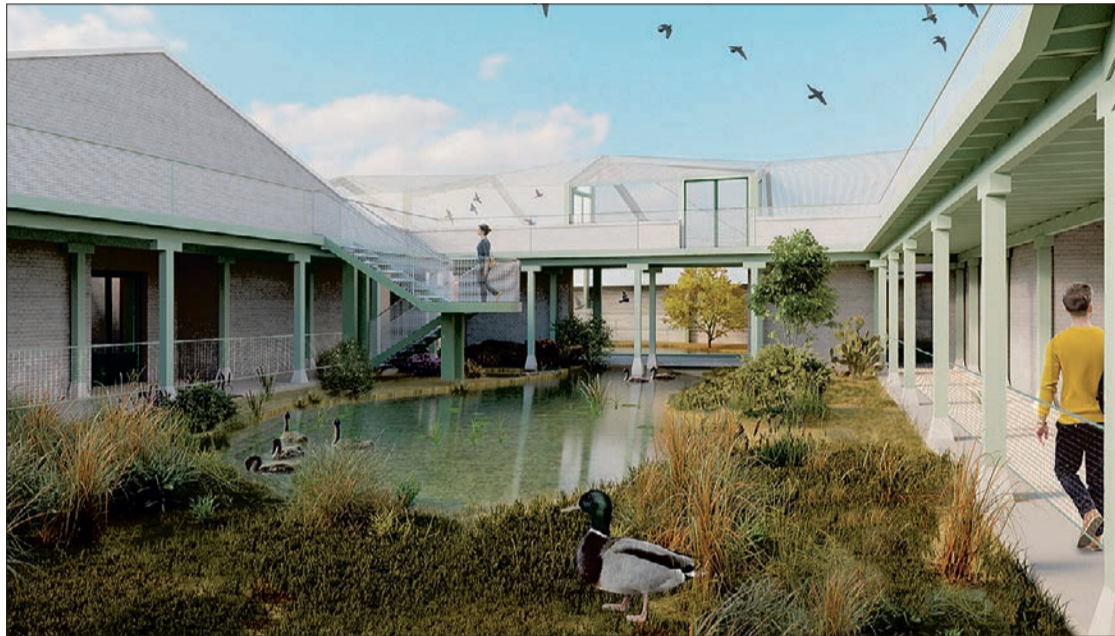
Imagen reconstrucción de cómo quedará uno de los espacios del nuevo centro. (Foto: Estudio AJO Taller de Arquitectura).

Este espacio, en el Castillo, abarcará contenido sobre fauna y flora, además de las aves