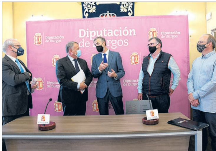
La firma de los dos acuerdos entre Diputación y UBU tuvo lugar el martes 15.