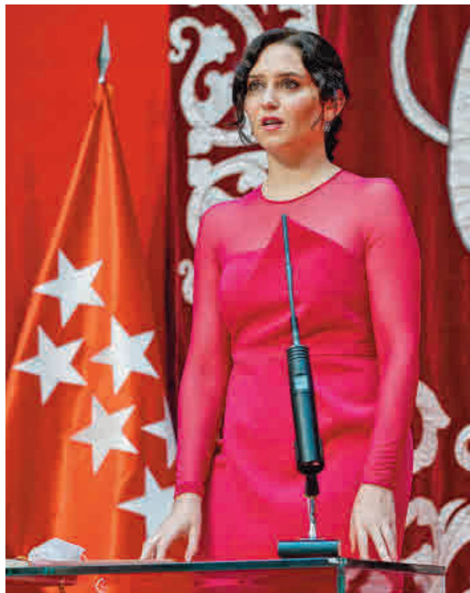
Ayuso toma posesión como presidenta de la Comunidad

LA RATIO SE BAJARÁ A 20 ALUMNOS POR AULA EN EL CURSO 2022-23