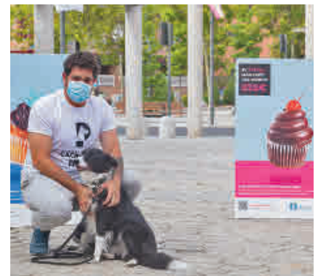
La patrulla CACA-NINA busca e identifica a los infractores

En este sentido, desde el Consistorio recuerdan a los propietarios de los canes la obligatoriedad de recoger los excrementos de la vía pública, así como de las sanciones de 525 euros, contempladas