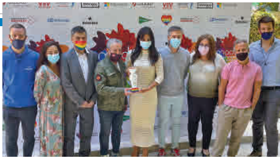
La vicealcaldesa, Begoña Villacís, asistió a la presentación de las actividades

En este contexto, todos los distritos de la capital confirman el descenso generalizado de las últimas semanas. Las tasas de prevalencia más bajas se sitúan en Usera (60,1) y Hortaleza (63,1).