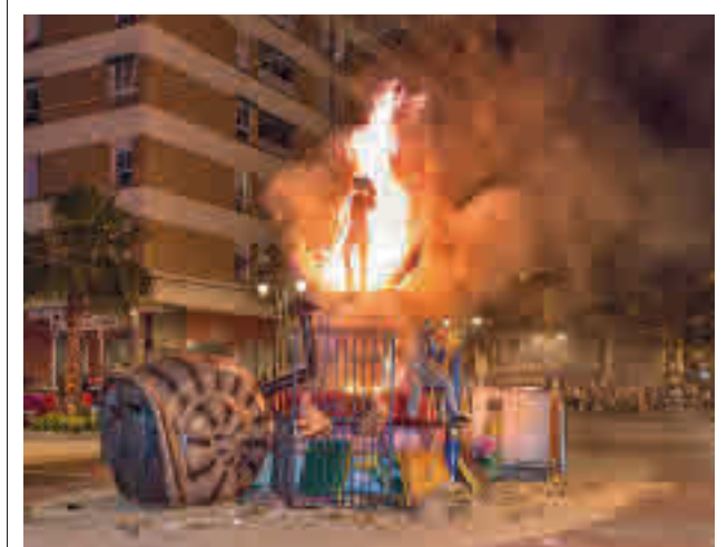
Imagen de archivo de las fiestas de Getafe

Getafe ya organizó en marzo el Campeonato de España de Campo a Través.