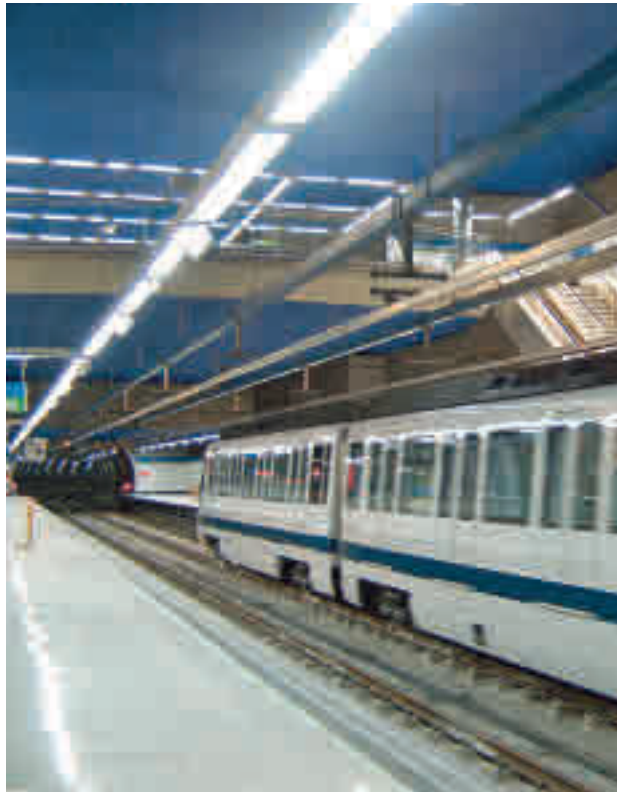
Estación de El Casar en Getafe

Más de un millón de usuarios procedentes de la zona Sur se beneficiarán de "una mayor intermodalidad y co-