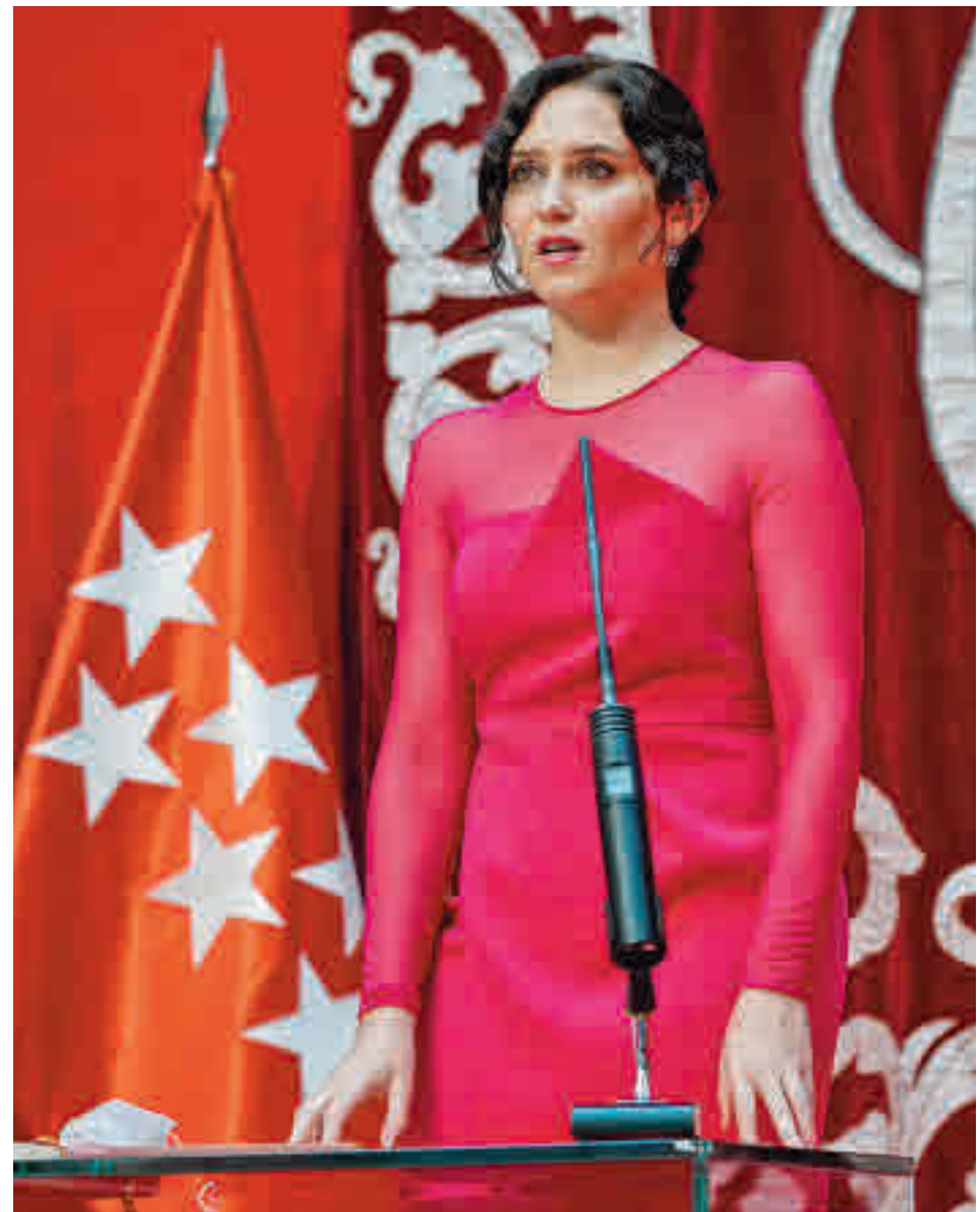
Ayuso toma posesión como presidenta de la Comunidad

La Comunidad construirá una planta de hidrógeno ver-