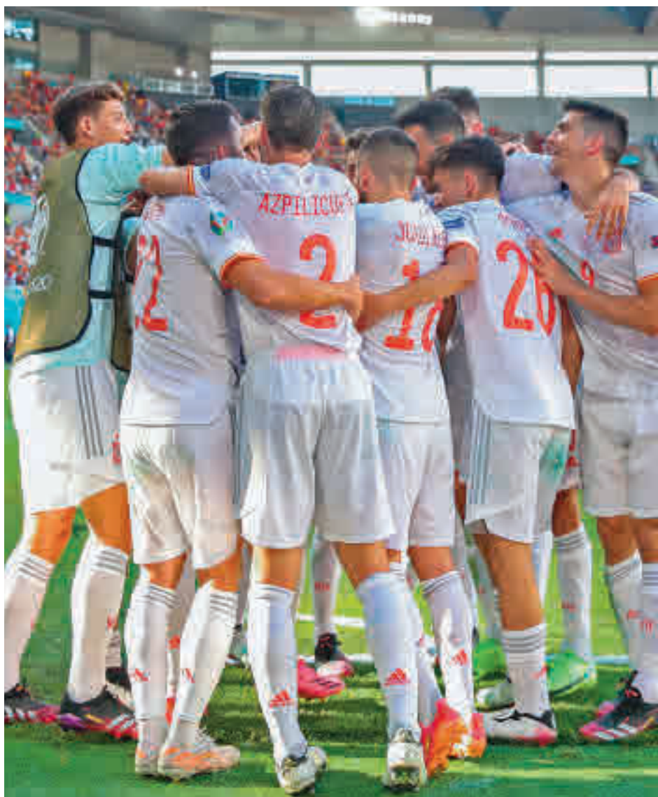
España se despidió de La Cartuja a lo grande SEFUTBOL

Quizás no haya sido el camino más convincente, pero cualquier aficionado habría firmado, días atrás, el decorado que ahora se le presenta a España en el partido de octavos de final de este lunes 28