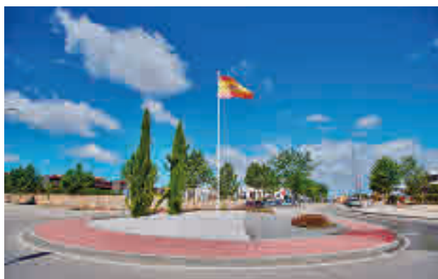
Zona en la que se construirá el complejo

zuela, situado entre las calles Boj y Jazmín, y que contará con una superficie total de 7.500 metros cuadrados. El proyecto ganador de la licitación ha sido el presentado por Supermercados Hiber S.A., que contempla una inversión de 4 millones de euros en la construcción de esta