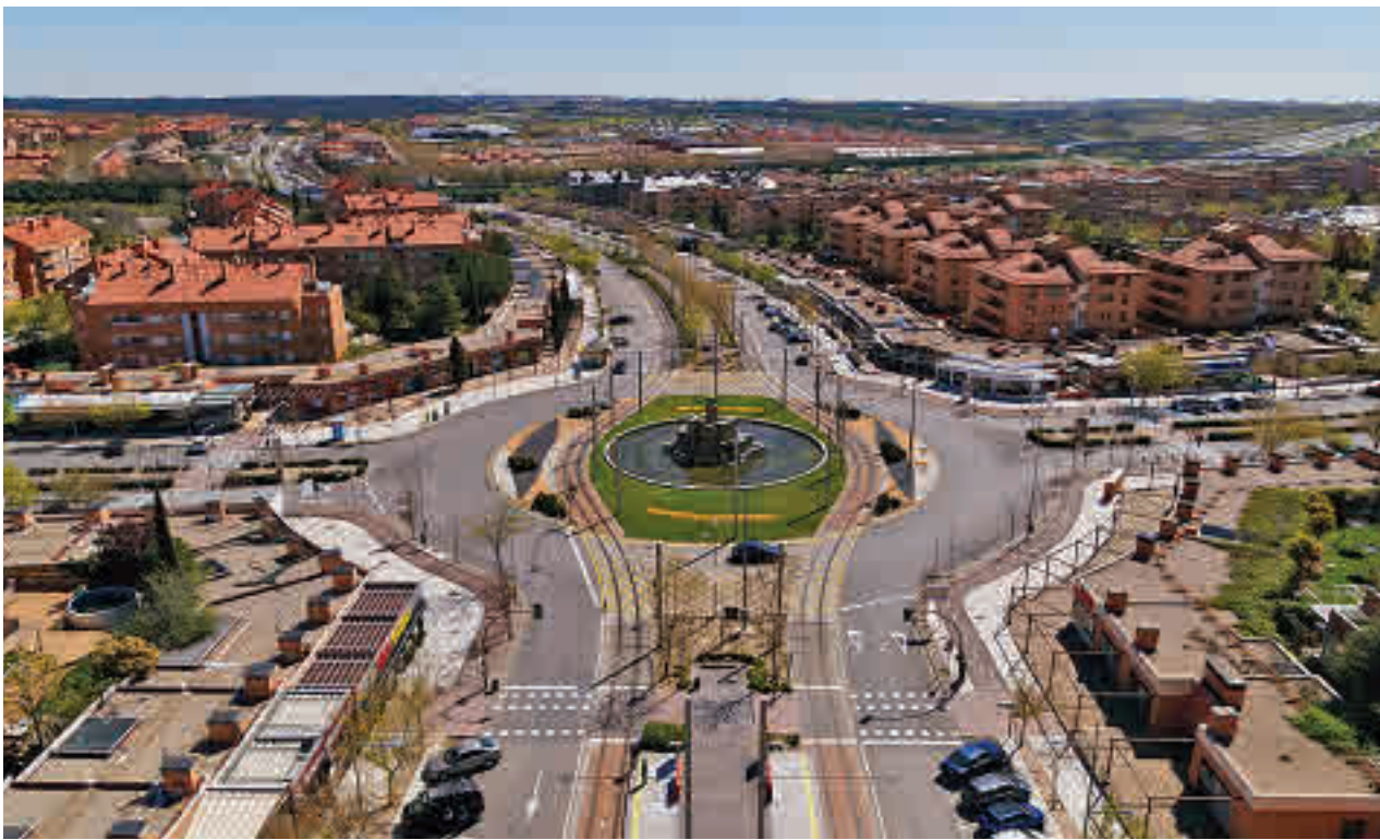
Boadilla podría contar con tren de Cercanías a medio plazo