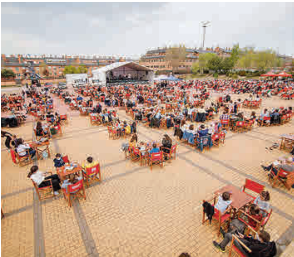
El recinto ferial roceño