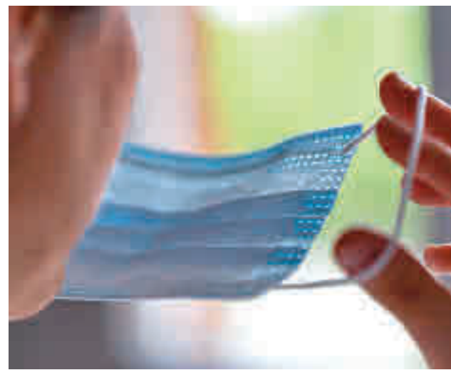
La mascarilla seguirá formando parte de nuestra vida