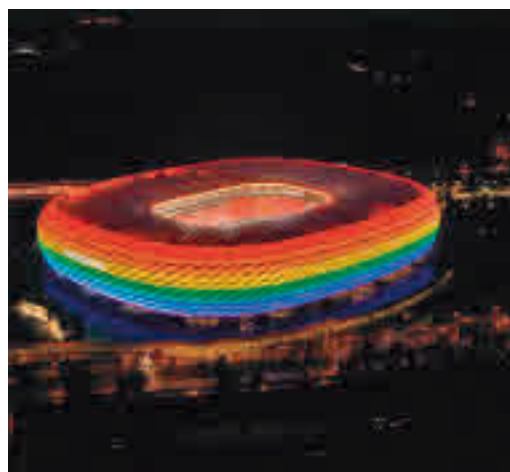
Imagen de archivo del Allianz Arena de Munich

EL PERIÓDICO GENTE NO SE RESPONSABILIZA NI SE IDENTIFICA CON LAS OPINIONES QUE SUS LECTORES Y COLABORADORES EXPONGAN EN SUS CARTAS Y ARTÍCULOS