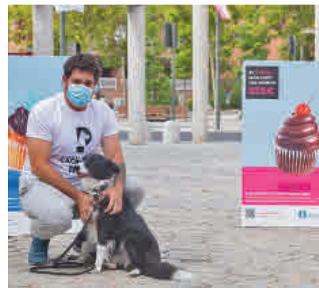
La patrulla CACA-NINA busca e identifica a los infractores

En este sentido, desde el Consistorio recuerdan a los propietarios de los canes la obligatoriedad de recoger los excrementos de la vía pública, así como de las sanciones de 525 euros, contempladas