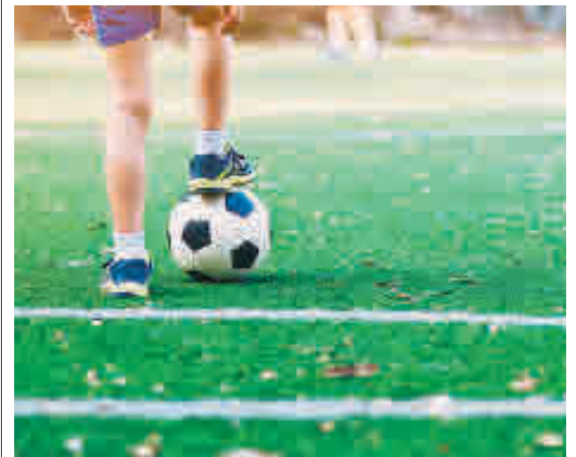
El fútbol volverá a ser una de las propuestas este año

gentedigital.es La actualidad de los municipios del Noroeste, en nuestra web.