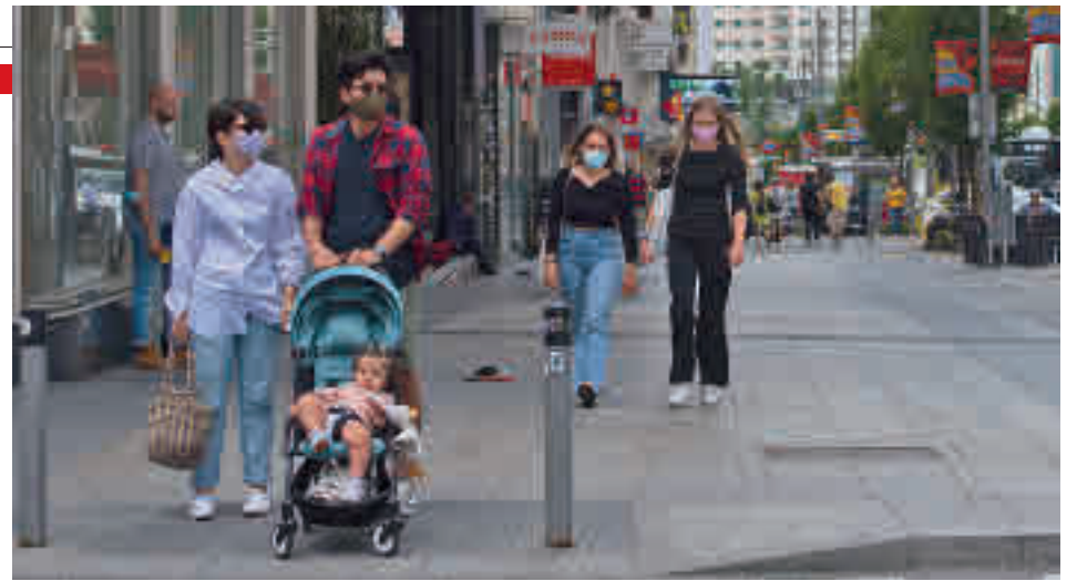
España se despidió de las mascarillas en exteriores

anuncia pensando solo en los titulares y en los efectos demoscópicos, que es como gestiona todo este Gobierno”. “Dudo que se haya hecho pensando en los porcentajes, en las distancias o en la vacunación”, concluyó.