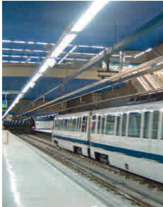
Estación de El Casar en Getafe

Más de un millón de usuarios procedentes de la zona Sur se beneficiarán de "una mayor intermodalidad y co-