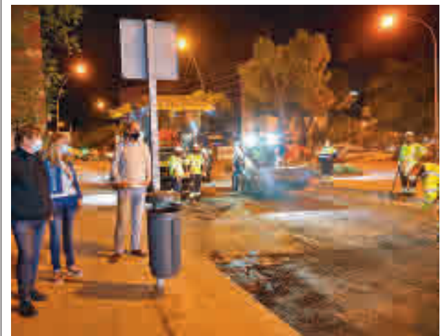
Obras en el Distrito Centro

El Ayuntamiento de Fuenlabrada está trabajando en la retirada de aquellos nidos de cotorra que tienen riesgo de caer sobre la vía pública.