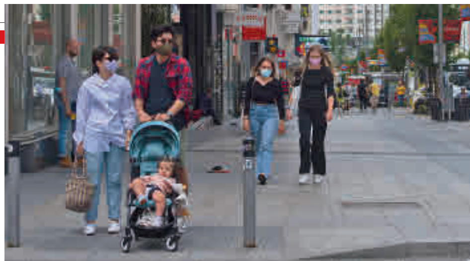
España se despidió de las mascarillas en exteriores

anuncia pensando solo en los titulares y en los efectos demoscópicos, que es como gestiona todo este Gobierno”. “Dudo que se haya hecho pensando en los porcentajes, en las distancias o en la vacunación”, concluyó.