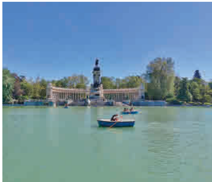
Una embarcación, en el estanque de El Retiro

Los usuarios de las embarcaciones de El Retiro y de la Casa de Campo pueden conseguir su entrada en la app 'Madrid Móvil' y en Madrid.es • El objetivo es reducir las esperas en la compra