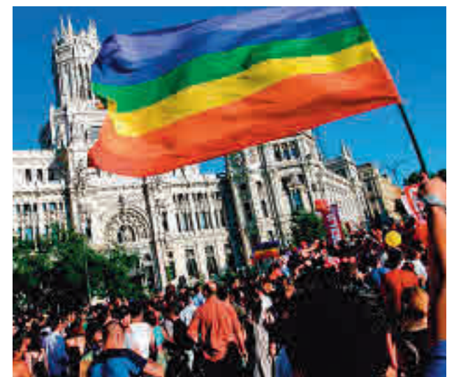
La marcha del Orgullo de ediciones anteriores

La manifestación del Orgullo LGTBI del próximo sábado 3 de julio en la capital tendrá un aforo limitado de 25.000 personas, tres horas de duración máxima, se dividirá en tres columnas con una distancia mínima de 1,5 metros y contará con un sistema de inscripción de las organizaciones participantes para facilitar el control. Delegación del Gobierno y las organizaciones convocantes, COGAM y FELGTB, mantuvieron el 29 de junio una reunión técnica sobre los detalles operativos de la marcha a la que asistieron el jefe Superior de Policía de Madrid, Jor-