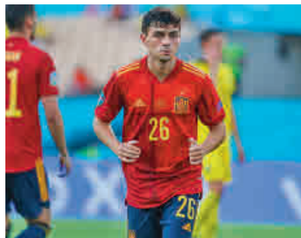
Pedri es uno de los jugadores que podría hacer 'doblete'

De cara a la cita de Japón, destaca la presencia de hasta seis jugadores que, actualmente, están compitiendo en la Eurocopa. Así, Unai Simón, Pau Torres, Eric García, Pedri, Dani Olmo y Mikel Oyarzabal podrían firmar un 'do-