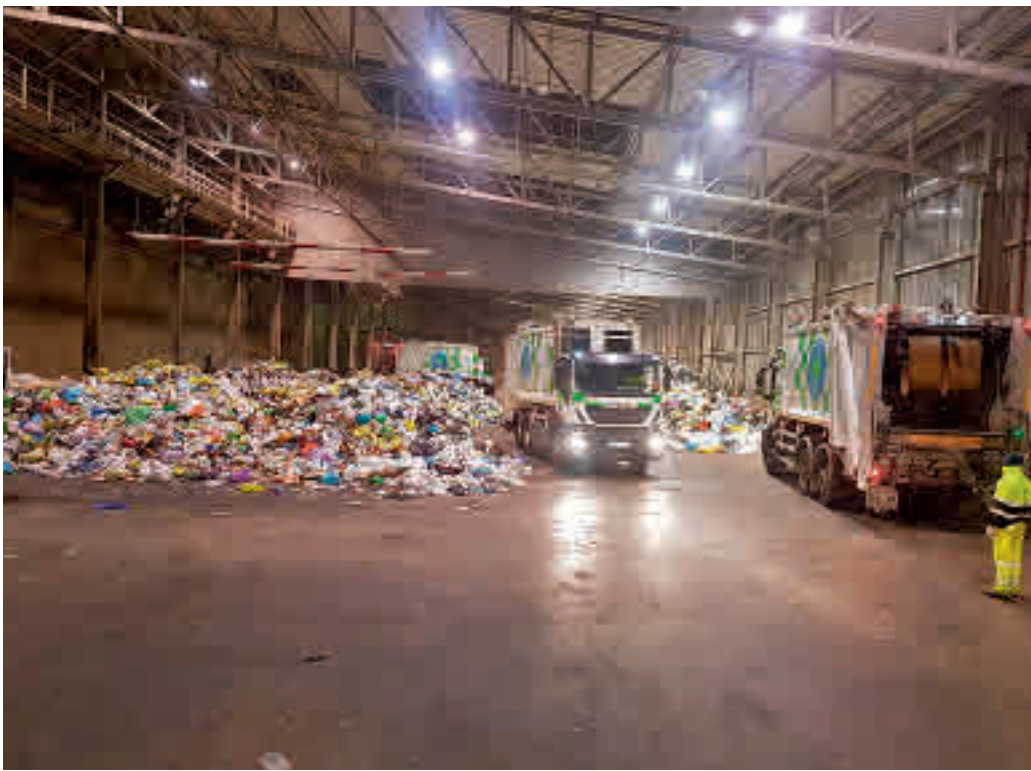
El Parque Tecnológico de Valdemingómez