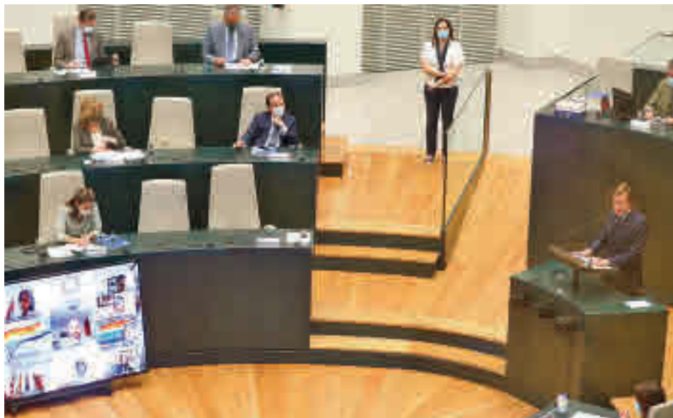
La intervención del alcalde en el Palacio de Cibeles

Las obras para la completa peatonalización de la Puerta del Sol y el desmontaje del scalextric de Puente de Vallecas arrancarán antes de fin de año y el Ayuntamiento instalará 23 cámaras de vigilancia en el polígono de Marconi en 2023 y se reforzarán las de la Puerta de Sol y Antón Martín. Estos fueron algunos de los importantes anuncios que realizó el alcalde de Madrid, José Luis Martínez-Almeida, en el Ple-