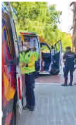
La acción sanitaria y policial

uno de ellos muy grave y con la detención de 11 personas, mayores de edad, pertenecientes a dos clanes de etnia gitana. Uno de los arrestados fue el supuesto autor material de la puñalada de gravedad, acusado de tentativa de homicidio. Además, los agentes incautaron varios cuchillos, uno de ellos jamonero, navajas, machetes, palos y hasta una muleta.