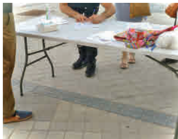
Un momento de la recogida de firmas AV COLONIA MARCONI

Toda la actualidad de los distritos de Madrid, en nuestra web