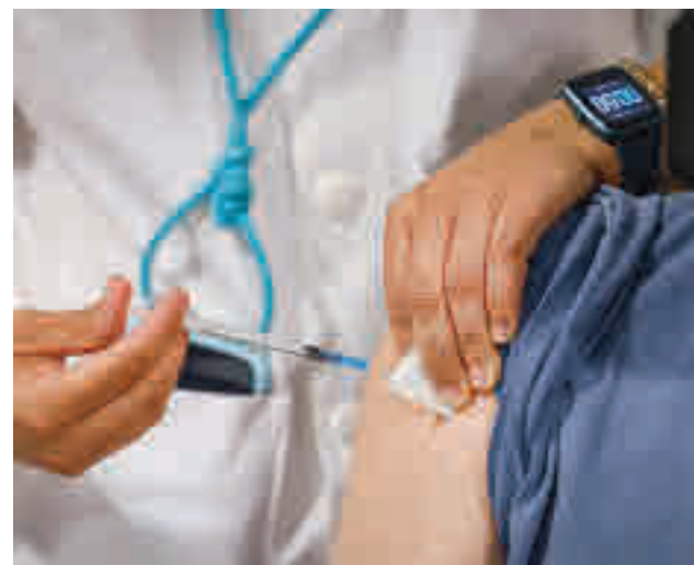
Vacunación en el Isabel Zendal