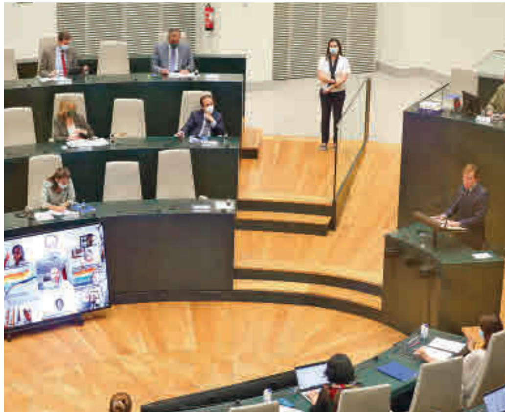
La intervención del alcalde en el Palacio de Cibeles

Además, en materia de movilidad, los madrileños podrán viajar de forma gratuita en los autobuses de la Empresa Municipal de Transportes (EMT) durante las dos primeras semanas de septiembre de 7 horas a 9 horas, se creará un nuevo billete en la EMT, el ‘transbús’, que permitirá los transbordos en los autobuses durante una hora por un precio de 1,80 euros frente al 1,50 que cuesta el título sencillo a partir del mismo mes, y un autobús lanza-