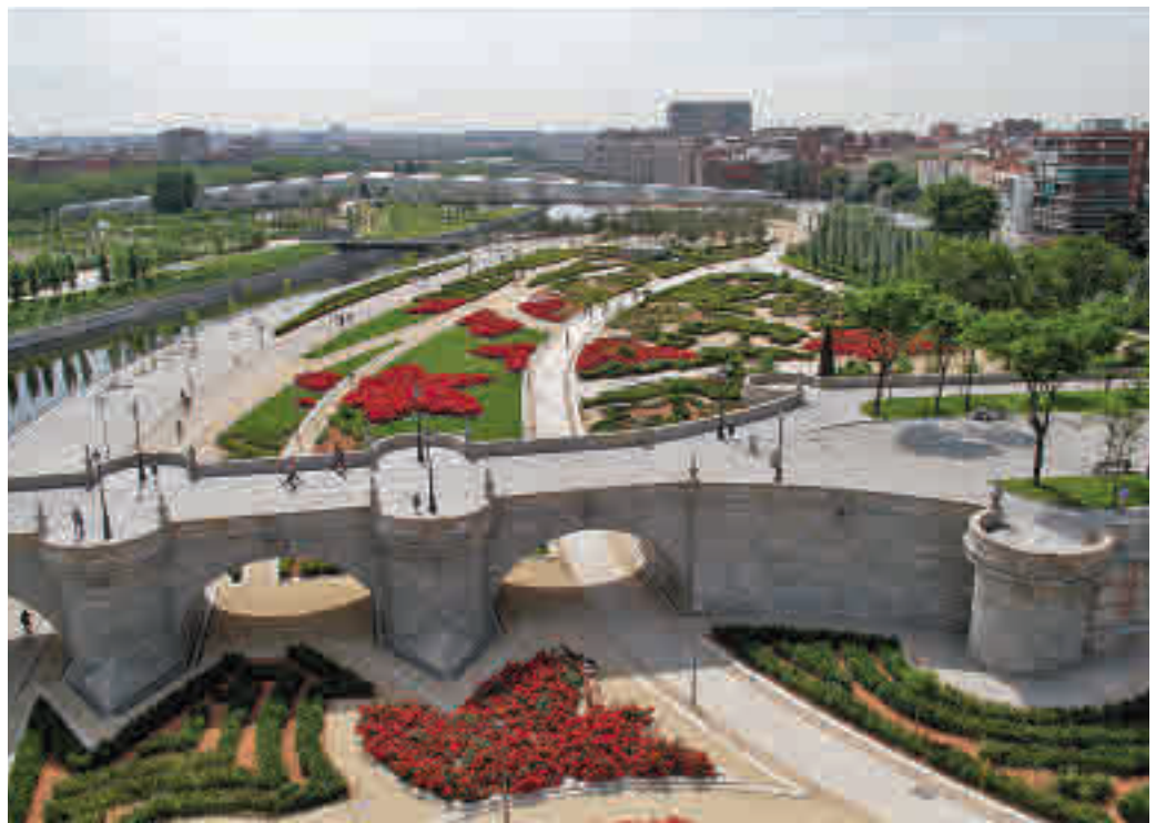
El Puente de Toledo une los distritos de Arganzuela y Carabanchel

Además, aludió a que con las obras de Madrid Río se levantaron hasta “15 pasarelas nuevas”, y de ellas 9 vieron la luz “aprovechando antiguas presas”. “Gracias al PP, esa conexión entre barrios se puede llevar a cabo”, dijo.