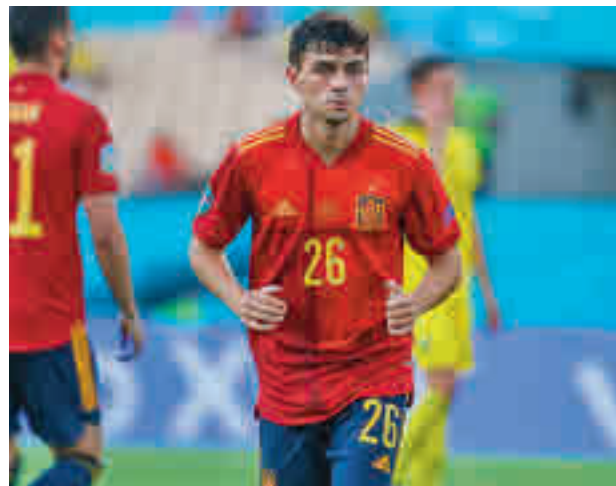
Pedri es uno de los jugadores que podría hacer 'doblete'

De cara a la cita de Japón, destaca la presencia de hasta seis jugadores que, actualmente, están compitiendo en la Eurocopa. Así, Unai Simón, Pau Torres, Eric García, Pedri, Dani Olmo y Mikel Oyarzabal podrían firmar un 'do-