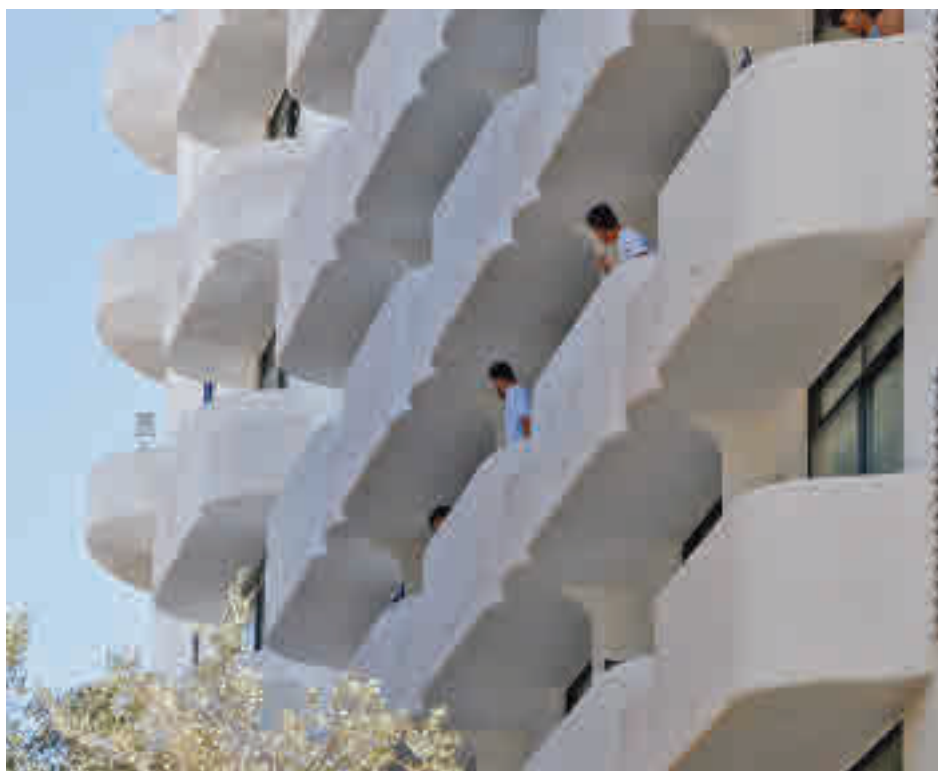
Jóvenes aislados en una hotel de Palma de Mallorca

La baja vacunación y la mayor interacción social entre los jóvenes son las principales causas de este fenómeno, razón por la que muchas comunidades ya están empezando a abrir la posibilidad de que los más jóvenes puedan pedir cita para vacunarse lo antes posible. Es el camino que han tomado Baleares o Cataluña y que podría tomar Madrid a partir de la semana que viene. Incluso algunas voces expertas hablan de considerarlos como un grupo prioritario a la hora de la inmunización, ya que una vez protegidos los mayores quizá sería más importante cortar la transmisión en aquellos que