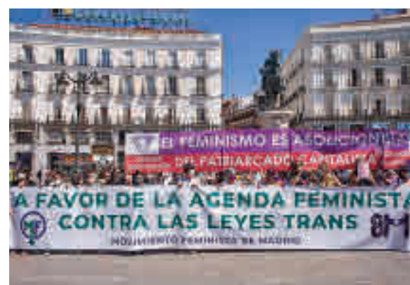
Manifestación feminista en Madrid

En ellas se entonaron cánticos contra el Gobierno y contra la ministra de Igualdad, Irene Montero, y se puso de manifiesto un punto de vista contrario al considerar que esta es "un retroceso en la pro-