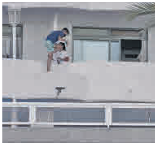
Imagen de jóvenes confinados en un hotel

EL PERIÓDICO GENTE NO SE RESPONSABILIZA NI SE IDENTIFICA CON LAS OPINIONES QUE SUS LECTORES Y COLABORADORES EXPONGAN EN SUS CARTAS Y ARTÍCULOS