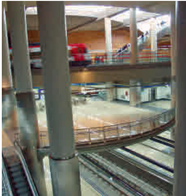
Estación de Getafe Central

Los viajeros pueden utilizar los servicios especiales de autobús desde Parla fletados por Cercanías Madrid, que ha habilitado diferentes líneas desde Parla Norte y Parla Este, dirección Parque Polvoranca, Villaverde Bajo y Pinto. También hay servicio