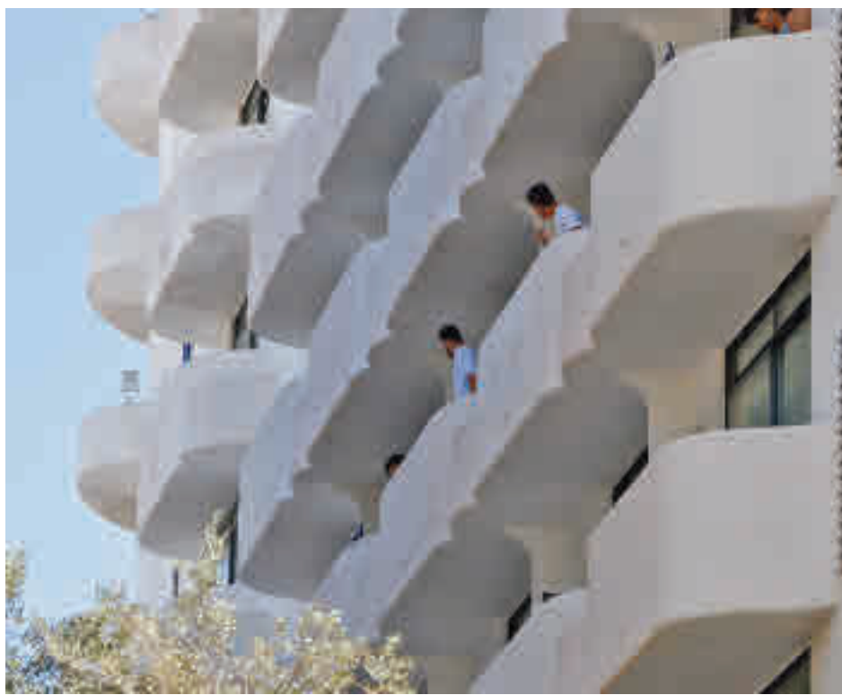
Jóvenes aislados en una hotel de Palma de Mallorca

La baja vacunación y la mayor interacción social entre los jóvenes son las principales causas de este fenómeno, razón por la que muchas comunidades ya están empezando a abrir la posibilidad de que los más jóvenes puedan pedir cita para vacunarse lo antes posible. Es el camino que han tomado Baleares o Cataluña y que podría tomar Madrid a partir de las semana que viene. Incluso algunas voces expertas hablan de considerarlos como un grupo prioritario a la hora de la inmunización, ya que una vez protegidos los mayores quizá sería más importante cortar la transmisión en aquellos que