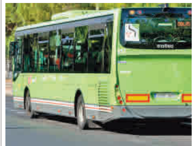
Autobús interurbano en Móstoles

El Centro Social Vicente Ferrer de Valdemoro recibirá en julio 11.000 kilos de alimentos para 260 familias en situación vulnerable.