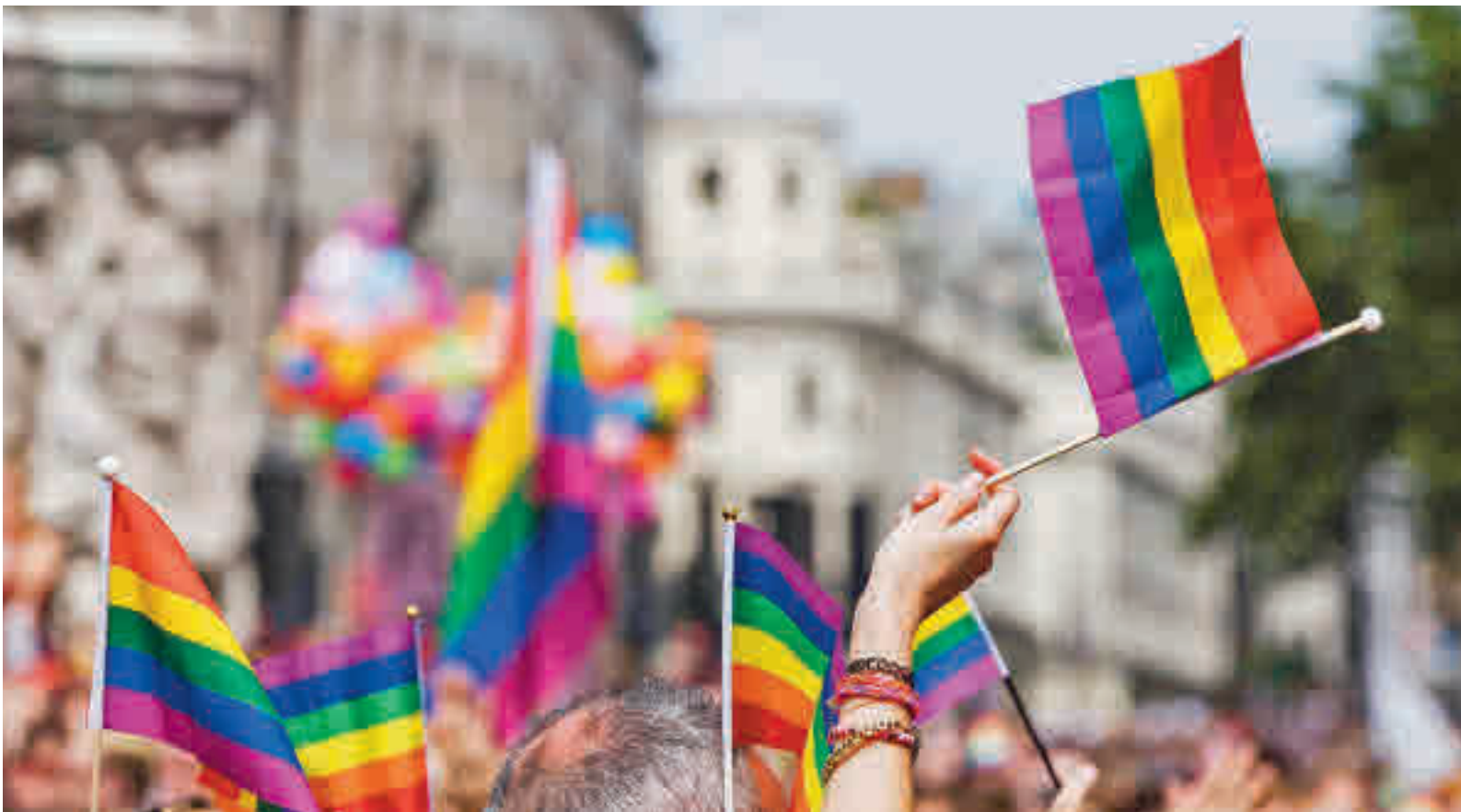
Concentración para visibilizar la libertad sexual