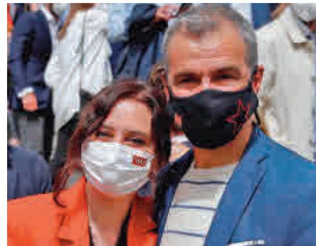
Isabel Díaz Ayuso y Toni Cantó, durante un acto electoral

Díaz Ayuso defendió este nombramiento señalando que en su programa electoral figuraba la defensa del castellano y su promoción como atractivo turístico para la región. Desde la oposición, sin embargo, han acusado a la presidenta de "crear un chiringuito para colocar" a Cantó, que tendrá un salario anual de 75.000 euros por cumplir con esta labor.