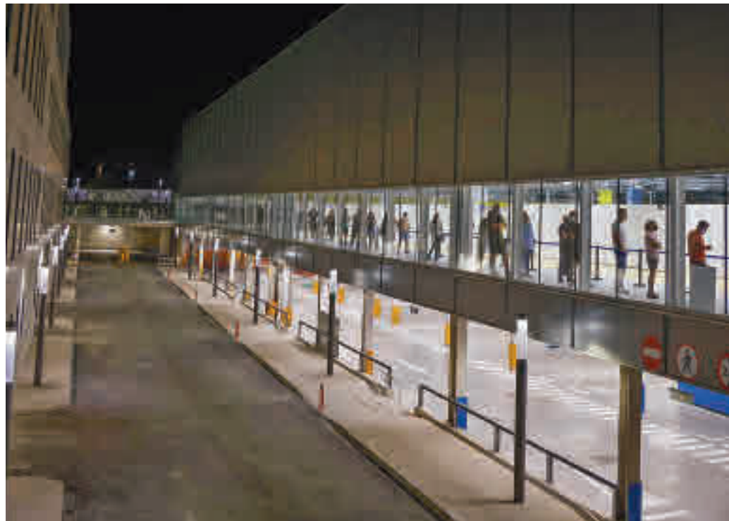
Gente esperando para vacunarse de madrugada en el Isabel Zendal

LA MEDIDA EMPEZÓ EL DOMINGO 27 DE JUNIO EN EL ISABEL ZENDAL