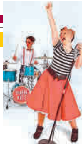
Dubbi Kids visita Getafe

Este grupo ofrece un espectáculo bautizado como