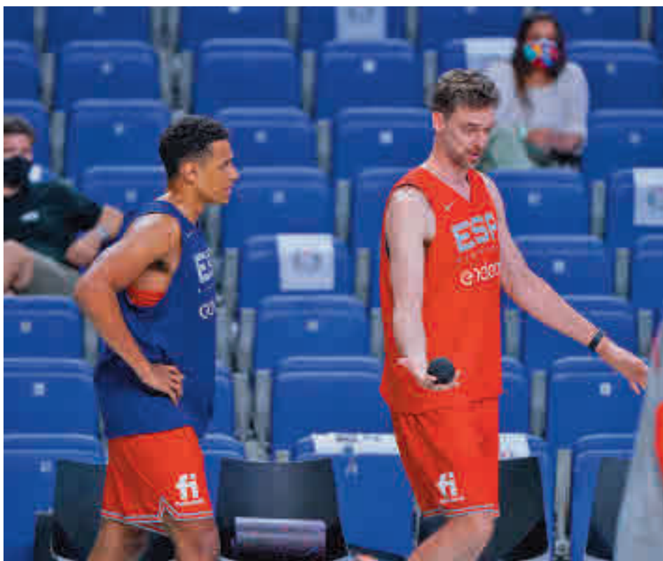
El regreso de Pau Gasol es una de la notas destacadas FEB