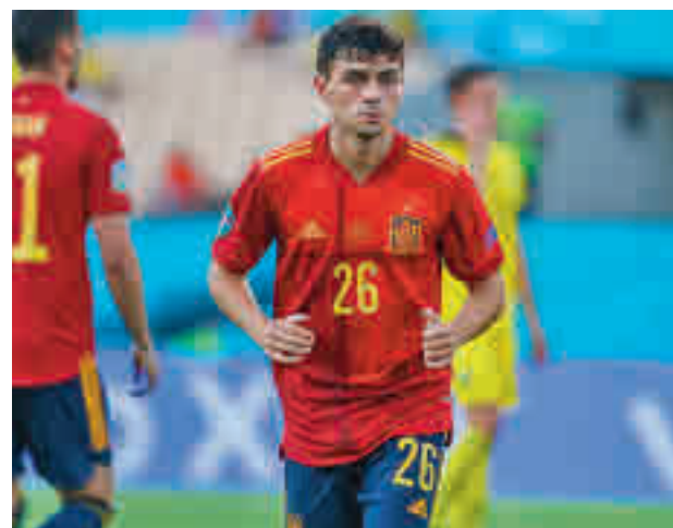
Pedri es uno de los jugadores que podría hacer 'doblete'

De cara a la cita de Japón, destaca la presencia de hasta seis jugadores que, actualmente, están compitiendo en la Eurocopa. Así, Unai Simón, Pau Torres, Eric García, Pedri, Dani Olmo y Mikel Oyarzabal podrían firmar un 'do-