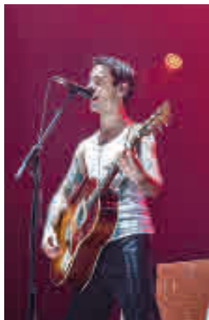
La M.O.D.A. actúa el día 3

Ahora, con la situación sanitaria mejorando, algunos de ellos van recuperando su actividad. Este es el caso del Festival Río Babel, que celebra, del 2 al 31 de julio, una edición especial bajo el nombre Las Noches de Río Babel. De este modo se darán cita en el Wanda Metropolitano artistas de renombre, arrancando este viernes 2 por Funam-