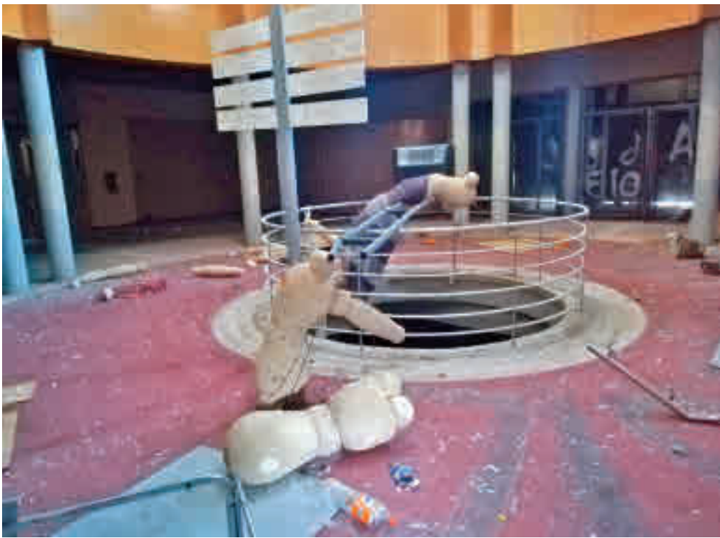
El interior del teatro ha sido el objetivo de diferentes actos vandálicos GRUPO SOCIALISTA AYTO