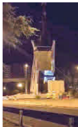
Los trabajos realizados

Esta actuación tiene como objetivo eliminar los cuatro trenzados del Nudo Norte para mejorar la movilidad que serán reemplazados por pasos a distinto nivel: tres son inferiores y uno superior.