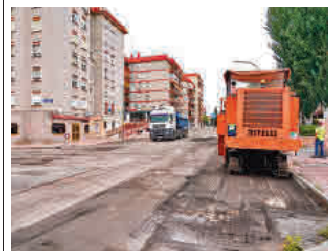
Máquinas actuando sobre el firme de Móstoles