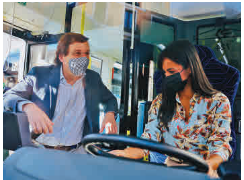
Begoña Villacís se subió a uno de los buses, ante la atenta mirada del Martínez-Almeida

El primer edil adelantó que a partir del 31 de diciembre de 2022, “no volverá a circular ni un solo autobús de gasóleo en la ciudad de Madrid” y el Ayuntamiento seguirá “haciendo ese esfuerzo presupuestario que va a permitir renovar la flota del transporte municipal y poner medidas en aquellos lugares