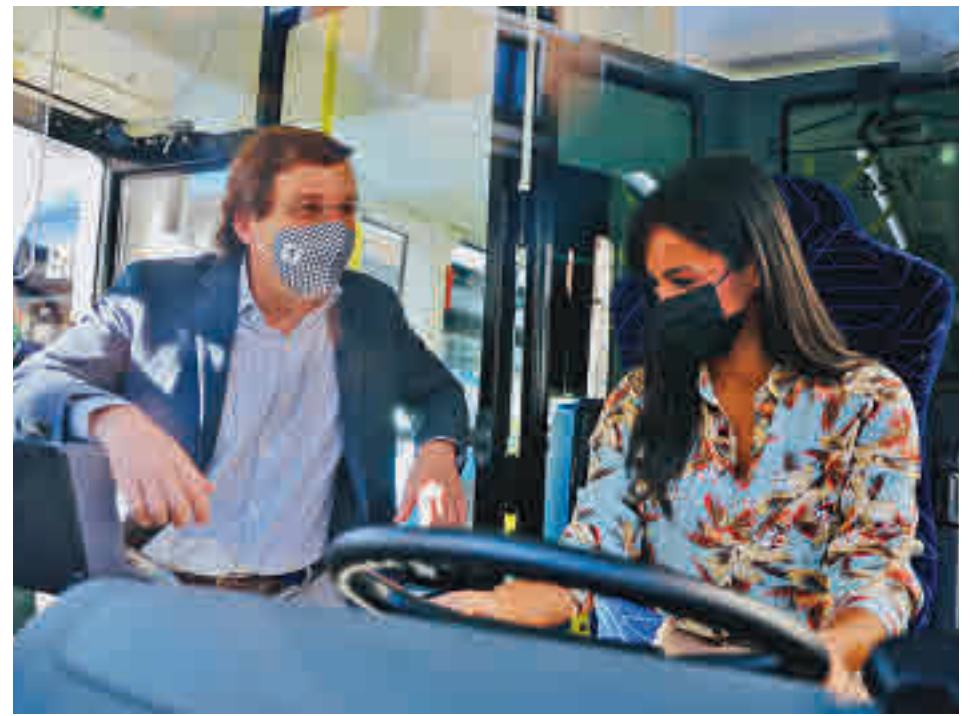
Begoña Villacís se subió a uno de los buses, ante la atenta mirada del Martínez-Almeida

El primer edil adelantó que a partir del 31 de diciembre de 2022, “no volverá a circular ni un solo autobús de gasóleo en la ciudad de Madrid” y el Ayuntamiento seguirá “haciendo ese esfuerzo presupuestario que va a permitir renovar la flota del transporte municipal y poner medidas en aquellos lugares