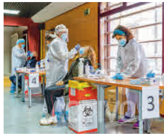
Los contagios crecen moderadamente en el Sur