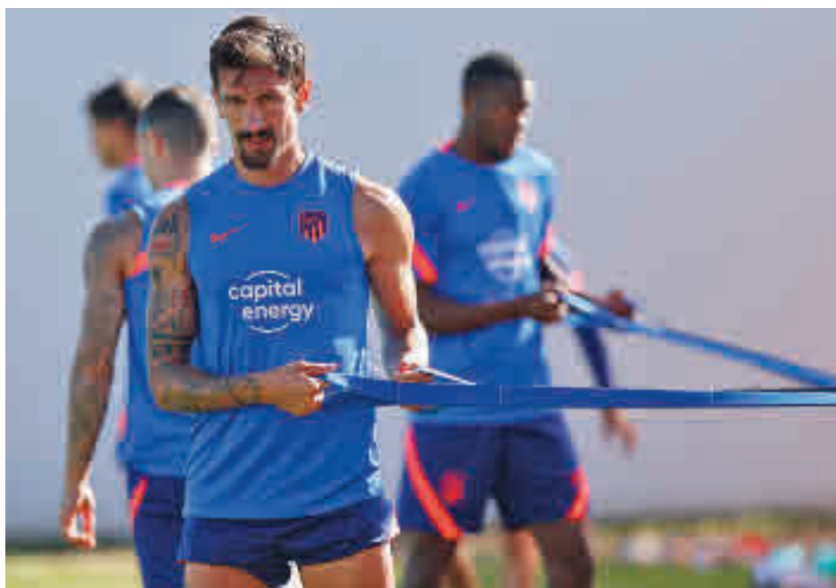
Valdebebas y Majadahonda acogieron los primeros entrenos de Real Madrid y Atlético

jugará su primer amistoso en Escocia ante Rangers de Steven Gerrard.