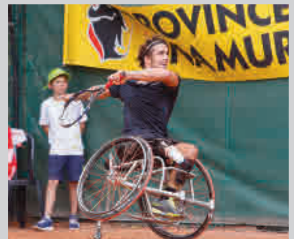
El jugador madrileño es uno de los favoritos