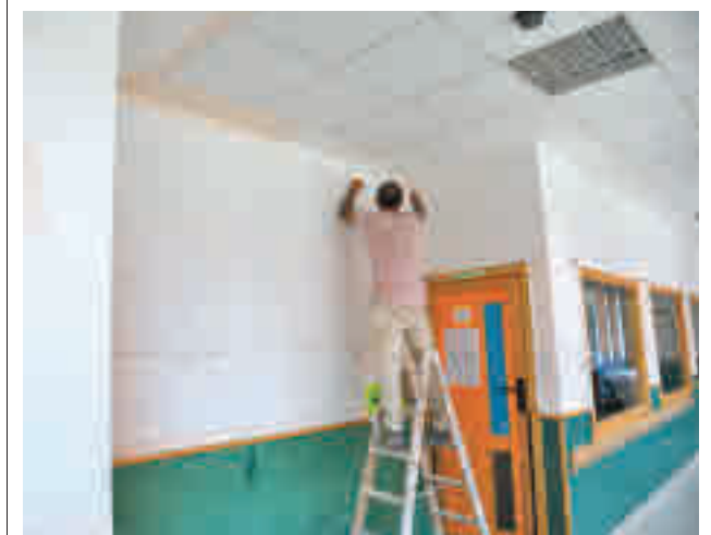
Un operario cambiando las luminarias

Se podrán beneficiar los colectivos de afectados por esclerosis múltiple, enfermedad mental, Alzheimer, discapacidad física, discapacidad intelectual y discapacidad sensorial. Se tendrán en cuenta para su concesión las actividades socioeducativas y formativas a través de cursos, talleres, jornadas y charlas destinadas a la prevención y eliminación de situaciones de riesgo de exclusión social y marginación de menores.