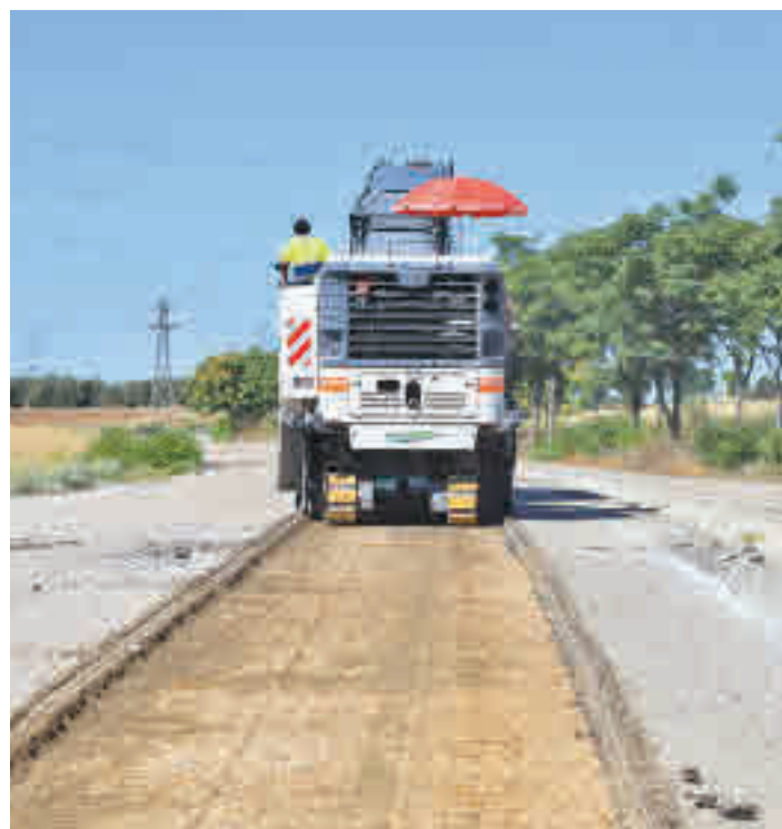
Labores de reparación en la carretera

Además, se habilitará un carril de zorra para garantizar los usos compatibles, como paso de ganado, tránsito