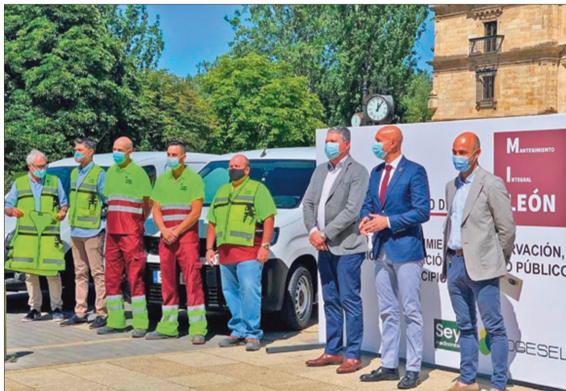
La presentación del nuevo servicio de conservación y mantenimiento del viario público tuvo lugar en la plaza de San Marcos.

Entra las primeras acciones de este Servicio, Díez detalló el asfal-