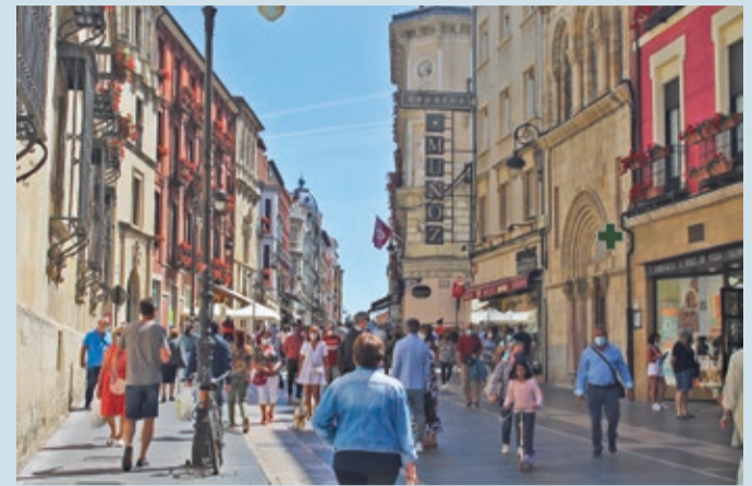
La calle Ancha registra la misma actividad que antes de la pandemia.

COVID-19 | RECONOCE EL PREOCUPANTE AUMENTO DE LOS CONTAGIOS