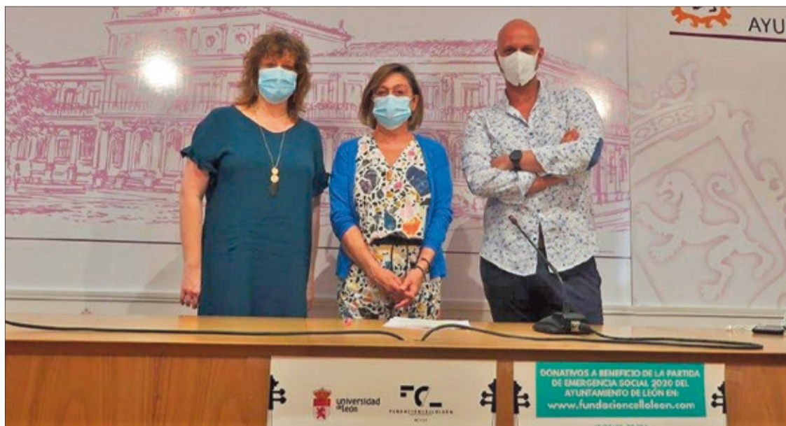
La concejala de Acción y Promoción Cultural, el director del Festival y la vicerrectora de Relaciones Institucionales, en una imagen de archivo.