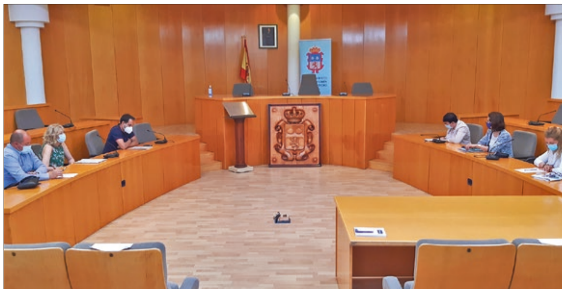
La reunión entre Ayuntamiento y Asociación de Comerciantes y Autónomos de San Andrés se desarrolló en el salón de plenos.