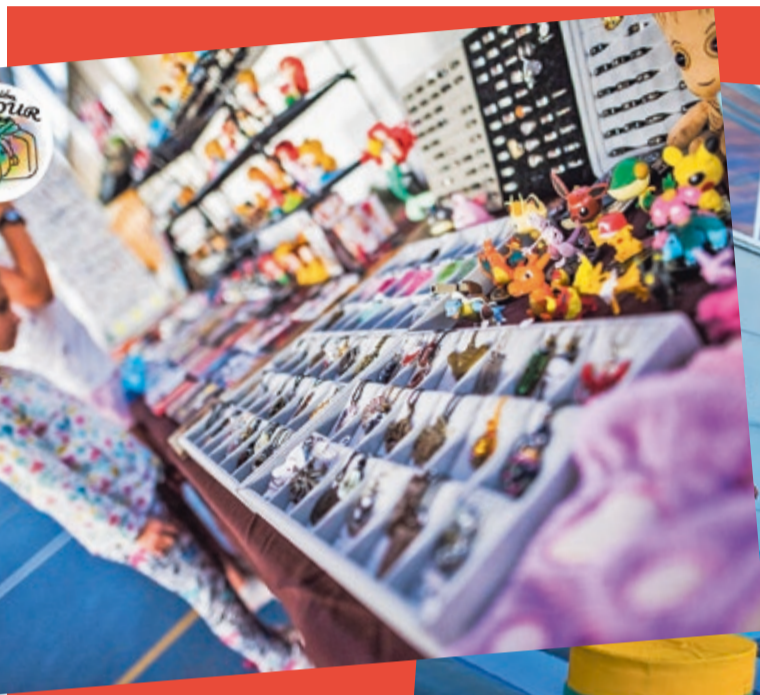
Niños y jóvenes serán los protagonistas de la nueva edición de #findexoven que se celebrará en septiembre

Como ya hiciera en las ediciones de 2018 y 2019, teniendo que cancelar la de 2020 por el COVID-19, la Concejalía de Juventud, apoyada por las asociaciones juveniles del municipio y el Consejo de la Juventud de Villaquilambre, desarrollarán diferentes actividades como juegos de mesa, torneos de videojuegos, League of Legends, Fortnite, Fifa, SuperMario, pantallas para el juego libre, simuladores de conducción, concursos de baile, cosplay, talleres, hinchables infantiles, de adulto, toro mecánico, barredora... Además, se contará con la participación de stands de información y venta de productos relacionados con el anime, manga y cultura japonesa entre otras sorpresas.