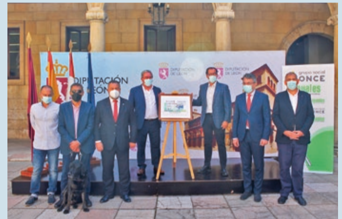
La presentación del cupón de la ONCE tuvo lugar en el Palacio de los Guzmanes.

LOTERÍAS | HOMENAJE A LA LUCHA LEONESA QUE REPARTIRÁ SUERTE