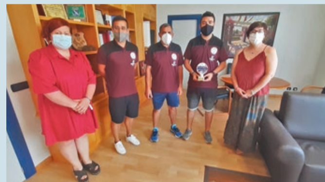
Recepción al equipo de fútbol sala Trepalio en el Ayuntamiento de San Andrés.

FÚTBOL SALA | LOS JUVENILES JUGARÁN EN LA MÁXIMA CATEGORÍA