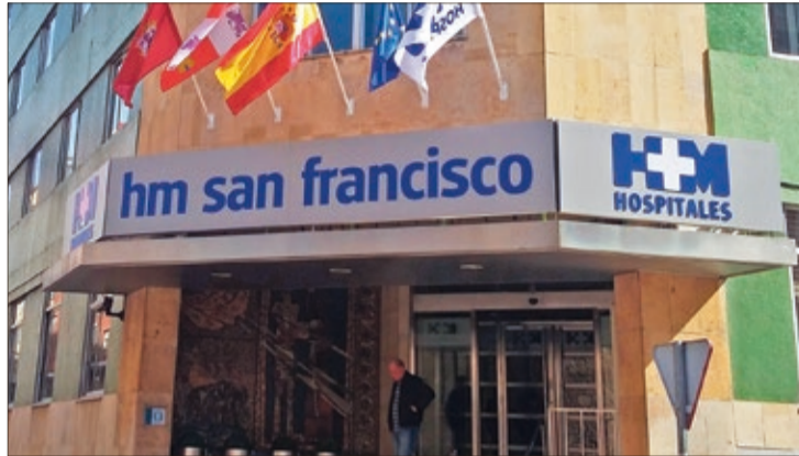
Fachada principal del hospital HM San Francisco de la capital leonesa.

Una vez finalizadas las obras, Urgencias contará con 2 consultas y 5 boxes totalmente equipados para dar respuesta a todo tipo de necesidades médicas, lo