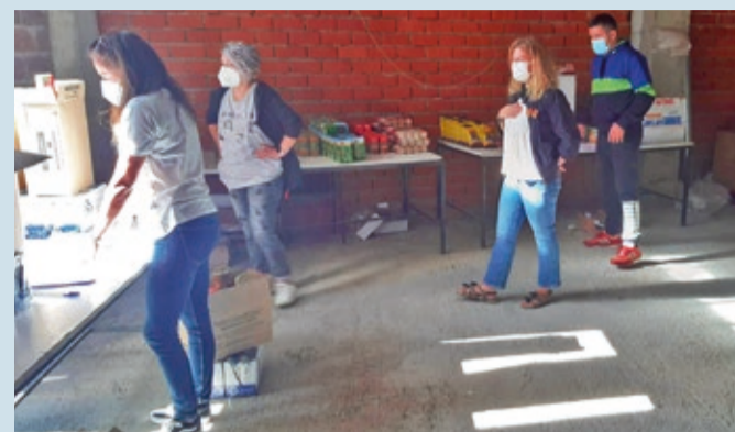
Trabajadores sociales y voluntarios son los encargados del reparto de alimentos.

ATENCIÓN SOCIAL | SE DISTRIBUIRÁN UN TOTAL DE 8.569 KILOS DE ALIMENTOS