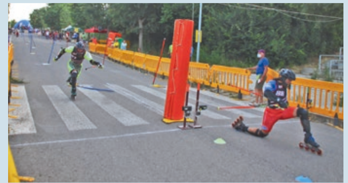
Entrada de la final de patinaje de Alpino en Línea, especialidad slalom paralelo.

FRESNO DEL CAMINO | PRÓXIMA CITA, LA COPA DEL MUNDO EN ESLOVAQUIA