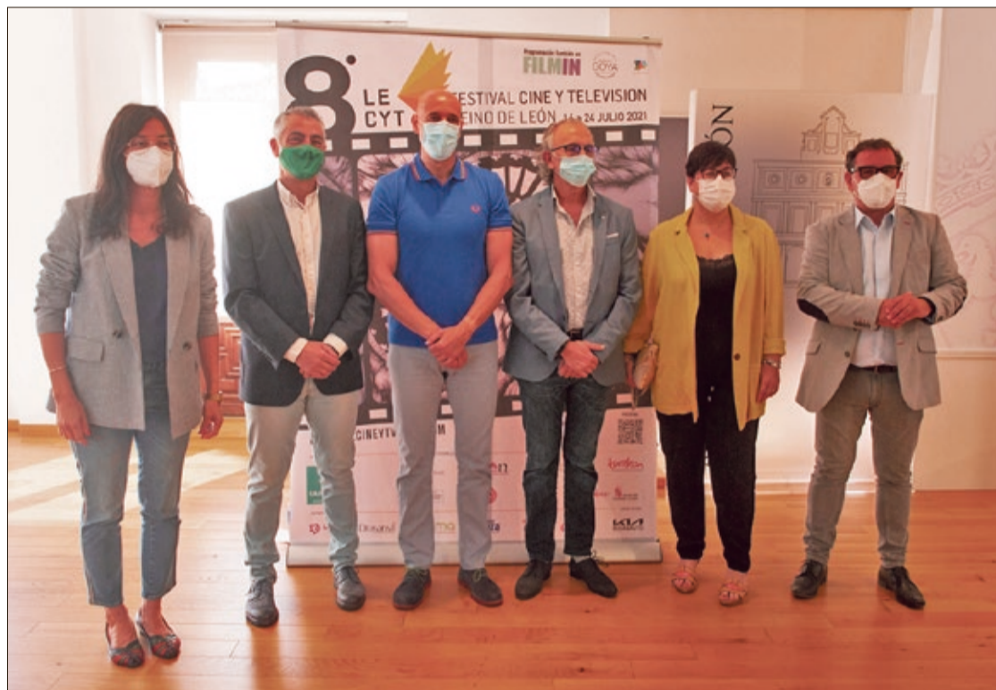
Presentación de la octava edición del Festival de Cine y Televisión Reino de León, en el Salón de los Reyes del Consistorio de San Marcelo.

León será sede de diferentes talleres y conferencias y se contará con la habitual sección de cine leonés con cuatro películas y un coloquio con tres de los directores de estas películas. También, se repetirá la retransmisión de las películas a través de Filmin en su plataforma para acercar a todos los espectadores de España el visionado de las películas que forman parte del Festival. La proyección de las 135 cintas seleccionadas será en el Auditorio Ciudad de León, Palacio del Conde Luna, Instituto Confucio de la ULE, patio del Instituto Juan del Enzina, Teatro Nuevo Recreo Industrial, patio del Colegio Teodoro