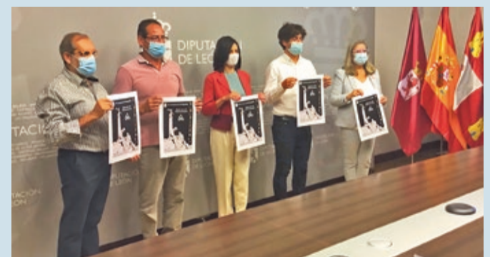
La presentación del concurso tuvo lugar en el Palacio de los Guzmanes.

CULTURA | POR LAS ASOCIACIONES 'PRIORATO DE ESCALADA' Y 'DIAFRAGMA LEÓN'