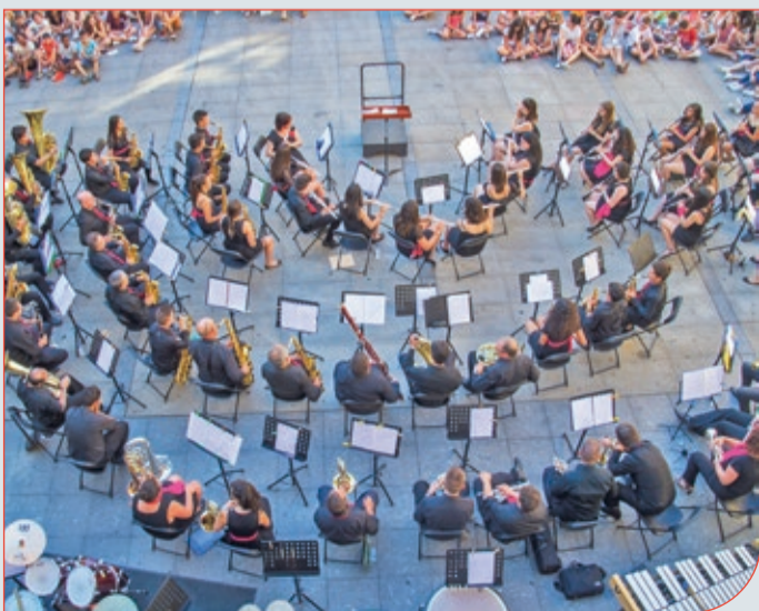
La banda de música ofrecerá su primer concierto de verano en la plaza de la Chana de Estébanez de la Calzada, será a las 20:30 horas.