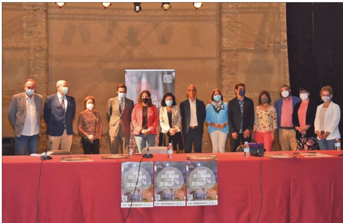
La presentación oficial del 20º Concurso Internacional de Coreografía tuvo lugar en Sahagún el martes 13 de julio.

Estas tres obras, seleccionadas por un comité artístico entre las propuestas recibidas por la organización, se exhibirán, respectiva-