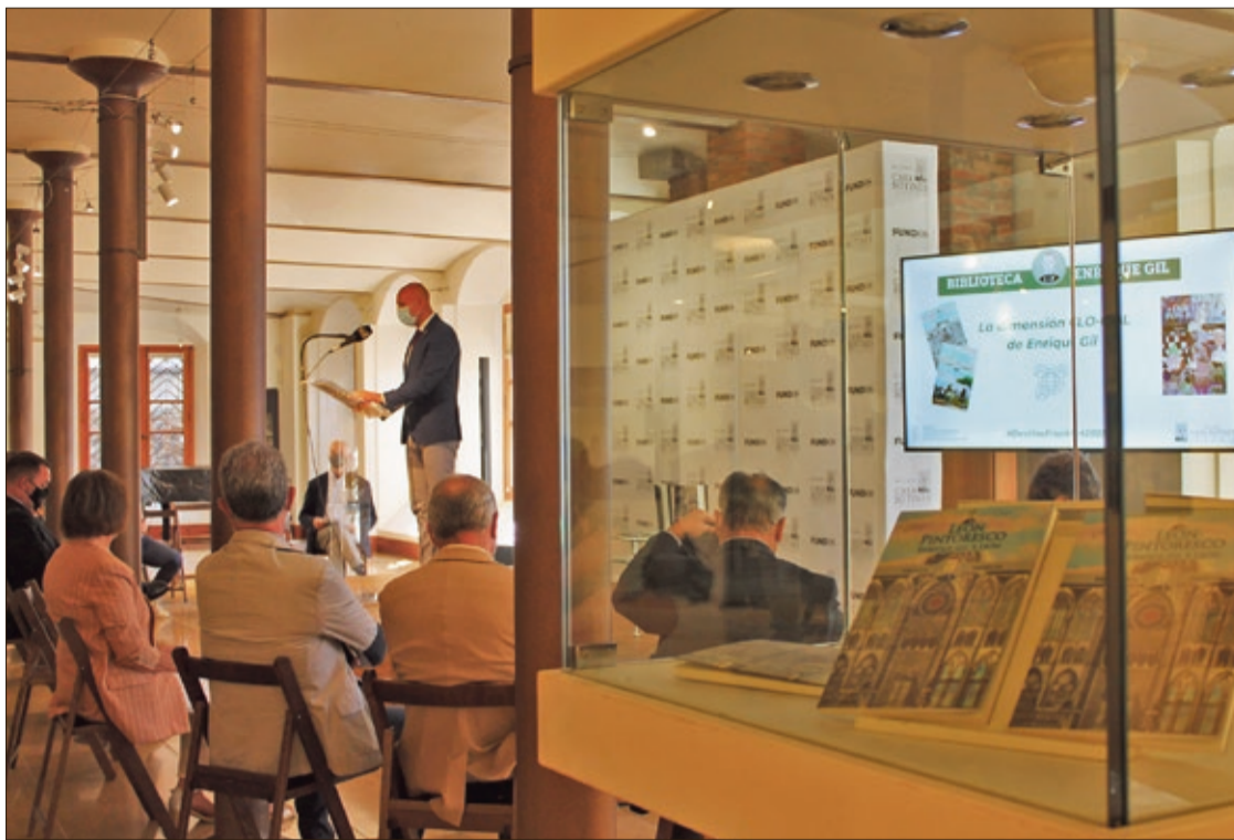
Intervención del alcalde de León en la presentación del proyecto 'Dimensión global-local de Enrique Gil' en el Museo Casa Botines.