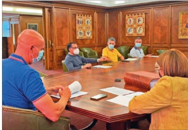
Junta de Gobierno Local del Ayuntamiento de León del viernes 9 de julio.

Asimismo, se adjudicó el servicio de desinfección de las áreas de juegos infantiles, deportivos y biosaludables a 'Arasol Gestión y Servicios' por un importe total de 90.702 euros, labores que se realizan en cumplimiento de la normativa anticontagios y que es preceptiva para la apertura de las