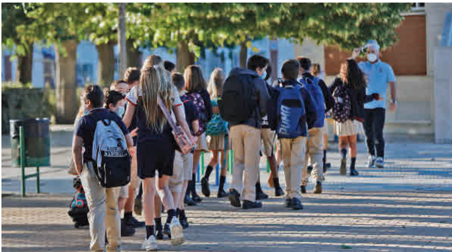
La vuelta al cole será más cara en este curso escolar