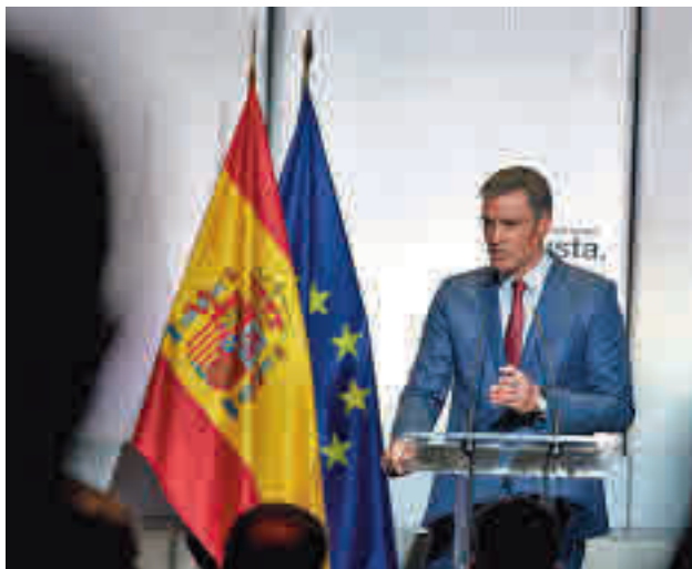
Pedro Sánchez anunció la medida

El Ministerio de Trabajo y los representantes de CC.OO., UGT, CEOE y Cepyme se volverán a reunir el próximo lunes 6 de septiembre para seguir negociando sobre la subida del Salario Mínimo Interprofesional, que actualmente se encuentra en los 950 euros al año.