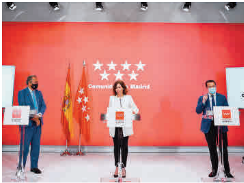
Isabel Díaz Ayuso, tras el Consejo de Gobierno

Por su parte, el impuesto sobre depósito de residuos, destinado a la protección del