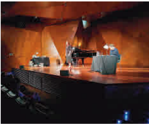
Una actuación en el auditorio municipal