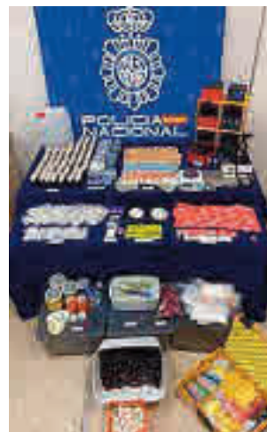
El material incautado

que abastecía a las zonas de ocio de Chueca y Malasaña. Según fuentes policiales, en el operativo fue detenido un individuo que preparaba y distribuía la droga desde su vivienda. En el registro del domicilio, los policías aprehen-