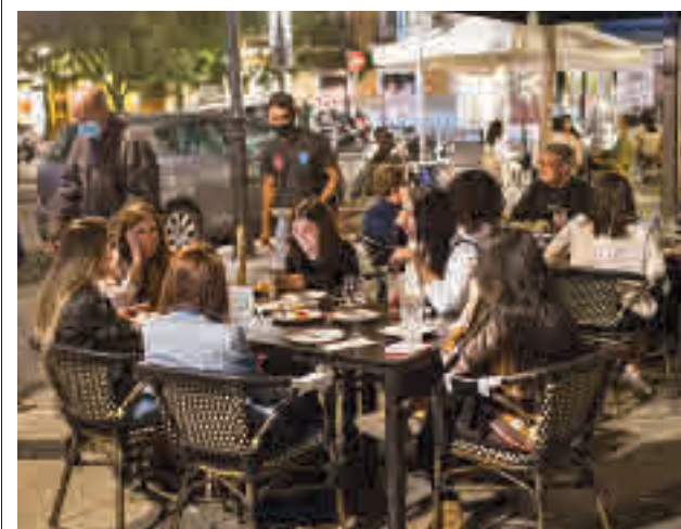
Locales de ocio de Alcorcón

Las fuertes lluvias que cayeron este miércoles 1 en la Comunidad provocaron fuertes retrasos en la C3, que une Madrid con Valdemoro.