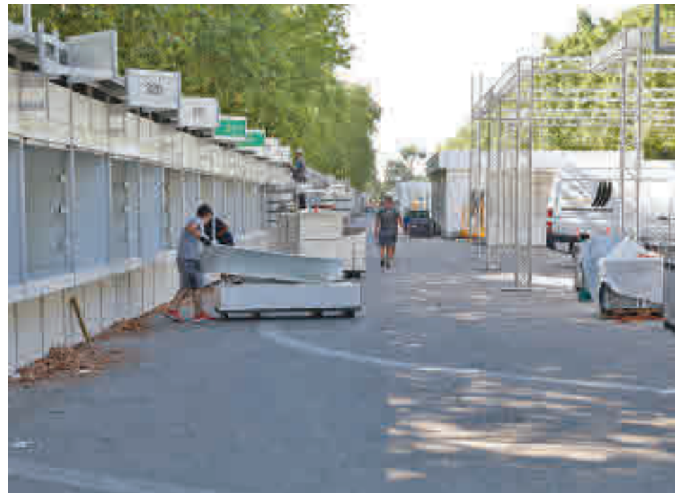
Los participantes ultiman el montaje de sus espacios