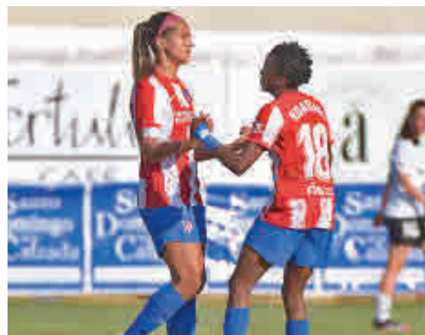
El Atlético tratará de recuperar su mejor versión

Colchoneras y franjirrojas arrancan el curso con la premisa de mejorar sus resultados de la pasada temporada. En el caso del Rayo la situación institucional invita a pensar en que el objetivo será un poco más complicado si