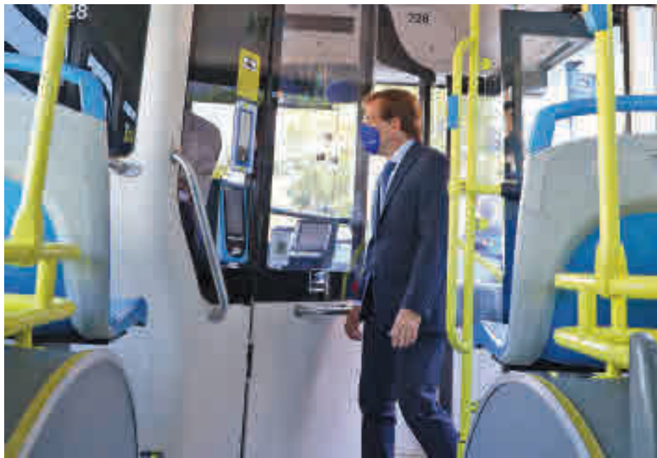
Martínez-Almeida comprobó el funcionamiento de la nueva línea exprés Plaza Elíptica-Islazul

Septiembre también será el mes de la implantación progresiva de tres nuevas líneas lanzadera de autobús de la