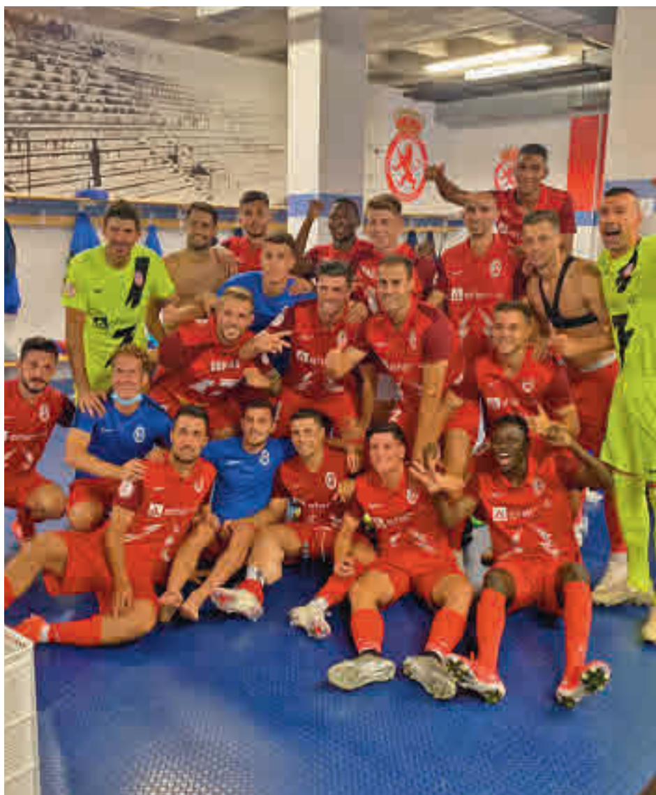
El Rayo Majadahonda logró un triunfo de postín en su visita a la Cultural Leonesa

Un punto más de ilusión si cabe se desprende del arranque de la competición en la Segunda RFEF. Con la remozada categoría de bronce un poco más cerca y por encima del pozo de Tercera, este