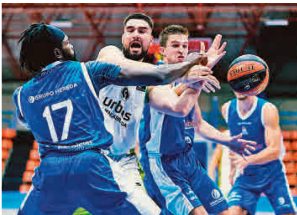
El Urbas, en un amistoso reciente con el Hereda San Pablo Burgos