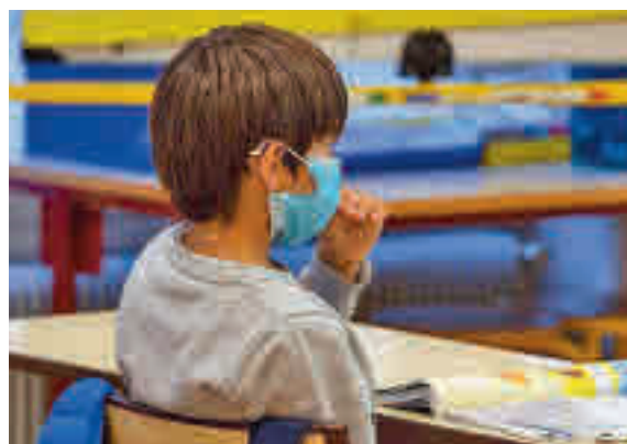
Las medidas siguen vigentes en las aulas

de la ratio de alumnos hasta los 25 niños por clase, cuando hace doce meses se fijó en 18, lo que supone que se volverá al reparto anterior. Los grupos serán burbuja, por lo que no se podrán mezclar entre sí niños de distintas clases.