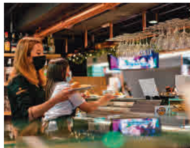
La hostelería espera la relajación de las restricciones

Ayuso ha hecho hincapié en que las medidas que quieren seguir aplicando "tendrán que hacerse con total prudencia en la tercera semana de septiembre". En este senti-