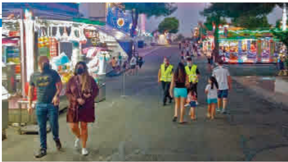
Imagen del recinto ferial

La nota discordante llegó con unos disturbios en el desalojo de un botellón que dejaron dos personas detenidas