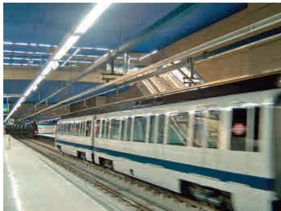
Estación de El Casar en Getafe

Por otra parte, este miércoles 1 de septiembre se abrió al tráfico el tramo de la Línea C-4 de Cercanías que discu-