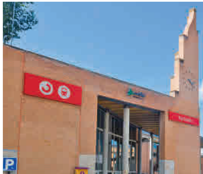
Estación de ferrocarril de Tres Cantos

Una vez acabada dicha actuación, la línea ya presta servicio con total normalidad desde el pasado miércoles 1 de