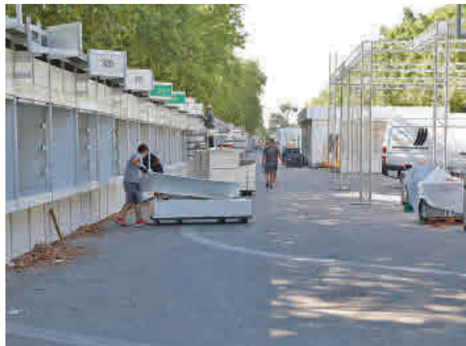
Los participantes ultiman el montaje de sus espacios