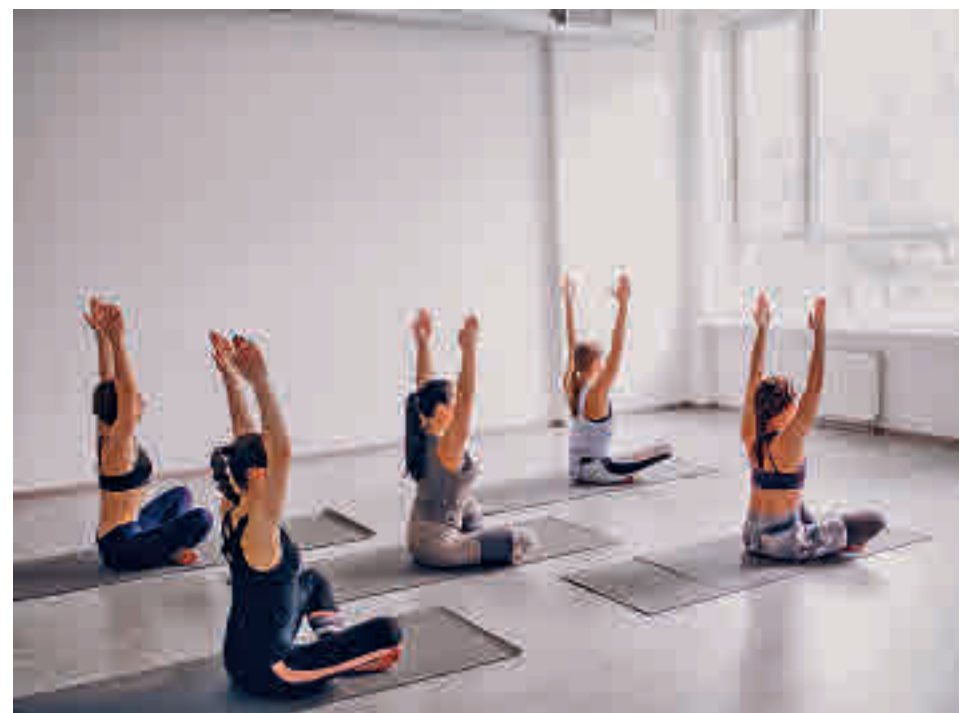
El yoga, una de las actividades que se impartirán

La programación al completo de los talleres, que arrancarán en octubre, se puede consultar en la página web Cen-