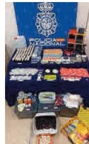
El material incautado

que abastecía a las zonas de ocio de Chueca y Malasaña. Según fuentes policiales, en el operativo fue detenido un individuo que preparaba y distribuía la droga desde su vivienda. En el registro del domicilio, los policías aprehen-