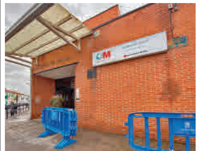
Centro de Salud de Colmenar Viejo Norte

En concreto, se han programado cuatro talleres para responder a la demanda de los diferentes públicos. Así, el Club de Lectura está dirigido a mayores de 18 años, mientras que el de Lectura de Cómics está enfocado a los amantes de este género. Por otro lado también está disponible el Club de Lectura Infantil, dirigido a niños y niñas de 6 a 8 años, mientras que la oferta se completa con el Taller de Pensamiento Filosófico.