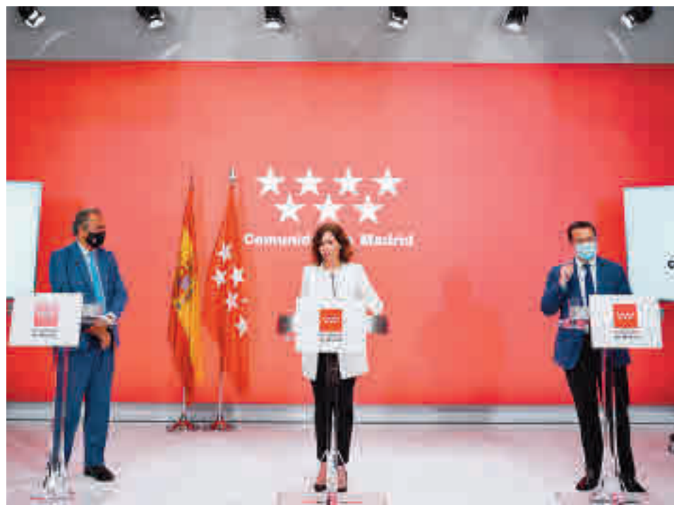
Isabel Díaz Ayuso, tras el Consejo de Gobierno

Por su parte, el impuesto sobre depósito de residuos, destinado a la protección del