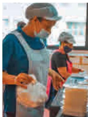
El servicio es gratuito

En un comunicado, la Concejalía de Educación explica que ya trabaja en un contrato para poder contar con este servicio todos los días no lectivos del curso, para dar a las familias que lo precisan esta garantía en la