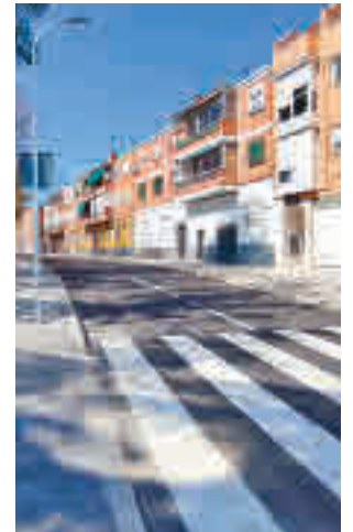
La actuación ya finalizada

Los trabajos comenzaron en febrero, y gracias a la inversión de 1,5 millones de euros, ya están unidas las calles de Gonzalo de Céspedes y de las Fraguas mediante la prolongación y remodelación de el actual viario de Ayerbe. Con la segunda fase, prevista para el próximo año, esta zona del distrito barajeño verá com-