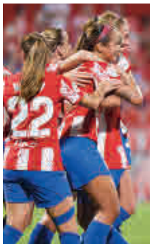
Buena imagen del Atlético