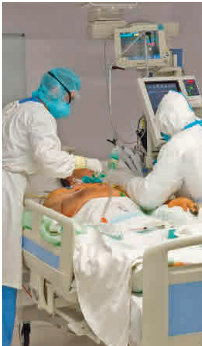
Los ingresos se reducen con la vacuna

Casi el 20% de los contagiados este verano en Madrid tenían la pauta completa • Las cifras muestran que estar inmunizado reduce las posibilidades de ser ingresado en planta o en la UCI