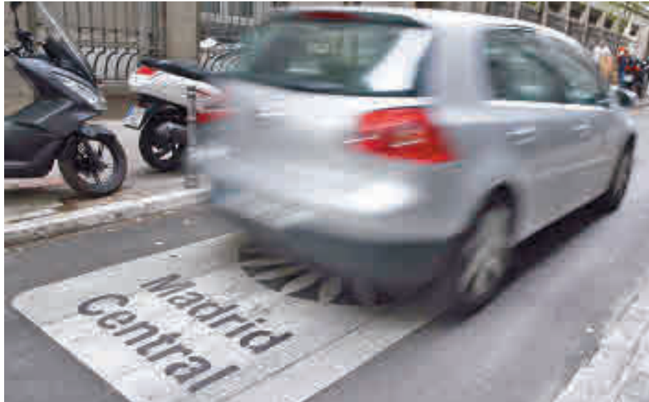
La zona de bajas emisiones que engloba el distrito Centro

En el caso de que el texto no tuviera los apoyos necesarios para salir adelante, el Ayuntamiento de la capital tendría un plazo de 10 días para anular Madrid Central tras recibir este miércoles 8 de septiembre la diligencia de