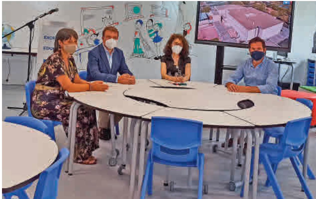
La concejal de Cultura, el primer Teniente de Alcalde y el alcalde visitaron el centro esta semana