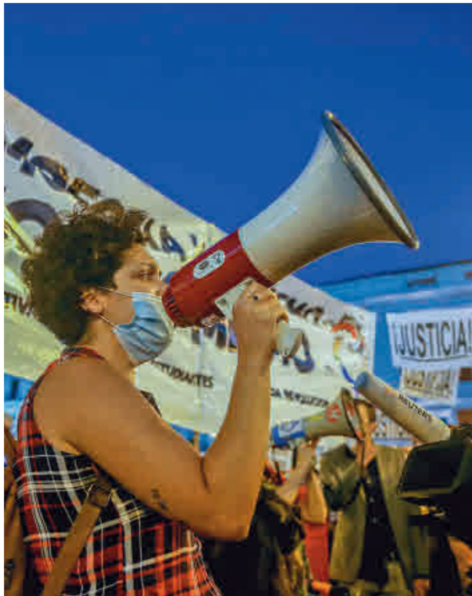
Concentración en Sol contra las agresiones homófobas

El cambio radical en el caso de Malasaña no provocó la suspensión de la concentración que el colectivo Madrid Marika realizó el miércoles en contra de las agresiones homófobas. "¿Sabéis por qué? Porque también estos últimos días ha habido agresiones en Toledo, en Melilla, en Castellón y en Vitoria", señaló en su cuenta de Twitter, mientras insistía en que "todas las que estáis leyendo esto habéis tenido que sufrir la violencia, el acoso, el miedo y el peligro de muerte". Varias decenas de personas acudieron a la protesta en la Puerta del Sol.