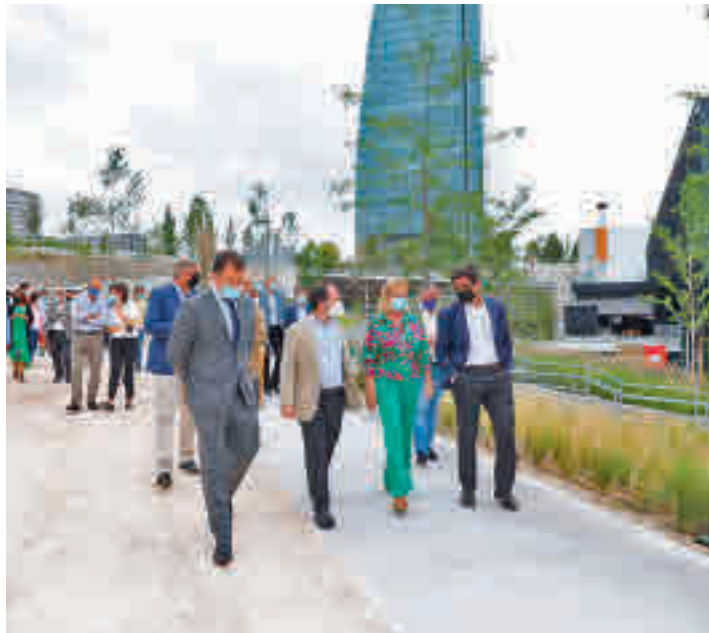
Las autoridades municipales recorrieron el parque

Este espacio, que cuenta con un superficie de 33.000 metros cuadrados, ha sido construido por Espacio Caleido con una inversión de 5