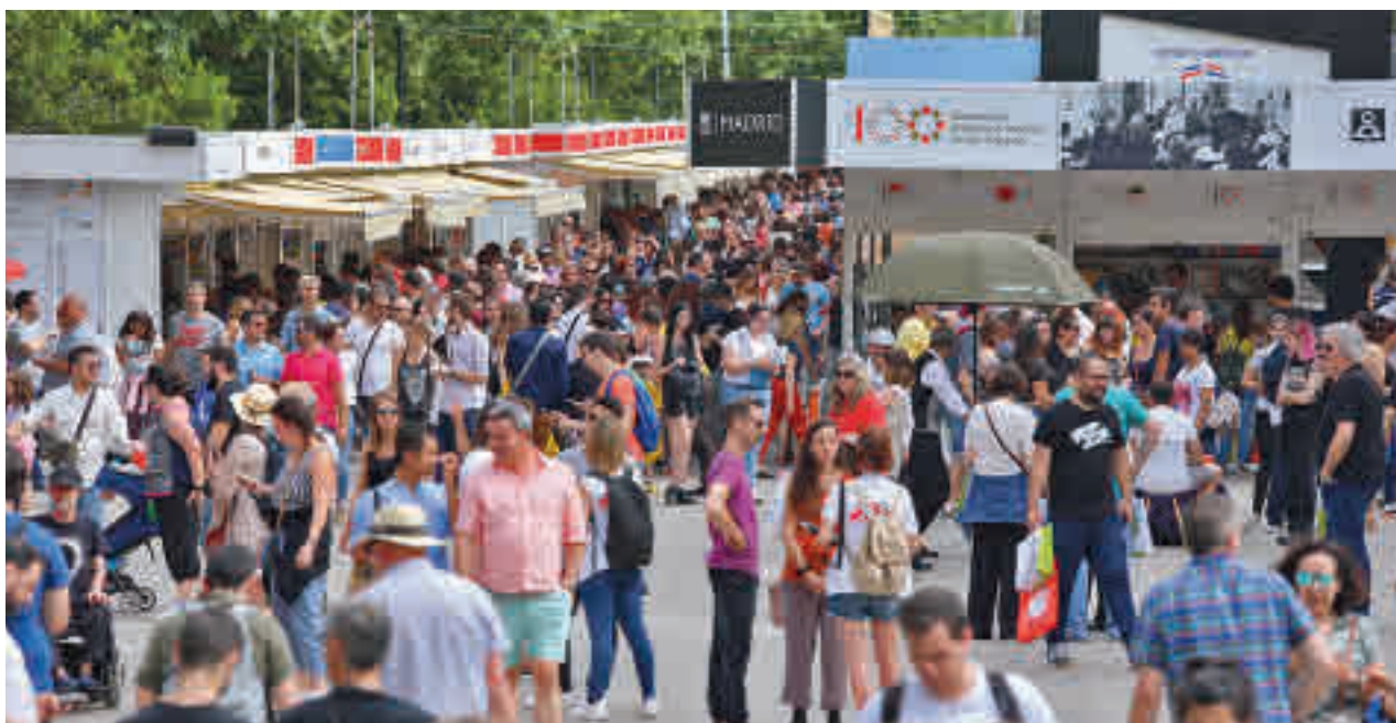
Las medidas de seguridad evitarán que se formen las colas de anteriores ediciones