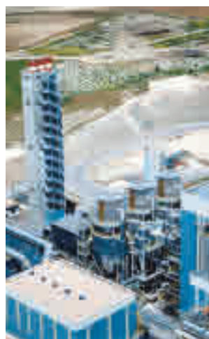
La planta de Las Lomas

bilidad y Cambio Climático de la Consejería de Medio Ambiente tanto de la apertura de diligencias de investigación por parte de la Fiscalía Provincial de Madrid, como del seguimiento, control e inspección por parte de esta