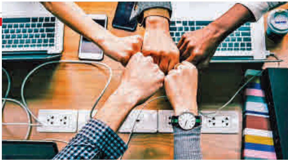
Cuidar las relaciones con el entorno, una de las claves para facilitar la vuelta al trabajo

Hacer una reflexión personal para establecer de forma clara metas ambiciosas, realistas y objetivas permite marcar un fin y el camino para intentar conseguirlo mientras se mejoran los resultados. Para ello, la empresa debe intentar facilitar la formación para que se mejoren las competencias.