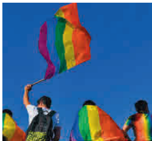
El colectivo LGTBI, protagonista

EL PERIÓDICO GENTE NO SE RESPONSABILIZA NI SE IDENTIFICA CON LAS OPINIONES QUE SUS LECTORES Y COLABORADORES EXPONGAN EN SUS CARTAS Y ARTÍCULOS