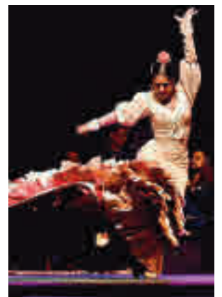
Cita obligada con el flamenco

Para abrir boca, este viernes 10 de septiembre tendrá lugar una inauguración que cuenta con la actuación de