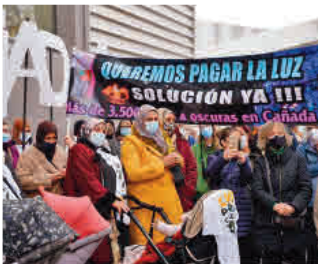
Una de las protestas vecinales frente a la Asamblea de Madrid