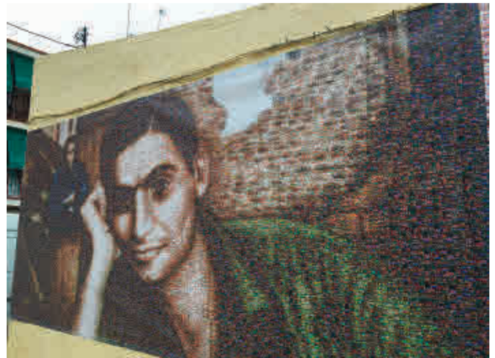
El mural antes de ser pasto de las llamas el pasado 8 de septiembre

El fuego calcinó una parte de la composición situada junto a la casa inmortalizada por el fotoperiodista en Peironcely 10 ● Fuentes policiales aseguran que el incendio fue accidental