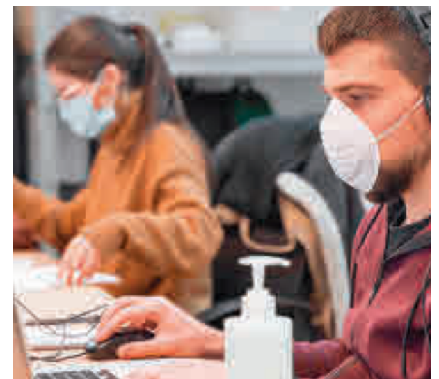
Trabajadores en una oficina

Entre ellas se encuentra implantar que los equipos sean responsables de su espacio, la instalación de elementos verticales como pantallas analógicas y digitales o incluso el estar de pie.