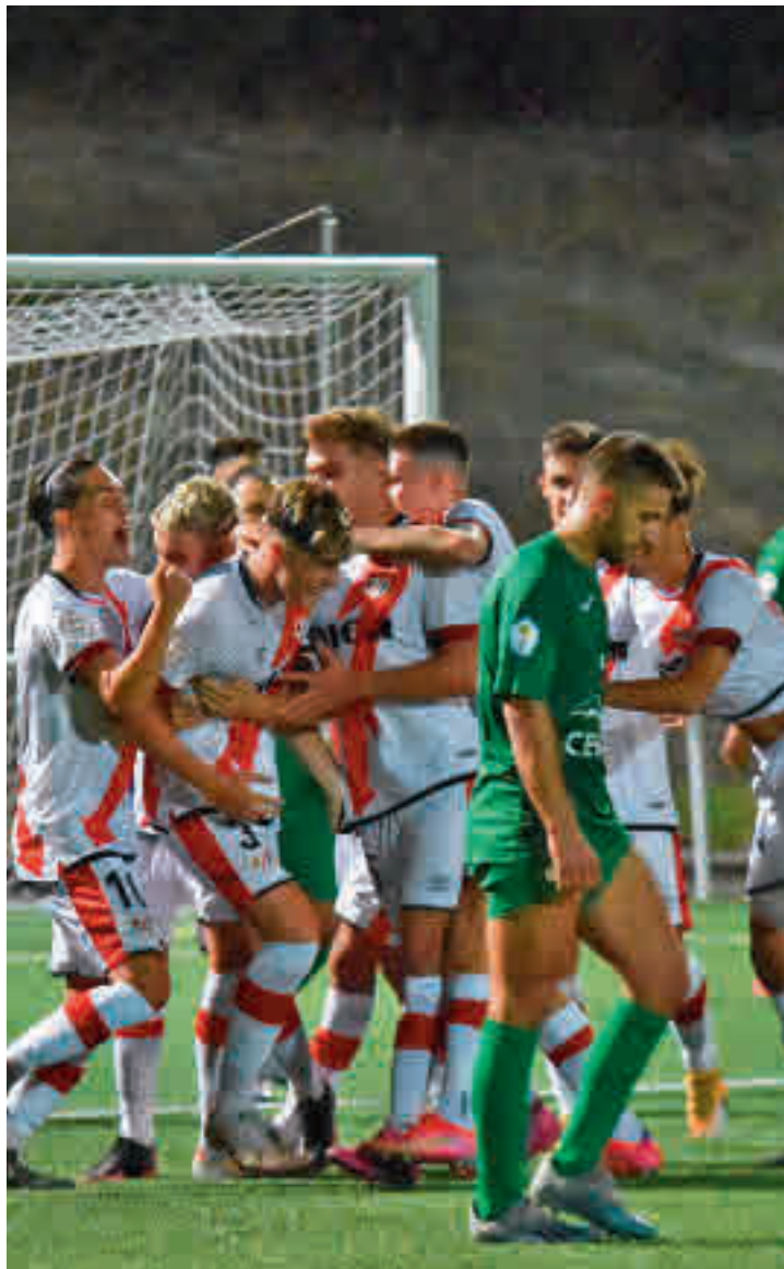
El Rayo B se impuso por 4-1 al Villaverde San Andrés

Una de las consecuencias directas de este alto número de participantes es que en algunos casos se deberán disputar jornadas entre semana. Sin ir más lejos,