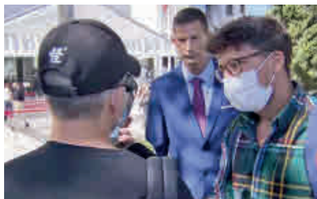
Sanitario víctima de la agresión

"Me rompió la cara y me reventó el ojo con algo, pero no fue ni con un móvil ni con un puñetazo", ha señalado el afectado a las puertas de los juzgados de Plaza de Casti-