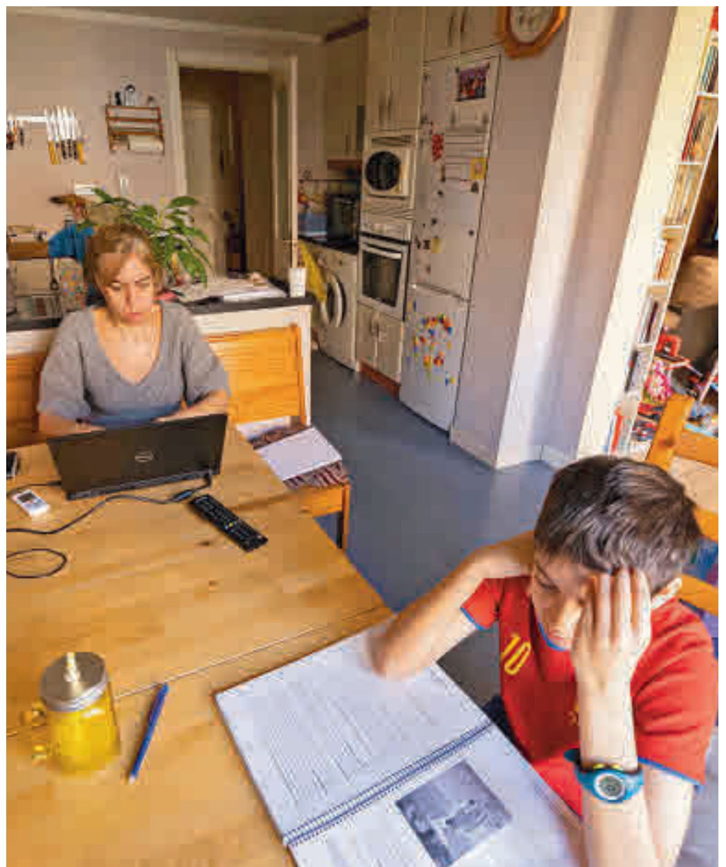
El teletrabajo ya se ha convertido en algo natural para muchos

En estas circunstancias quizás haya llegado el momento de plantearse cuál de los dos modelos, presencial o a distancia, es el que favorece más a los empleados. Y quizás la clave no esté en el cómo se