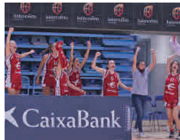
La selección femenina infantil logró el oro FEB

En ese choque por el bronce, Aragón plantó cara, pero los jóvenes madrileños tiraron de la aportación colectiva (cuatro jugadores anotaron diez o más puntos).