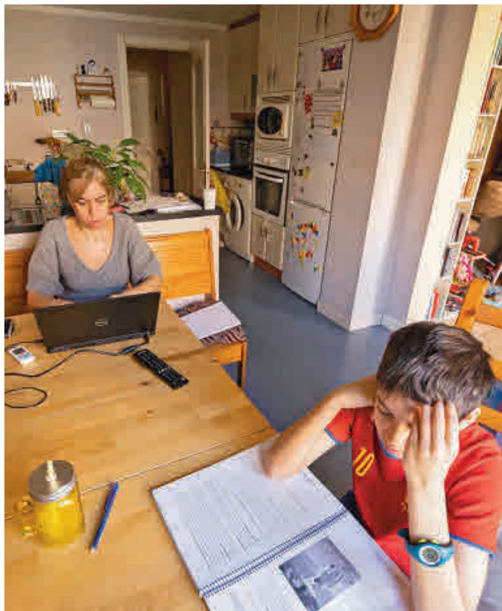
El teletrabajo ya se ha convertido en algo natural para muchos

En estas circunstancias quizás haya llegado el momento de plantearse cuál de los dos modelos, presencial o a distancia, es el que favorece más a los empleados. Y quizás la clave no esté en el cómo se