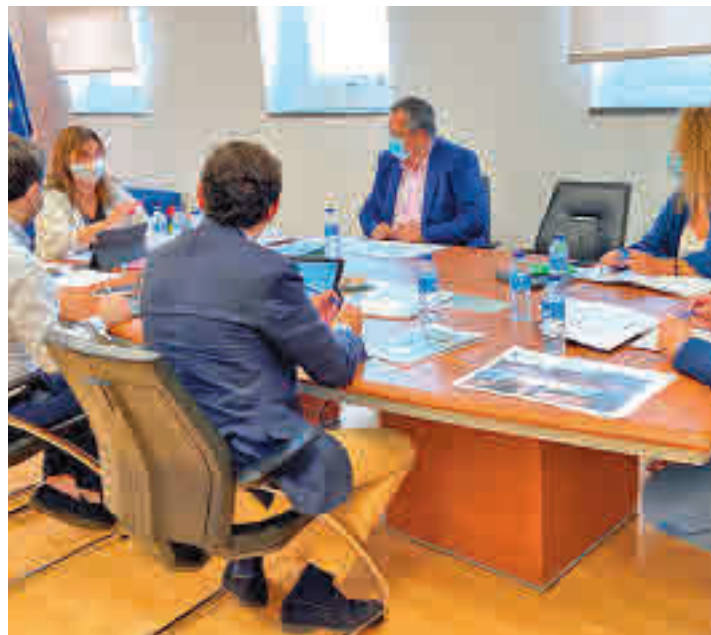
Una reunión de la Junta de Gobierno Local

Los vecinos de Pozuelo de Alarcón pagarán menos en el recibo del IBI (Impuesto de Bienes Inmuebles) del próximo año 2022. En concreto, la bajada será del 5,6%, al pasar el tipo impositivo del 0,45 al 0,425, tras aprobar la semana pasada el Ayuntamiento en Junta de Gobierno el proyecto de modificación de la Ordenanza Fiscal Reguladora del Impuesto de Bienes Inmuebles.