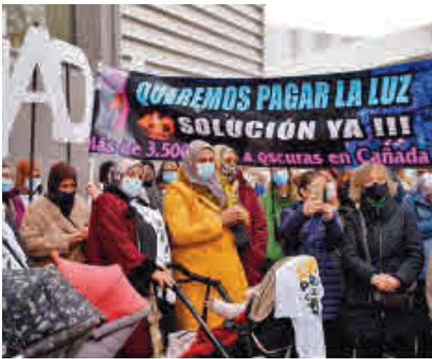
Una de las protestas vecinales frente a la Asamblea de Madrid