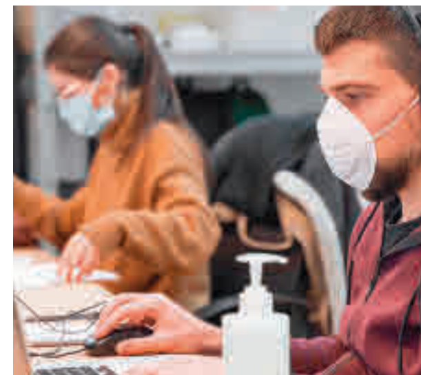
Trabajadores en una oficina

Entre ellas se encuentra implantar que los equipos sean responsables de su espacio, la instalación de elementos verticales como pantallas analógicas y digitales o incluso el estar de pie.