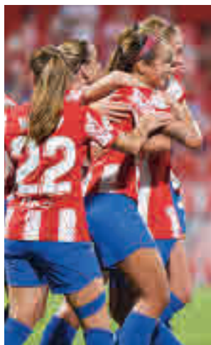
Buena imagen del Atlético