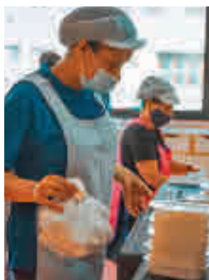
El servicio es gratuito

En un comunicado, la Concejalía de Educación explica que ya trabaja en un contrato para poder contar con este servicio todos los días no lectivos del curso, para dar a las familias que lo precisan esta garantía en la