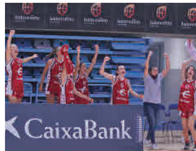
La selección femenina infantil logró el oro FEB

En ese choque por el bronce, Aragón plantó cara, pero los jóvenes madrileños tiraron de la aportación colectiva (cuatro jugadores anotaron diez o más puntos).