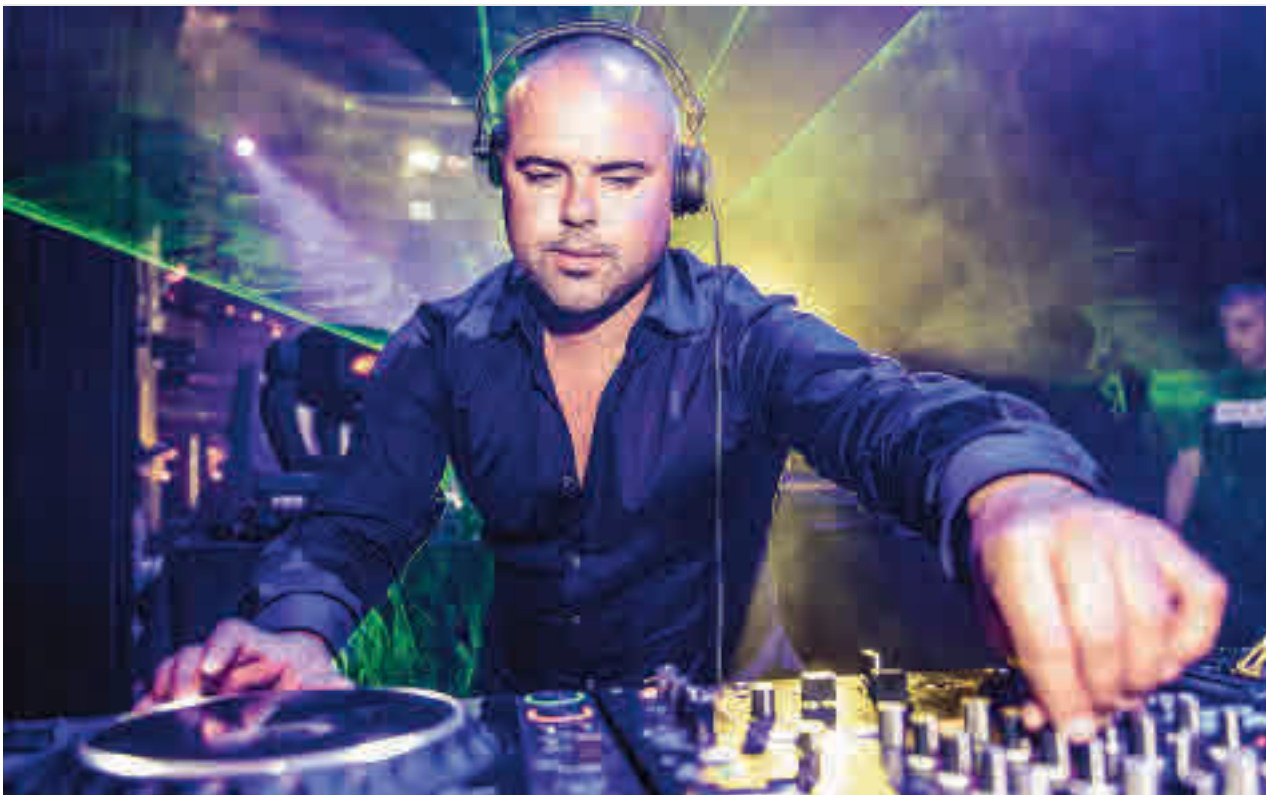
Juan Magán, uno de los nombres más populares del cartel