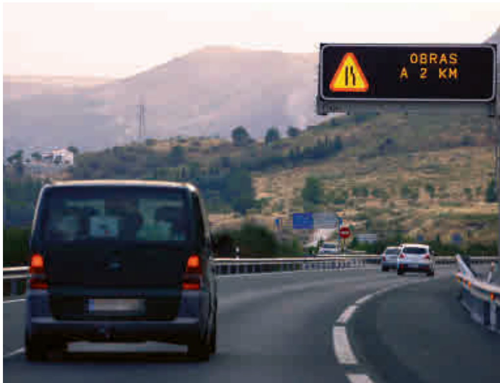
Obras en la A-6 y en la M-505 en Majadahonda