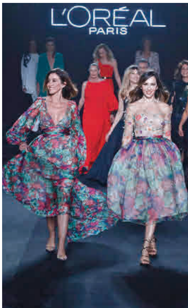
Roberto Verino presentó 'Nomadismo urbano'

Aunque la situación epidemiológica ya permite una mayor afluencia de público (hasta un 42% de forma presencial en los desfiles), los organizadores han dado continuidad al formato híbrido, combinando desfiles presenciales con otros online. Lo