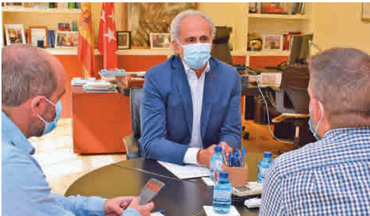
CHEMA MARTÍNEZ / GENTE