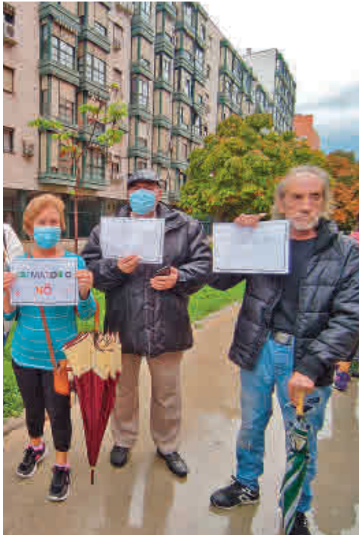
La asamblea vecinal del pasado 14 de septiembre

La noticia que ha sembrado la inquietud vecinal se produjo el 12 de julio cuando el Tribunal Supremo reclamó al Ayuntamiento de Madrid