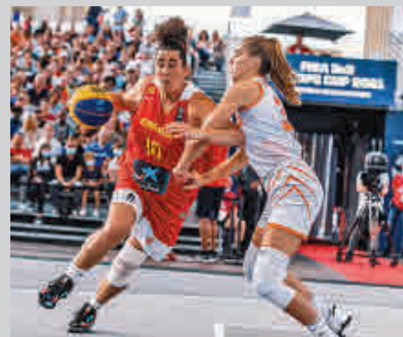
Cuevas ha logrado cuatro medallas en Europeos