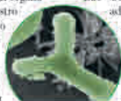
Ayuda eficaz con la bifidobacteria B. bifidum HI-MIMBb75

Nuestro intestino es una verdadera maravilla: en una longitud de unos seis metros, descompone los alimentos en componentes vitales como vitaminas, enzimas y oligoelementos. A los 75 años, el órgano más grande de nuestro cuerpo ha procesado alrededor de 30 toneladas de alimentos. A pesar de su gran rendimiento, el intestino también es muy sensible. Muchas personas sufren repetidamente dolencias como diarrea, dolor intestinal o flatulencia. Según los expertos, la causa suele ser una barrera intestinal dañada. Aquí es exactamente donde ayuda Kijimea Colon Irritable PRO (disponible en farmacias sin receta médica).