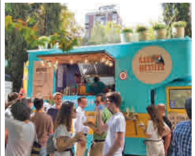
Imagen de archivo de MadrEAT

El sábado comenzará con la presentación de la colección de Isabel Sanchís, a quien seguirá Maya Hansen. Tras ella, será el turno de Custo Barcelona y de la firma Otrura. Antes de poner fin a la jornada, se entregarán los premios L'Oréal Paris a la Mejor Colección y L'Oréal Paris a la Mejor Modelo. Hay que destacar que, además, la edición de este año contará con el premio Allianz Ego Confidence in Fashion, para contribuir al desarrollo creativo y empresarial de los jóvenes creadores.