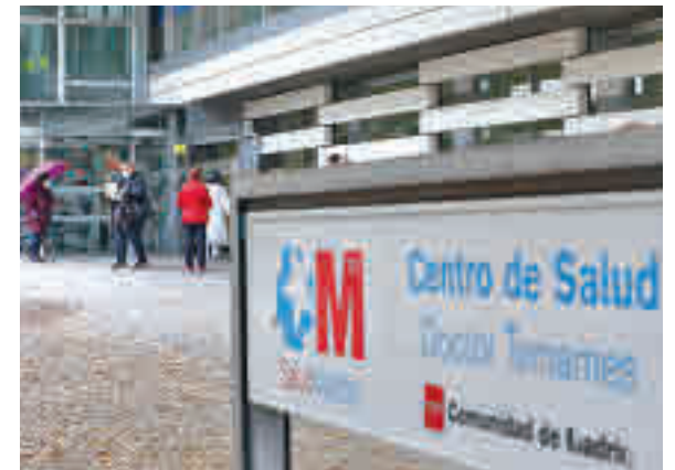
Centro de salud

Cuestionado por las numerosas quejas de los usuarios de la Atención Primaria por la falta de médicos y las dificultades para conseguir una cita presencial, Enrique Ruiz Escudero reconoció que la pandemia ha provocado “que los sitios que estaban más al límite en cuanto a personal se hayan resentido”. El consejero señaló que en los últimos meses han reforzado la plantilla con 2.500 profesionales y que están negociando un plan dotado con casi 80 millones de euros para incorporar a nuevos sanitarios para los centros.