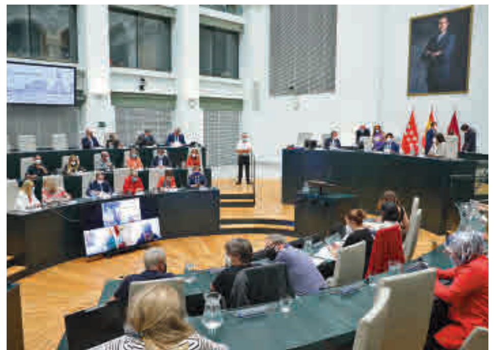
Un momento de la sesión extraordinaria del pasado 13 de septiembre

La ciudad contará de manera progresiva con una gran Zona de Bajas Emisiones para mejorar la calidad del aire y se contempla la restricción progresiva de la circulación a los vehículos más contaminan-