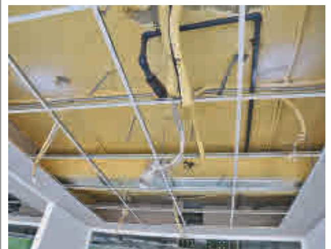
Estado del techo del edificio

La Comunidad iniciará las obras de reforma del campo de fútbol y la pista de atletismo del complejo Bolitas del Airón en Valdemoro.