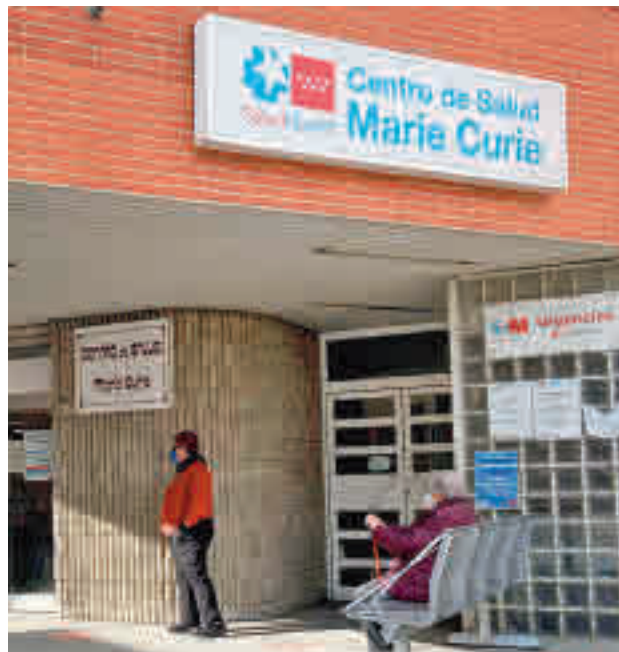
La tendencia sigue a la baja en el Sur

El resto de las grandes localidades del Sur de la región ya está por debajo del límite de 150, en línea con las cifras que se han registrado esta semana en la Comunidad de