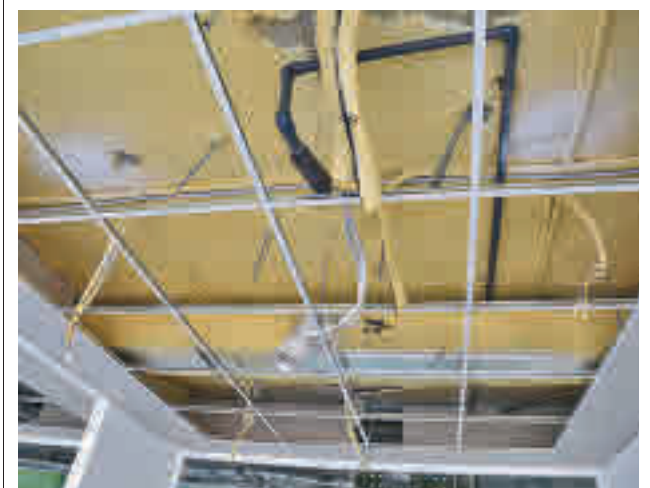
Estado del techo del edificio

La Comunidad iniciará las obras de reforma del campo de fútbol y la pista de atletismo del complejo Bolitas del Airón en Valdemoro.