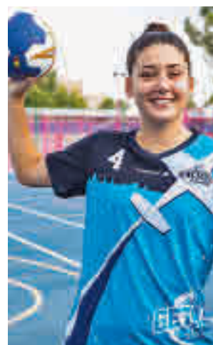
El Getasur, un clásico

Así, no es de extrañar que en esta primera jornada ya haya un derbi, el que jugarán el Ikasa BM Madrid Boadilla y el Core Global BM Parla (sábado, 20:30 horas). También jugará como local el +Ventosas Leganés, que recibe al Pozuelo Calatrava (sábado, 18 horas), mientras que el Sanse y el Getasur se tendrán que desplazar hasta las canchas del BM Roquetas y el UCAM Murcia, respectivamente.