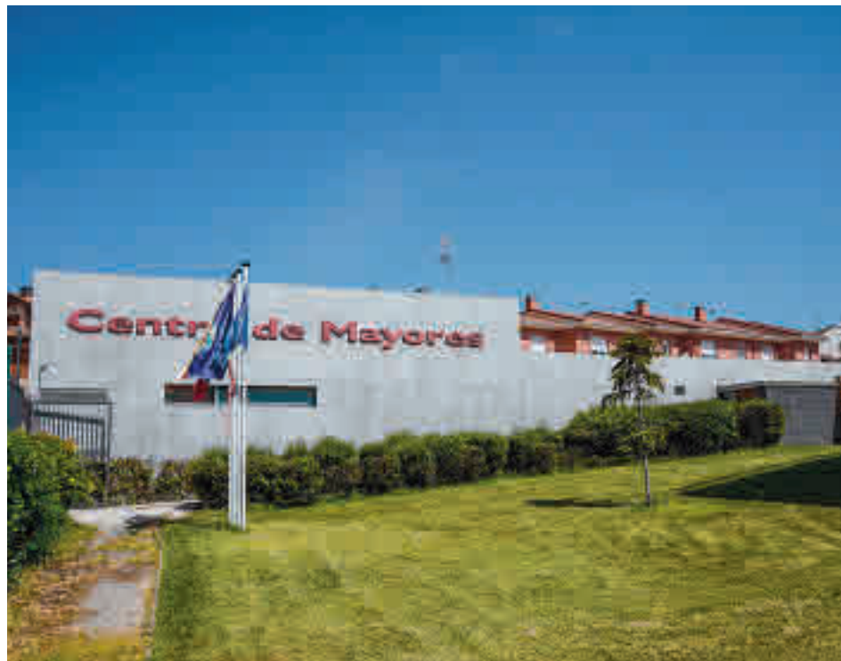
Cada usuario puede inscribirse en dos actividades

Afortunadamente, esa etapa va formando parte del pasado y Colmenar Viejo sigue avanzando hacia la nueva normalidad con la oferta de actividades presenciales para los centros de mayores del municipio, compuesta por por más de una veintena de opciones y 700 plazas dispo-