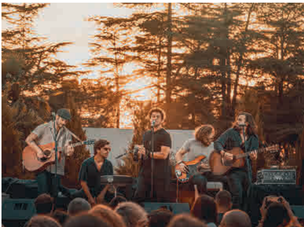
El grupo Playa Cuberris actuará este sábado junto a bandas locales