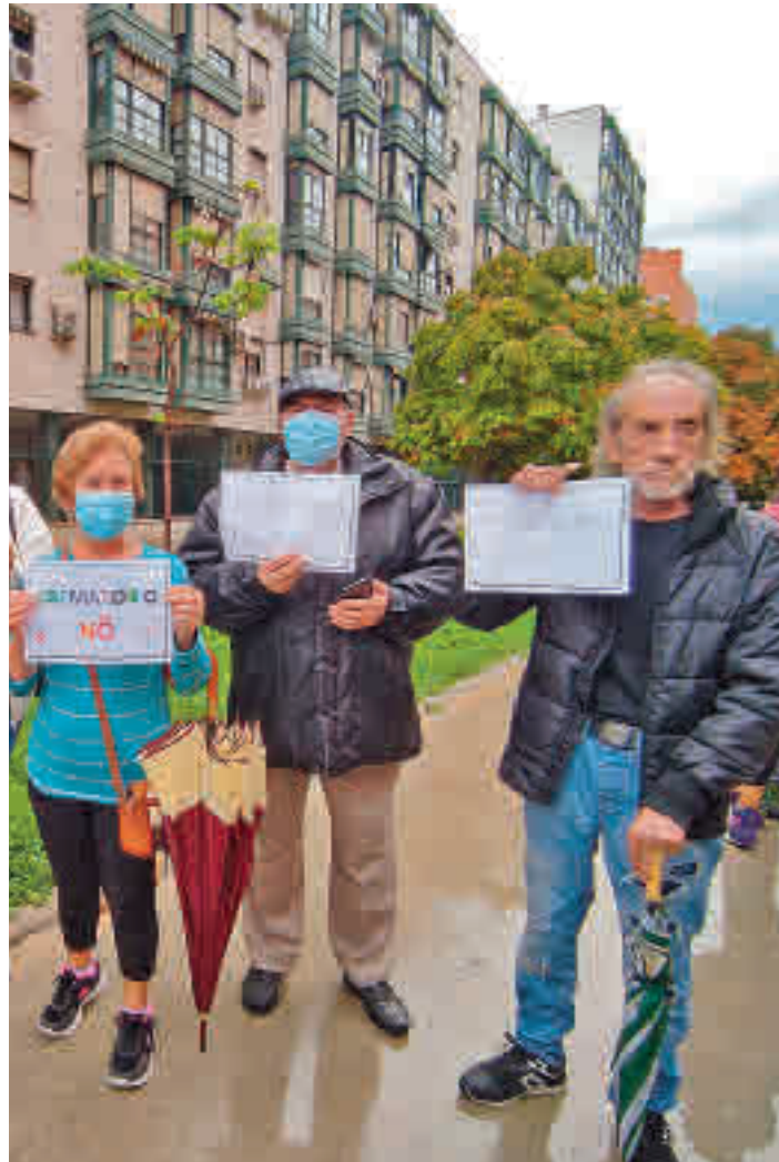
La asamblea vecinal del pasado 14 de septiembre

La noticia que ha sembrado la inquietud vecinal se produjo el 12 de julio cuando el Tribunal Supremo reclamó al Ayuntamiento de Madrid