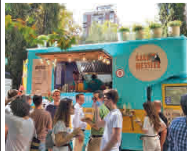
Imagen de archivo de MadrEAT

El sábado comenzará con la presentación de la colección de Isabel Sanchís, a quien seguirá Maya Hansen. Tras ella, será el turno de Custo Barcelona y de la firma Otrura. Antes de poner fin a la jornada, se entregarán los premios L'Oréal Paris a la Mejor Colección y L'Oréal Paris a la Mejor Modelo. Hay que destacar que, además, la edición de este año contará con el premio Allianz Ego Confidence in Fashion, para contribuir al desarrollo creativo y empresarial de los jóvenes creadores.