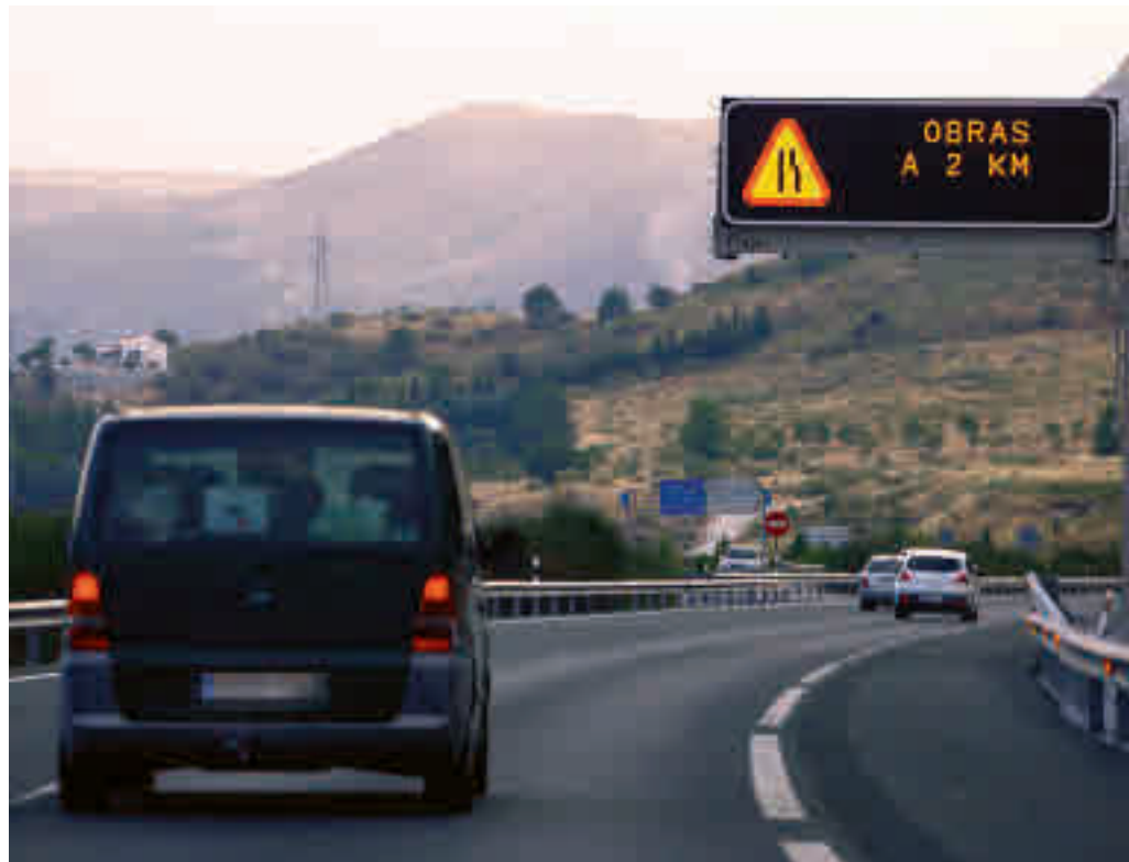
Obras en la A-6 y en la M-505 en Majadahonda