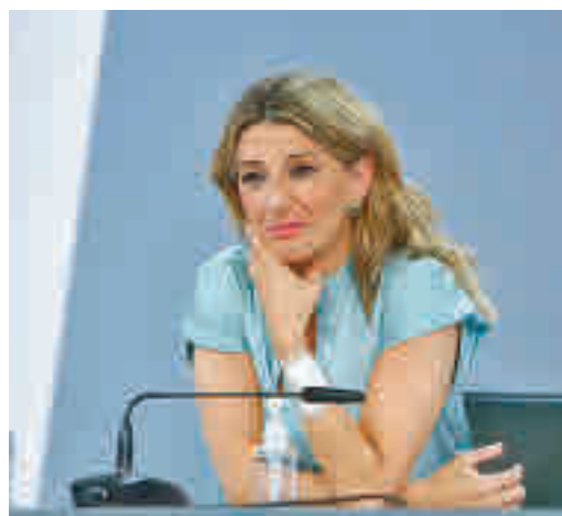
Yolanda Díaz, ministra de Trabajo

EL PERIÓDICO GENTE NO SE RESPONSABILIZA NI SE IDENTIFICA CON LAS OPINIONES QUE SUS LECTORES Y COLABORADORES EXPONGAN EN SUS CARTAS Y ARTÍCULOS