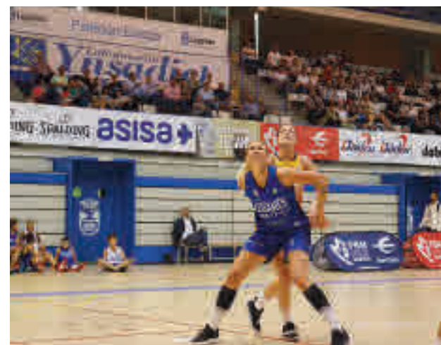
Doble sesión en el Pabellón Europa FBM

Movistar Estudiantes y el Innova-TSN Leganés, dos conjuntos que esta temporada militarán en la máxima categoría nacional. El choque servirá, además, para que el conjunto pepinero se presente ante su afición antes de una temporada histórica que dará comienzo el siguiente fin de semana, con visita a la cancha del Casademont Zaragoza.