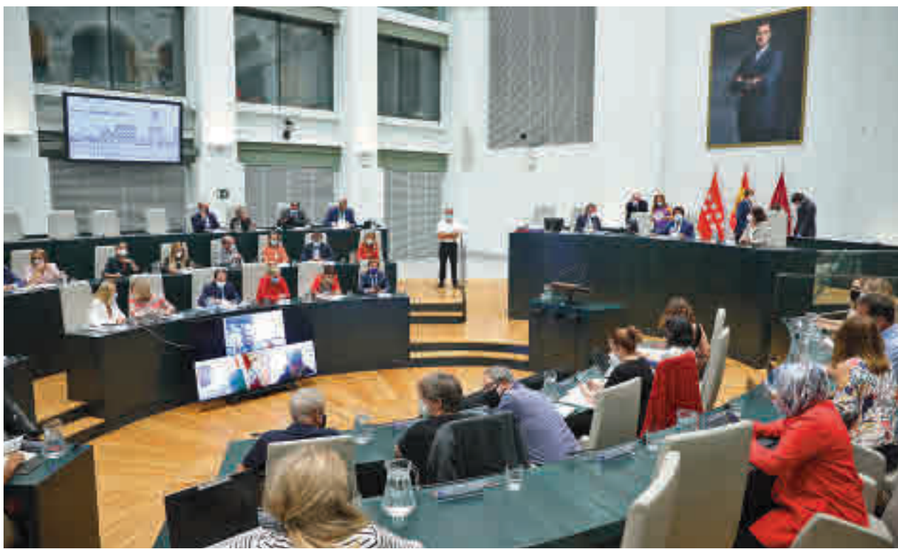
Un momento de la sesión extraordinaria del pasado 13 de septiembre