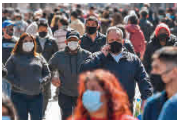
Las mascarillas seguirán con nosotros

"Ya estamos empezando a no tener que utilizarla en determinados ambientes y lo vemos claro en deporte o al aire según en qué situación, pero la mascarilla hasta que esta pandemia desa-