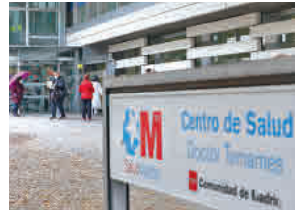
Centro de salud

Cuestionado por las numerosas quejas de los usuarios de la Atención Primaria por la falta de médicos y las dificultades para conseguir una cita presencial, Enrique Ruiz Escudero reconoció que la pandemia ha provocado “que los sitios que estaban más al límite en cuanto a personal se hayan resentido”. El consejero señaló que en los últimos meses han reforzado la plantilla con 2.500 profesionales y que están negociando un plan dotado con casi 80 millones de euros para incorporar a nuevos sanitarios para los centros.