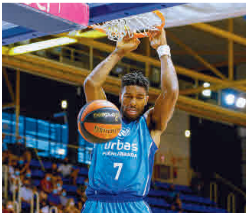
El Fernando Martín acogerá este domingo (12:30) el Urbas-Gran Canaria