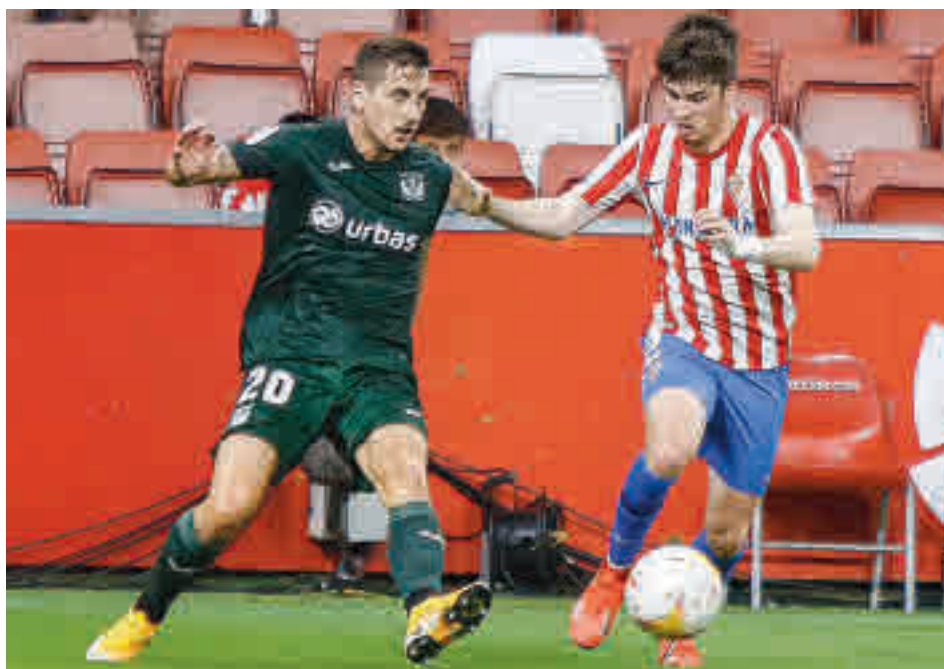
El Leganés solo ha podido sumar dos puntos en las cinco primeras jornadas LALIGA.ES

Tampoco acaba de encontrar la regularidad deseada un Fuenlabrada que se está convirtiendo en el rey del empate. La igualada ante el Zaragoza fue la tercera consecutiva, un balance que deja al equipo que prepara José Luis Oltra en la zona templada de la tabla (duodécima posición) a la espera de lo que suceda este domingo (14 horas) en su visita al campo de un Huesca que tampoco está para grandes alegrías y que cuenta con los mismos puntos.