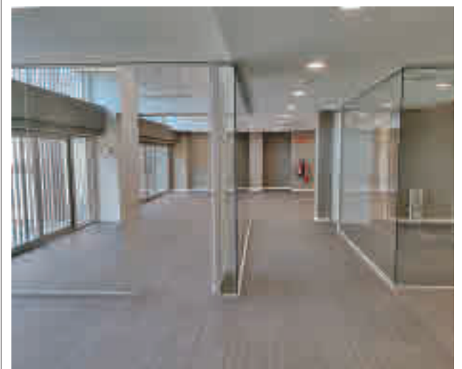
Una de las dependencias de la Agencia de Empleo

gentedigital.es Toda la actualidad de los distritos de Madrid, en nuestra web