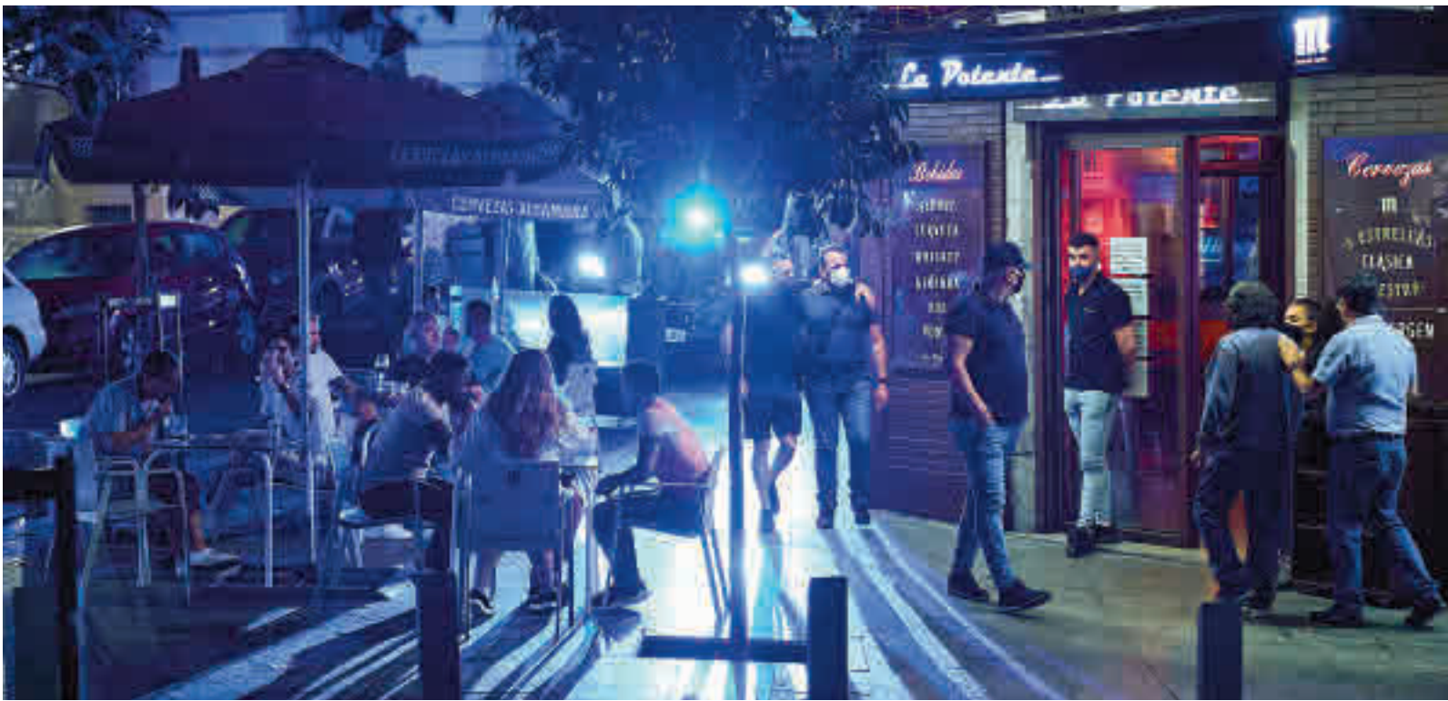
La hostelería, el ocio nocturno y las actividades culturales abandonan las restricciones horarias