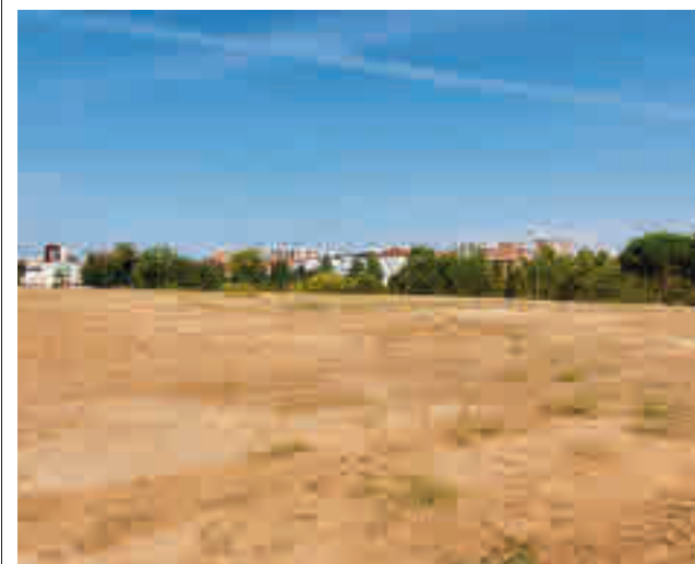
La parcela cedida al músico madrileño

gentedigital.es Toda la actualidad de los distritos de Madrid, en nuestra web