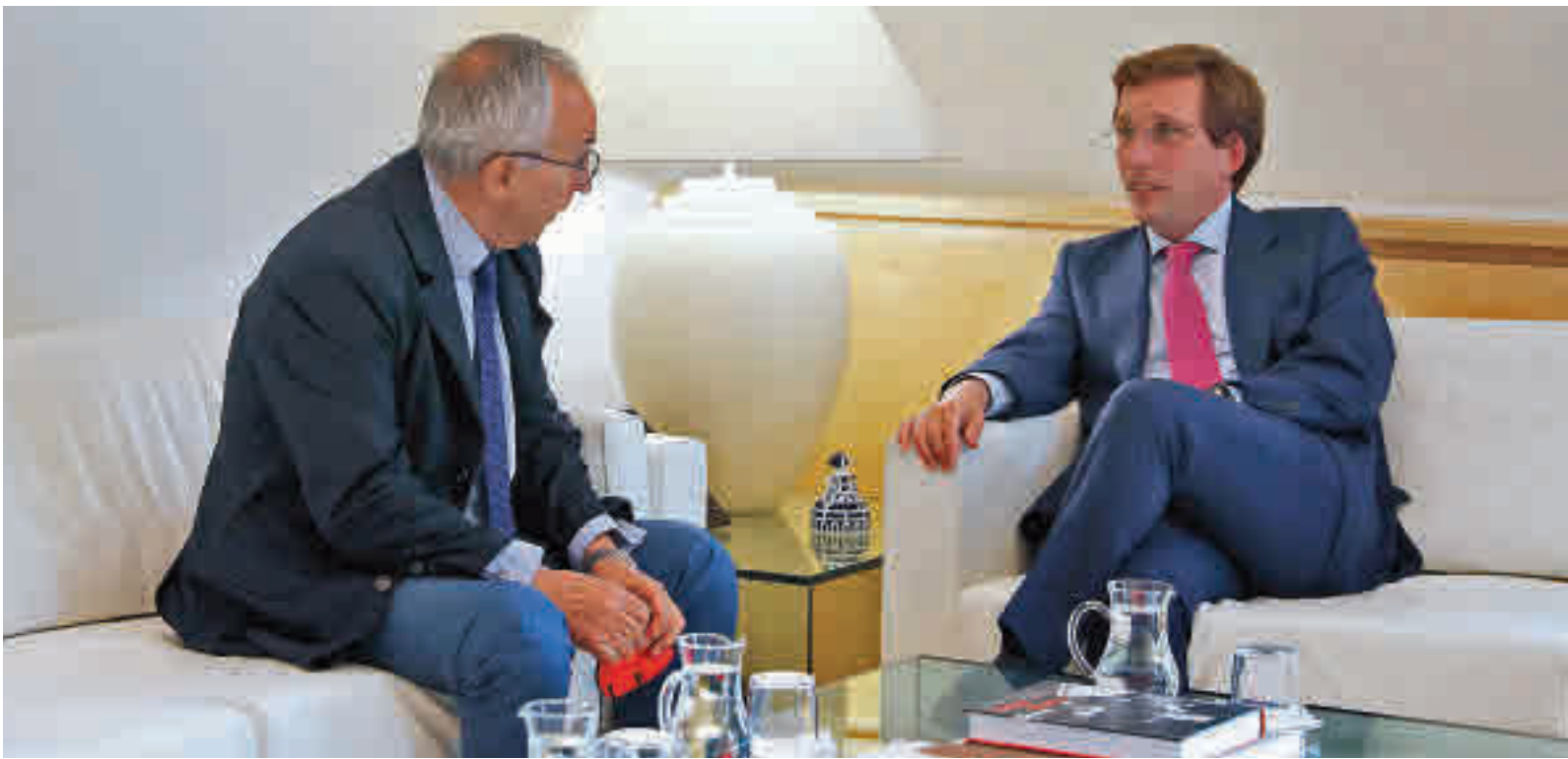
Alejandro Blanco y José Luis Martínez-Almeida se reunieron esta semana