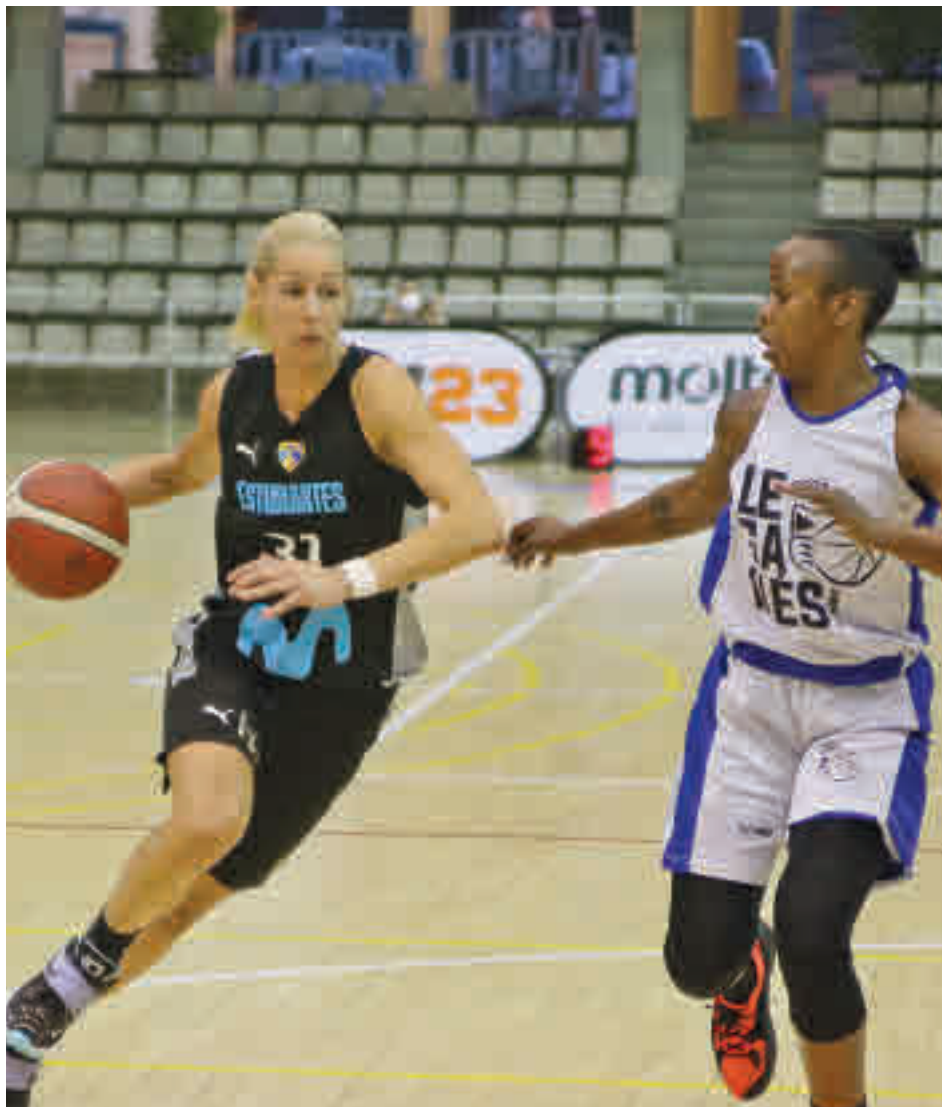
El Innova-tsn Leganés se impuso al Movistar Estudiantes en el Memorial J. M. Caño

El deseo de repetir al menos el papel del curso anterior del Movistar Estudiantes contrasta con la ilusión de un debutante. El Innova-tsn Leganés se estrenará en la máxima ca-