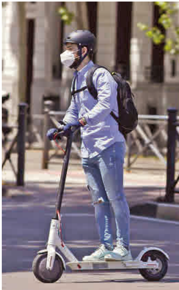
La movilidad eléctrica va en aumento

Por otro lado, un 76% de la población encuestada querría un sistema tarifario integrado conjunto de transporte público que incluyera los servicios de micromovilidad compartida. Una demanda que obtiene un mayor respaldo en concreto entre los sevillanos (82%), los malagueños (80%) y los zaragozanos (81%). Para Brunelleschi, estos datos desmienten "la falacia de que las opciones de movilidad compartida son una amenaza