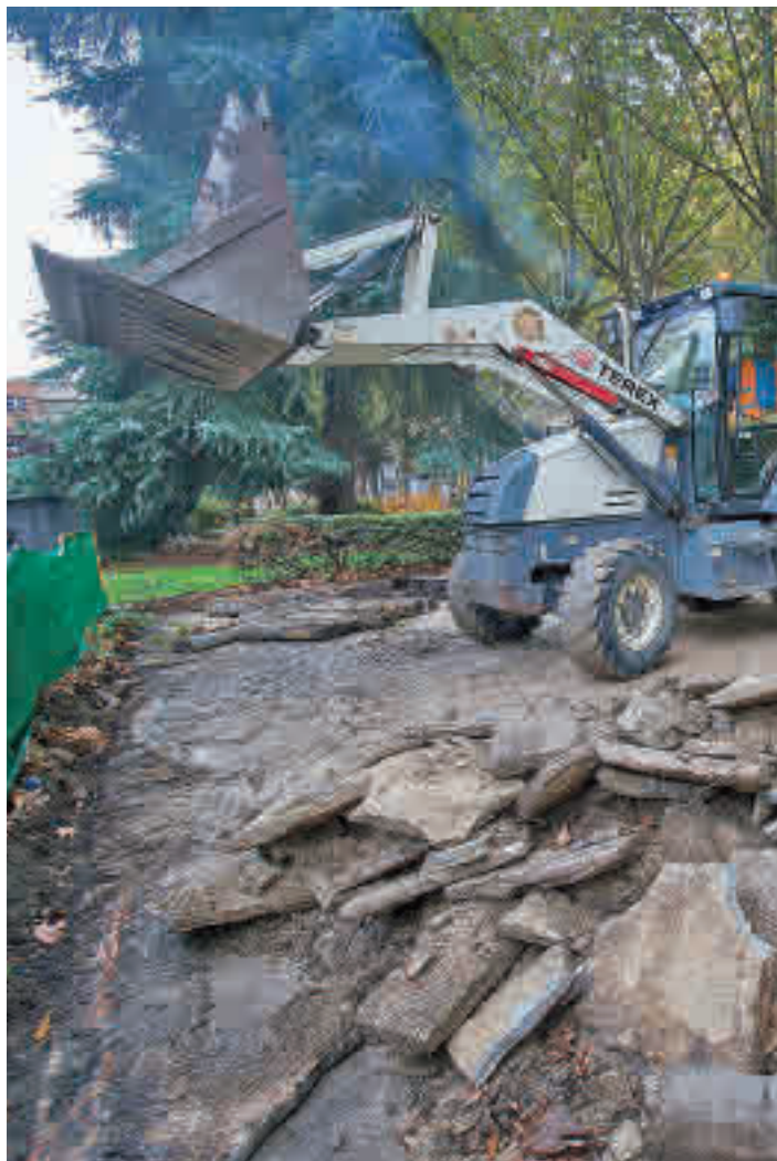
Una máquina levanta el solado en el entorno de la calle de Basílica

Para evitar las filtraciones de agua que se producen en el túnel de AZCA, al que se accede desde esta calle, se ha previsto un refuerzo del pavimento de la zona de los jardines que discurren sobre el túnel para modificar la escorrentía y evitar que se pro-