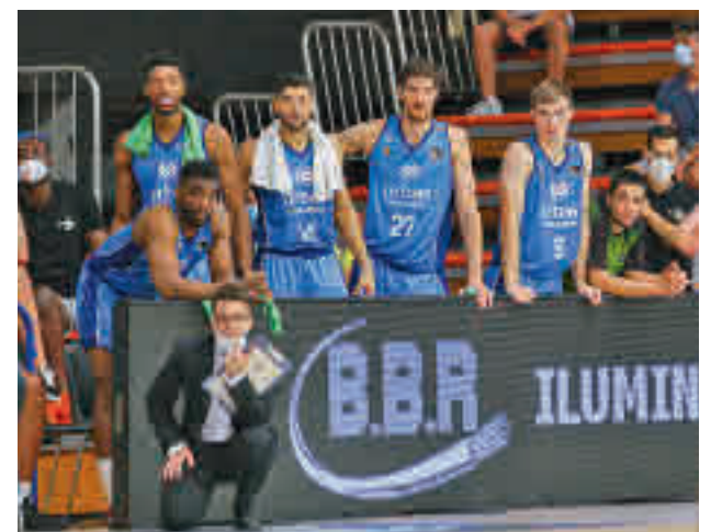
El Urbas cayó derrotado en su debut liguero B. FUENLABRADA

Más lejano aparece en el horizonte el estreno en la Euroliga el jueves 30 (20:45 horas) con el Anadolu Efes, el vigente campeón continental.