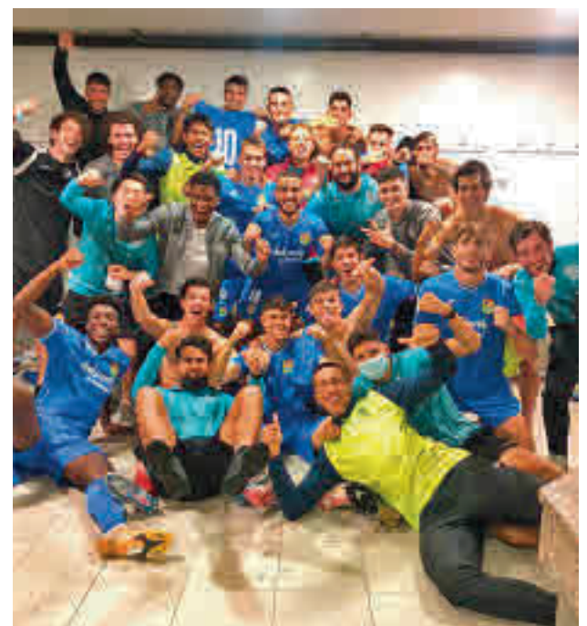
El Fuenlabrada Promesas, una de las sensaciones

Estos cambios también serán palpables en la carrera del domingo. Se han espaciado las pruebas aún más y las salidas se realizarán por varios bloques para tratar de garantizar, en la medida de lo posible, la distancia de seguridad. Así, el 10k arrancará a las 7:45, el maratón a las 8:45 y, por último, el medio maratón se iniciará a las 11.