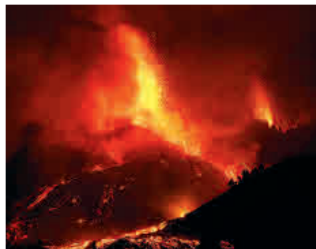
Erupción del volcán de Cumbre Vieja en La Palma

Palma. López indicó que la presidenta regional, Isabel Díaz Ayuso, mantuvo una conversación con su homólogo canario, Ángel Víctor Torres, al que ofreció ayuda prestada en el momento que requiera. "Nuestra preocupación y apoyo a La Palma en estos momentos de tanta incertidumbre. Con la esperanza de que solo haya daños materiales", escribió luego la