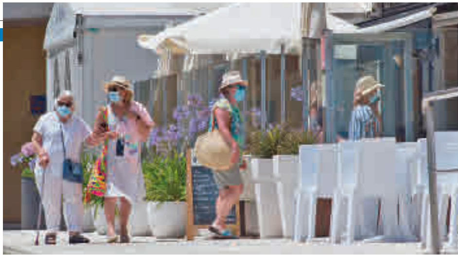
El gasto vacacional ha aumentado en este verano

La recuperación económica y el levantamiento de las restricciones han animado el consumo ● Así lo señala un estudio del Observatorio Cetelem