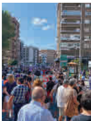
La protesta vecinal

Desde entonces, sus 24.000 pacientes reciben asistencia en la calle de Cándido Ma-