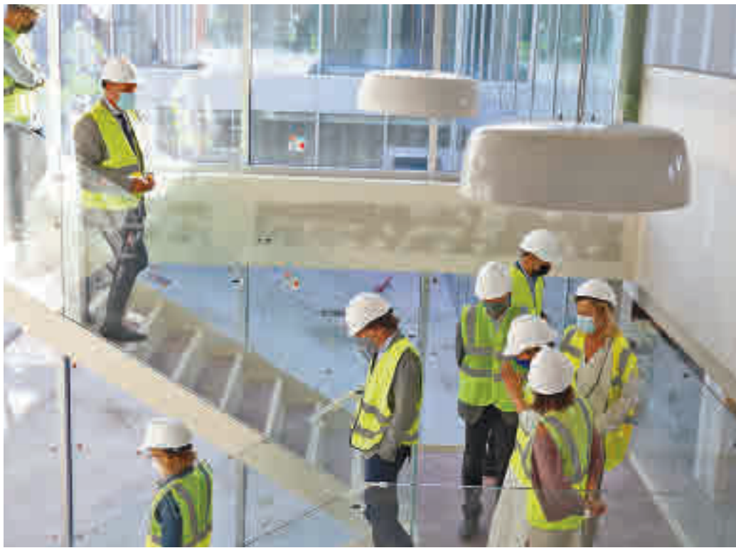
El alcalde recorrió las diferentes dependencias del futuro equipamiento público