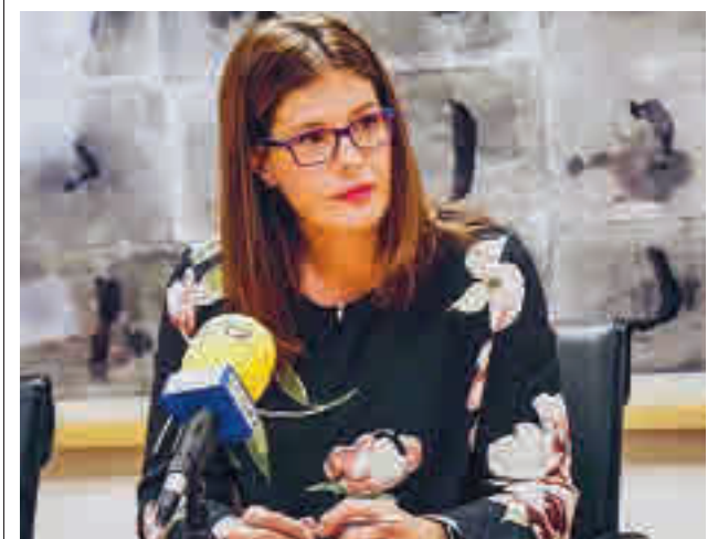
La alcaldesa de Móstoles, Noelia Posse

La Guardia Civil y la Policía local de Valdemoro han detenido a un individuo por el robo de un vehículo en un aparcamiento.