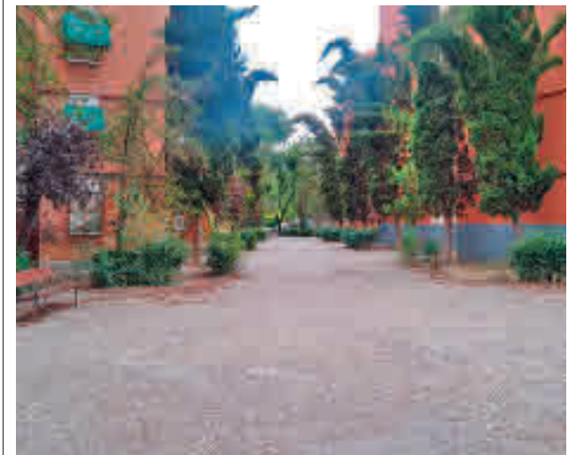
Una de las futuras zonas de actuación urbanística

Según fuentes municipales, el objetivo de este proyecto es la reforma urbanística integral de la zona para mejorar la seguridad vial, la accesibilidad y movilidad urbana y las conexiones peatonales, eliminando barreras arquitectónicas y ensanchando aceras. Además, se renovarán todos los pavimentos y se actuará en las áreas ajardinadas interiores y exteriores, creando itinerarios accesibles a las viviendas.