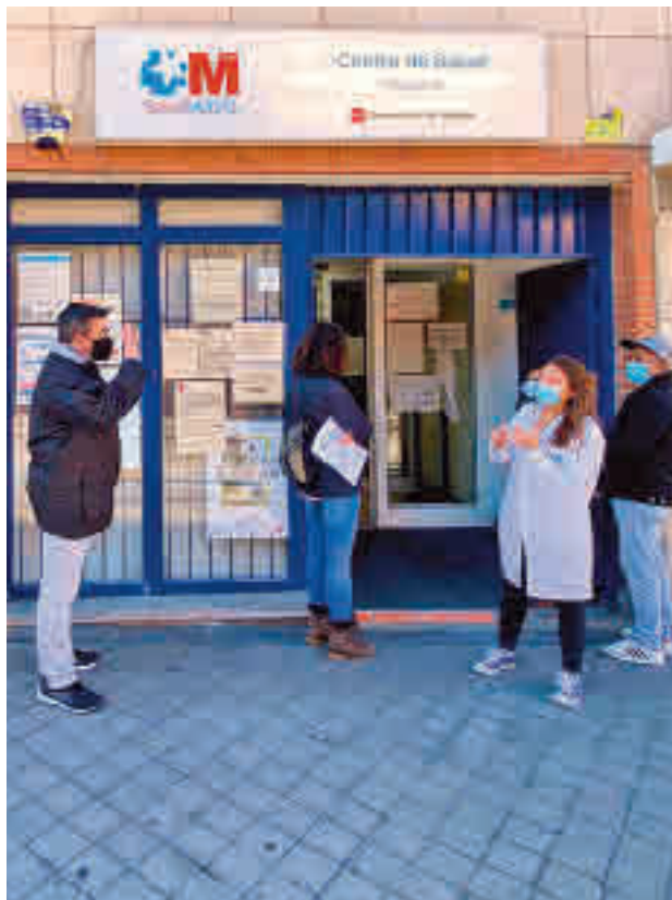
La incidencia sigue bajando en el Sur

Alcorcón (70) es la ciudad que menos incidencia acumulada presenta, seguida de cerca por Móstoles (78) y por Leganés (85). El informe epi-