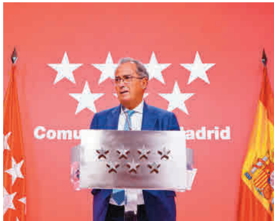
El calendario se aprobó en el Consejo de Gobierno

SE CONSULTA CON EL RESTO DE GRUPOS, LA IGLESIA Y LOS EMPRESARIOS