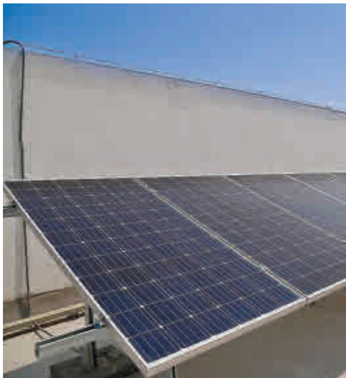
El Lorenzo Rico es uno de los espacios donde podrían colocarse placas

Así, los ingenieros municipales se han puesto manos a la obra para instalar paneles solares en las cubiertas del Complejo Deportivo Lorenzo Rico y los centros educativos para, de este modo, apoyarse en una energía renovable que en nuestro país es muy provechosa, gracias al alto número de horas de sol. En este sentido, desde el Consistorio explican que la infraestructura del Lorenzo Rico es especialmente aprovechable, ya que su cubierta está orientada hacia el sur, con pendiente en una sola agua y gran superficie, y en las que podrían instalarse filas de paneles sobre