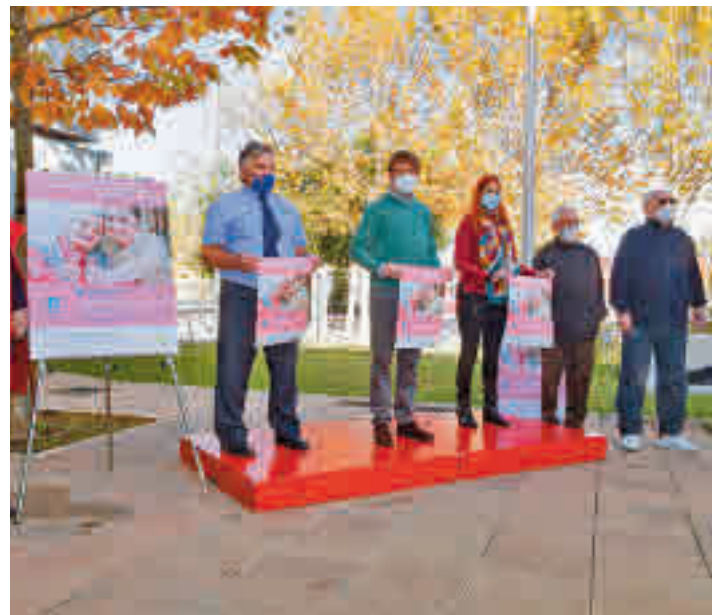
Una de las acciones del Área del Mayor

La iniciativa de la Concejalía de Mayor y Participación Ciudadana pone el foco las necesidades de las personas de más edad • Ya ha obtenido el reconocimiento de la OMS