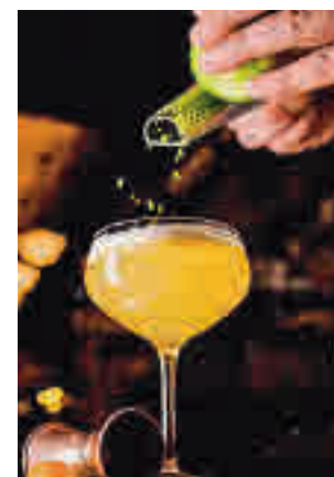
Cita con los mejores cócteles

La semana contará como principal atracción con la ruta de locales a la que se han sumado más de 80 coctelerías. Cada uno de ellos creará una carta de ocho cocktails. En total, habrá más de 500 propuestas creadas especialmente para este evento que, ade-