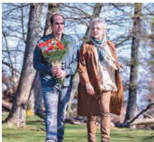
Fotograma de la película 'Maixabel'

EL PERIÓDICO GENTE NO SE RESPONSABILIZA NI SE IDENTIFICA CON LAS OPINIONES QUE SUS LECTORES Y COLABORADORES EXPONGAN EN SUS CARTAS Y ARTÍCULOS