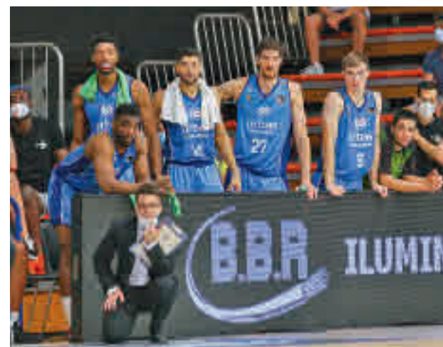
El Urbas cayó derrotado en su debut liguero B. FUENLABRADA

Más lejano aparece en el horizonte el estreno en la Euroliga el jueves 30 (20:45 horas) con el Anadolu Efes, el vigente campeón continental.