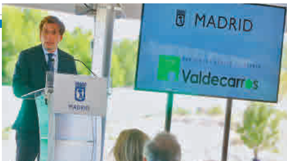
Un momento de la intervención del alcalde

Según fuentes municipales, el nuevo desarrollo potenciará las zonas verdes y los espacios arbolados, que supondrán 6,9 millones de metros cuadrados de superficie y que se sumarán al Bosque Metropolitano. En esta apuesta por