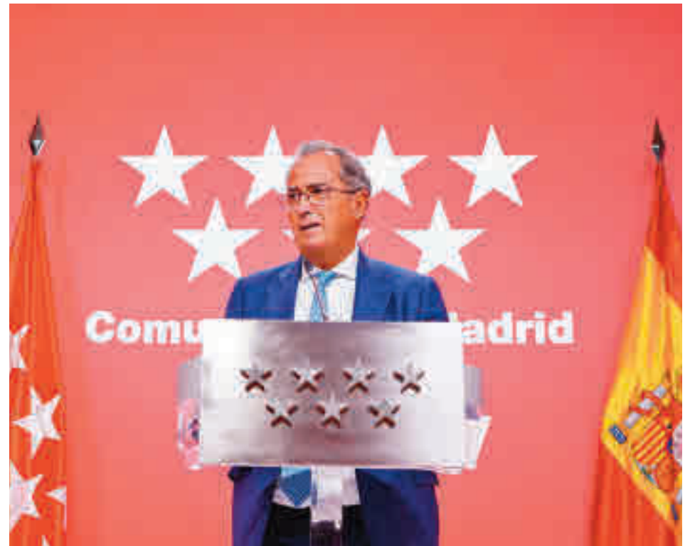
El calendario se aprobó en el Consejo de Gobierno

SE CONSULTA CON EL RESTO DE GRUPOS, LA IGLESIA Y LOS EMPRESARIOS