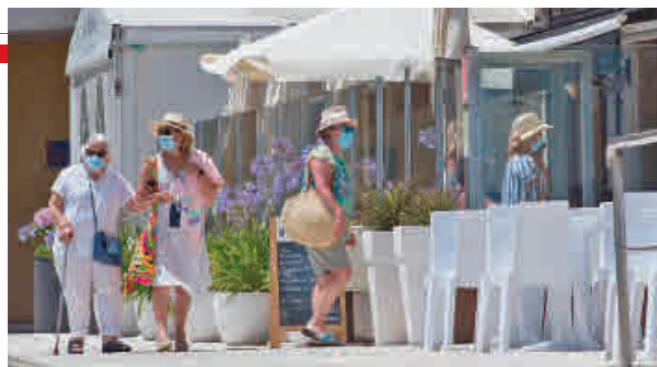
El gasto vacacional ha aumentado en este verano

madrileños fue sensiblemente superior a la media nacional. El Observatorio Cetelem señala que los españoles se gastaron 942 euros en sus pasadas vacaciones de verano, un 42% más que en las del año 2020.