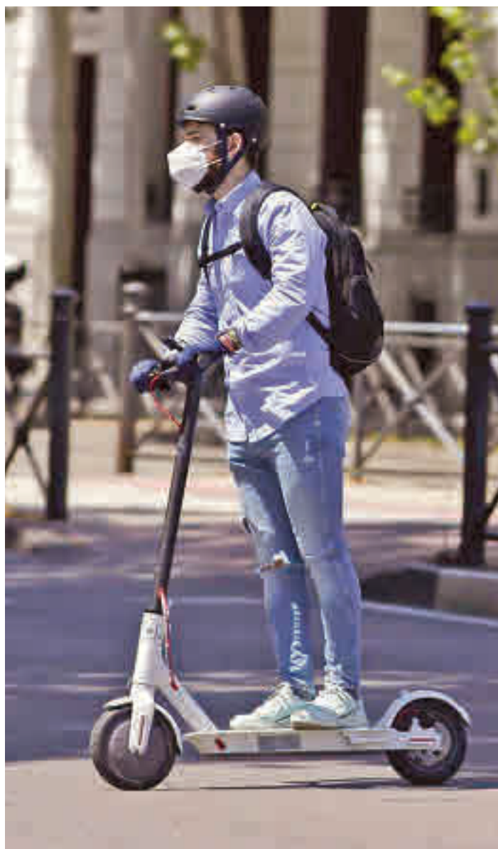
La movilidad eléctrica va en aumento

Por otro lado, un 76% de la población encuestada querría un sistema tarifario integrado conjunto de transporte público que incluyera los servicios de micromovilidad compartida. Una demanda que obtiene un mayor respaldo en concreto entre los sevillanos (82%), los malagueños (80%) y los zaragozanos (81%). Para Brunelleschi, estos datos desmienten "la falacia de que las opciones de movilidad compartida son una amenaza para el uso del transporte público y no una opción com-