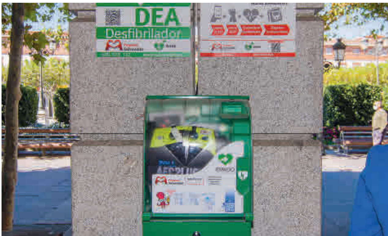
Un desfibrilador en Torrejón