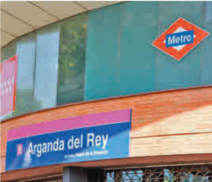
Estación de Arganda del Rey

El trayecto entre ambas estaciones permanecía cerrado desde el pasado 5 de julio ● De esta manera la Línea 9 de Metro vuelve a funcionar en su totalidad y a pleno rendimiento