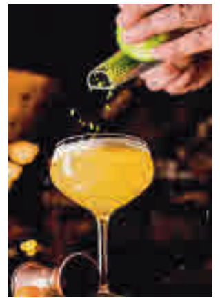
Cita con los mejores cócteles

La semana contará como principal atracción con la ruta de locales a la que se han sumado más de 80 coctelerías. Cada uno de ellos creará una carta de ocho cocktails. En total, habrá más de 500 propuestas creadas especialmente para este evento que, ade-