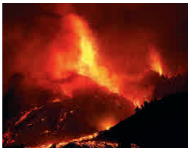
Erupción del volcán de Cumbre Vieja en La Palma

López indicó que la presidenta regional, Isabel Díaz