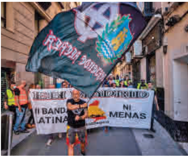
Manifestación neonazi en Chueca