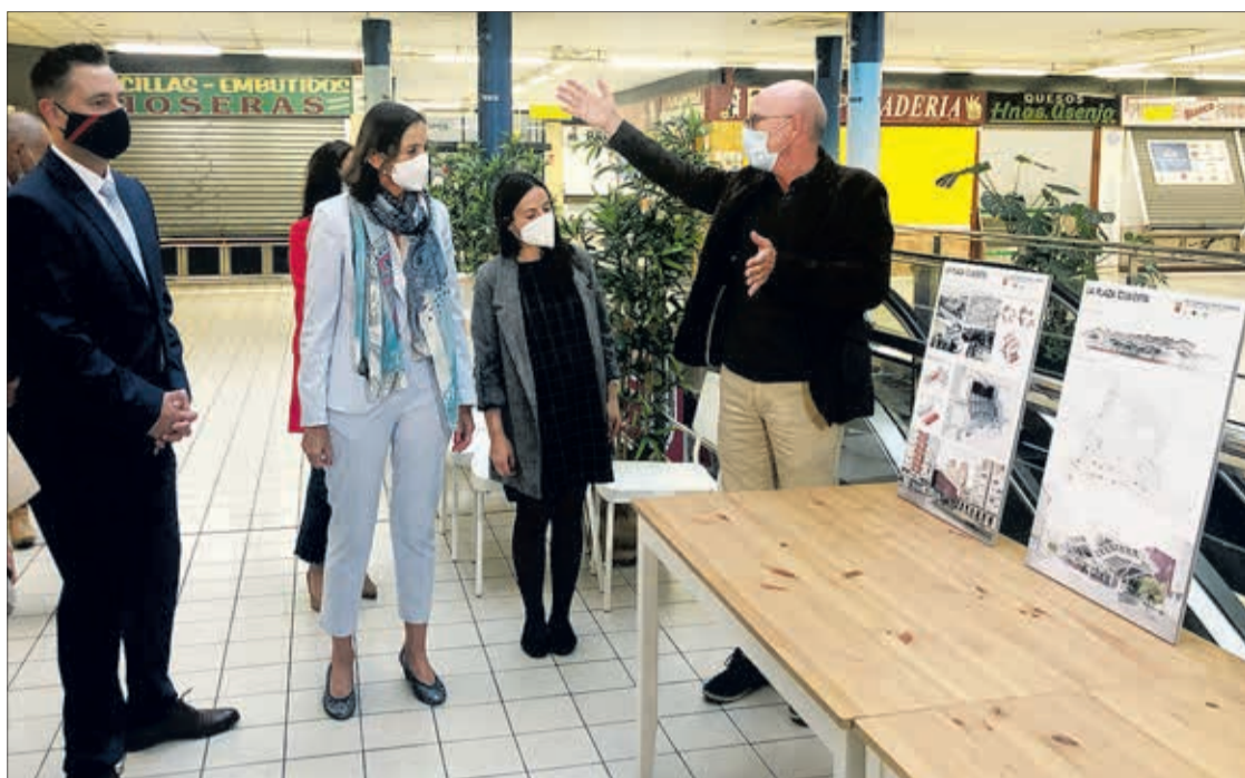
Visita de la ministra de Industria, Comercio y Turismo al Mercado Norte, el miércoles 22.

Así, será en 2023 cuando se ejecute el "grueso" de las obras de construcción de la nueva dotación, de forma que a finales del año que viene el alcalde confió en que ya se cuente con el mercado provisional construido. En consonancia con lo dicho por Ma-