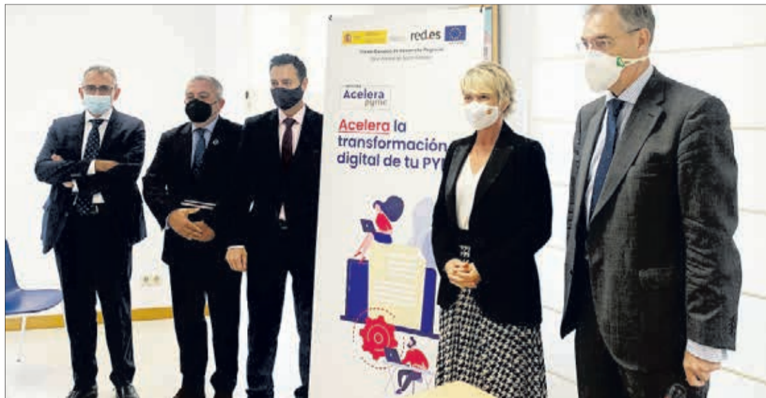
Presentación de la Oficina Acelera Pymes de la Confederación de Asociaciones Empresariales de Burgos (FAE), el lunes 20.