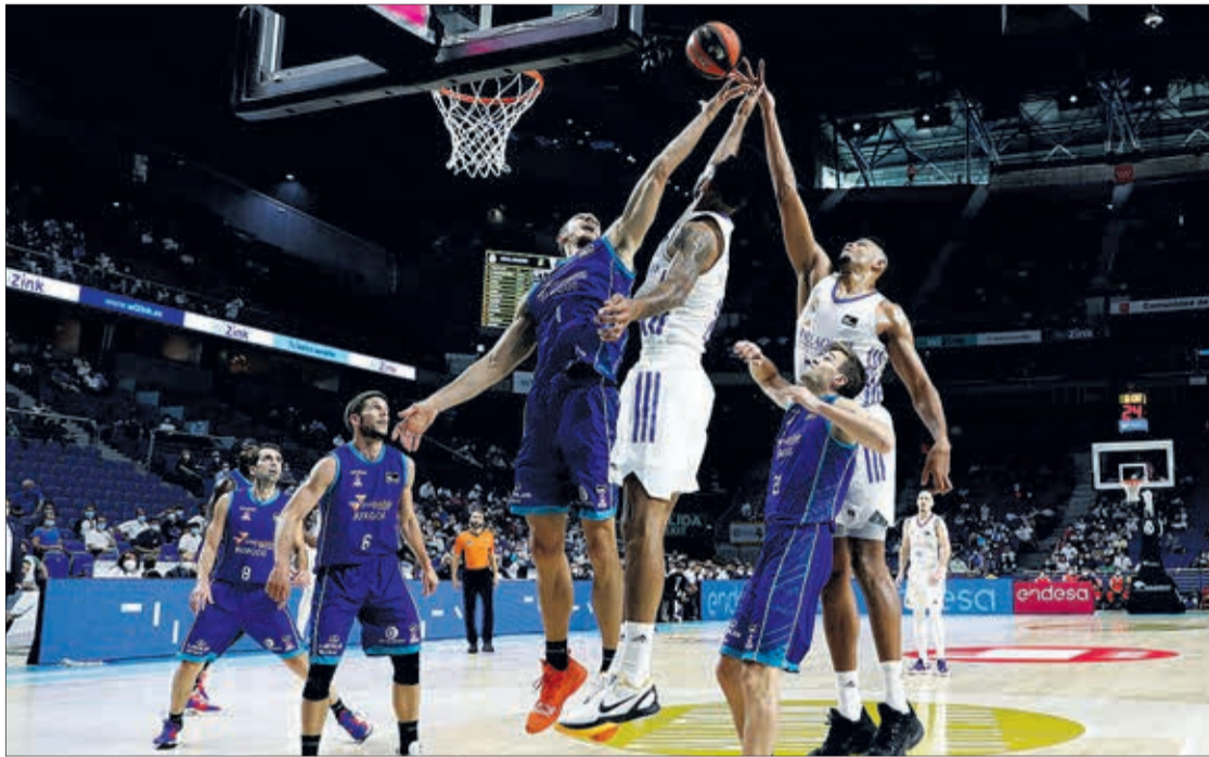
El Hereda San Pablo Burgos vuelve a la Liga Endesa el sábado en Zaragoza.