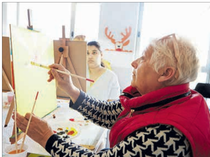
Uno de los ámbitos que contempla la convocatoria es el de personas mayores.

La Convocatoria Burgos 2021 contempla seis ámbitos de actuación: personas mayores y retos derivados del envejecimiento; personas con discapacidad o trastorno mental; humanización de la salud; lucha contra la pobreza infantil y familiar y la