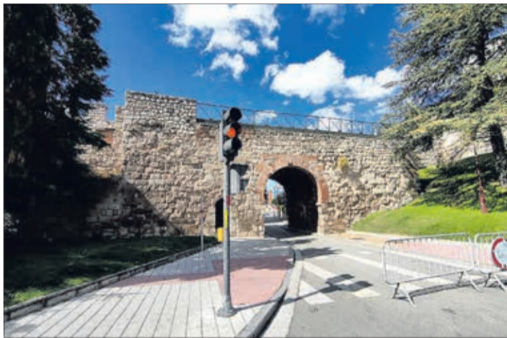
Imagen del estado actual del Arco de San Martín.

Tal como detalló el concejal, se trata de un área de actuación