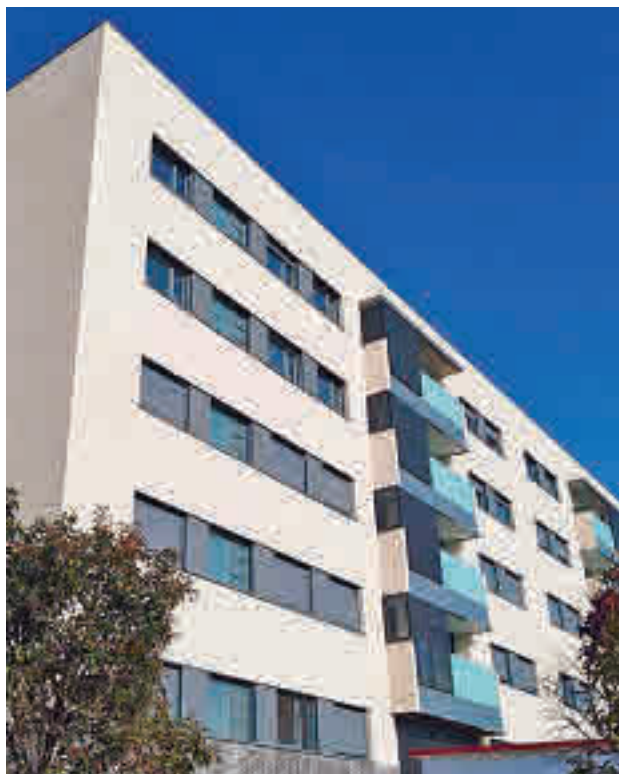
Móstoles y Valdemoro tendrán viviendas sociales

El plazo de ejecución de los trabajos será de 55 me-