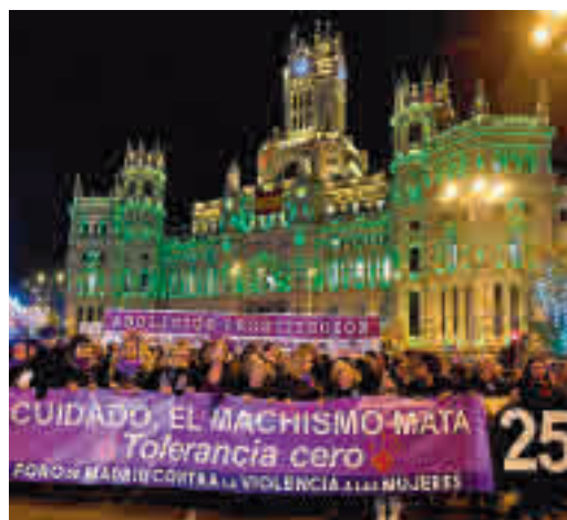
Una manifestación del 8-M

EL PERIÓDICO GENTE NO SE RESPONSABILIZA NI SE IDENTIFICA CON LAS OPINIONES QUE SUS LECTORES Y COLABORADORES EXPONGAN EN SUS CARTAS Y ARTÍCULOS