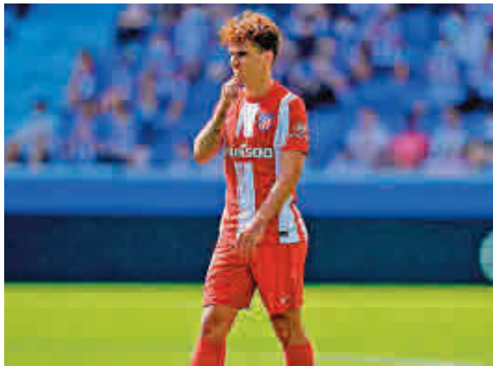
Griezmann será una de las atracciones del partido

El deporte sigue dando pasos en su particular desescalada. Esta semana el Consejo Interterritorial del Sistema Nacional de Salud el aumento hasta el 100% en el aforo de los eventos al aire libre, una medida que podría tener su puesta de largo en uno de los mejores escenarios posibles, en el Wanda Metropolitano y, ni más ni menos, que en