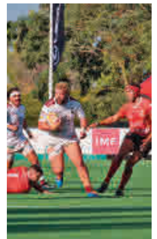
El Alcobendas opta a todo

Con esos ilusionantes antecedentes, el cuadro alcobendense debutará este domingo 3 (12:30 horas) para recibir al Ciencias Enerside, un conjunto sevillano que el año pasado apenas opuso resistencia en su visita a Las Terrazas: derrota por 47-3.