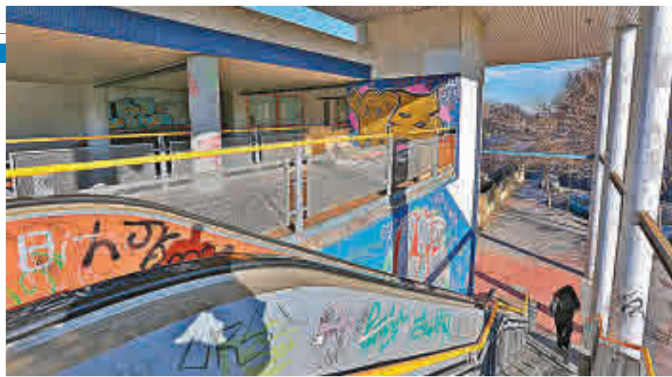
Los trabajos de rehabilitación, un poco más cerca

mirá labores como la conservación, mantenimiento y mejora de la pasarela; su limpieza, vigilancia y custodia y mantenimiento, las de sus equipamientos e instalaciones (ascensor, alumbrado, saneamiento, entre otros) y la urbanización del entorno de la misma.