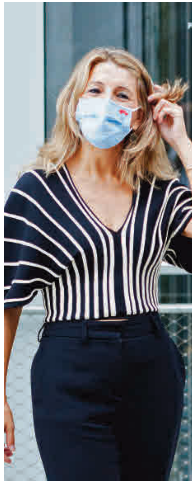
La ministra de Trabajo, Yolanda Díaz

El Gobierno cifra en 1.200 millones de euros el coste de prorrogar los ERTE.