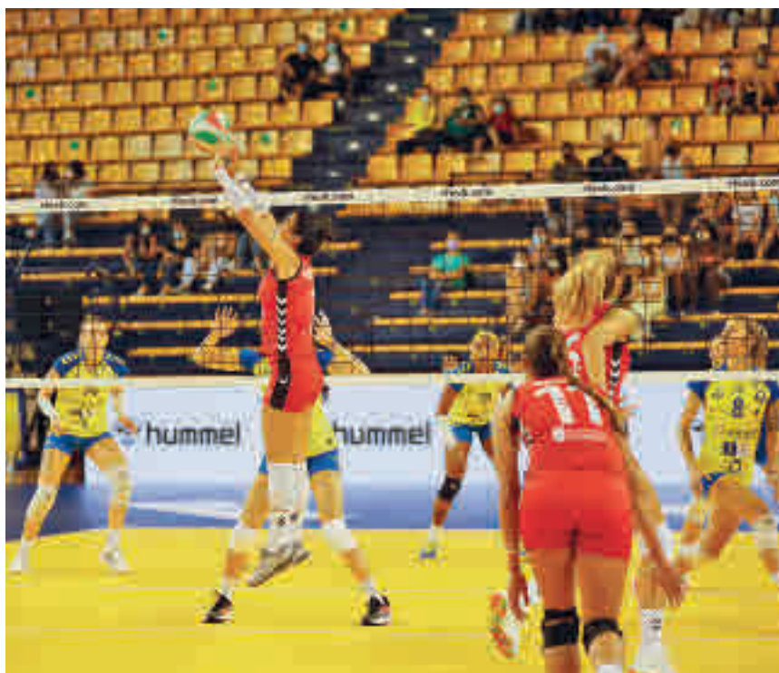
El Feel Volley Alcobendas no pudo hacerse con la Supercopa RFEVB