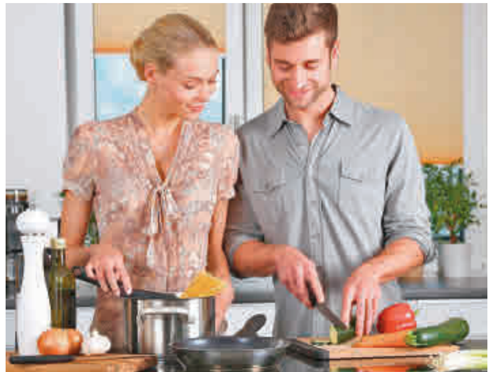
El curso de 'Batchcooking' pone el acento en una práctica muy en boga

Completan la programación 'Mi economía', 'costura a máquina', 'Aula de nuestro