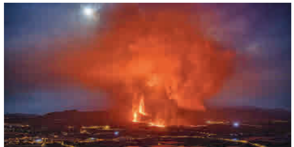
Erupción volcánica en la isla de La Palma

Esta partida es la primera del Plan Especial de Reconstrucción de La Palma que el Ejecutivo central ha puesto en marcha y que se mantendrá en el tiempo durante la fase de recuperación, para que cuando el volcán pare se realice una evaluación de daños para iniciar a continuación la recuperación de la isla.