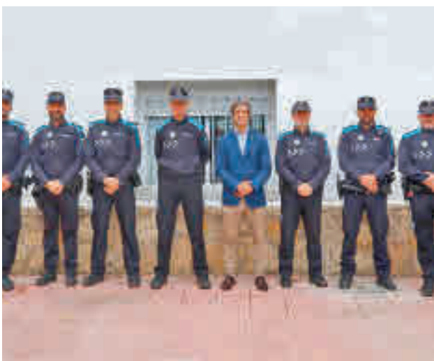
Foto de familia de esta unidad de la Policía Local