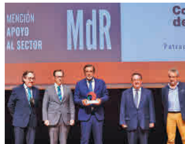
Acto de entrega de los premios

López recordó el modelo de gestión de la crisis sanitaria por parte de la Comunidad de Madrid, que ha permitido, con "medidas proporcionadas", conjugar "la salud con la economía" sin cierres indiscriminados ni restricciones de derechos.