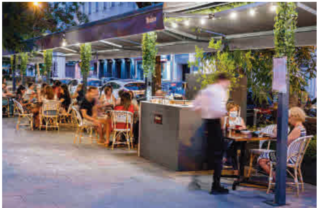
Un camarero atiende a dos clientas en una de las terrazas de veladores del barrio de Ibiza

El decreto firmado por el concejal Santiago Saura (Cs) prohíbe, además, las ampliaciones o modificaciones que impliquen un incremento del espacio utilizado o que supongan la instalación de toldos, separadores fijos anclados, maceteros o decoración vegetal, cerramientos o estructuras ligeras o cualquier otro elemento con fijación al pavimento. Según fuentes municipales, las zonas más