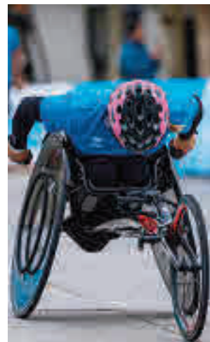
Se celebrará en el CAR

La iniciativa llega de la mano de la Fundación Sanitas, el Consejo Superior de Deportes, el Comité Olímpico Español y el Comité Paralímpico Español.