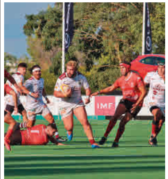
El Alcobendas, candidato a todo