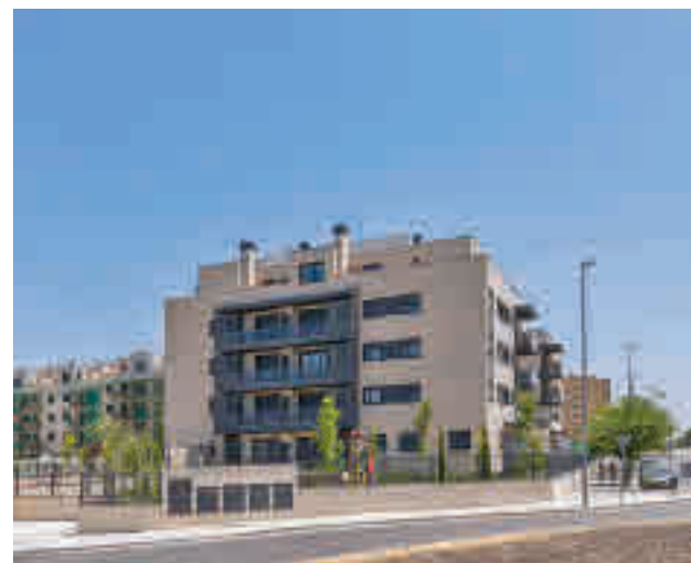
Pisos en Valdemoro