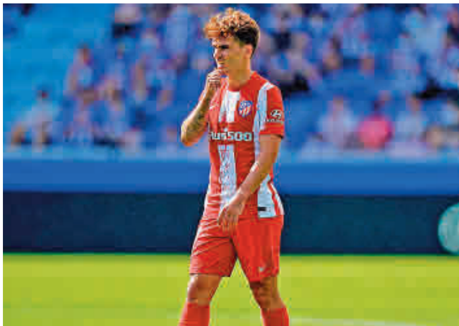
Griezmann será una de las atracciones del partido

El empate sin goles ante el Villarreal y, sobre todo, la inesperada y sorprendente derrota ante el modesto Sheriff (1-2) en la Liga de Campeones han rebajado la euforia que se había desatado tras los triunfos ante rivales como el Inter de Milán. Para recuperar esas buenas sensaciones, el Real Madrid tratará de hacer buena la estadística, que dice que solo ha perdido en una ocasión (1-0, campaña 2017-2018) desde que el Espanyol se mudó a Cornellá-El Prat. Los locales son decimocuartos en la tabla con seis puntos.