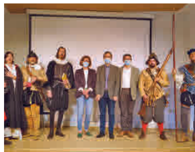
Acto de presentación

Como no puede ser de otra manera, garantizar la seguridad sanitaria es una prioridad para el Consistorio. Debido a ello habrá hasta un cincuenta y cinco por ciento menos de los puestos actuales y