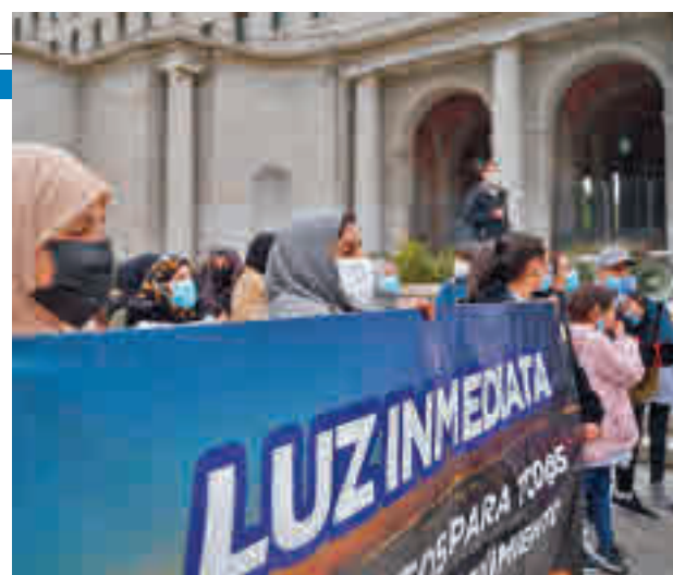
Uno de los actos reivindicativos de la población

liana. La Delegación del Gobierno en Madrid apuesta por una acción coordinada de las administraciones para solucionar los problemas en este enclave de la capital. Además, los vecinos de la Cañada Real Galiana organizarán