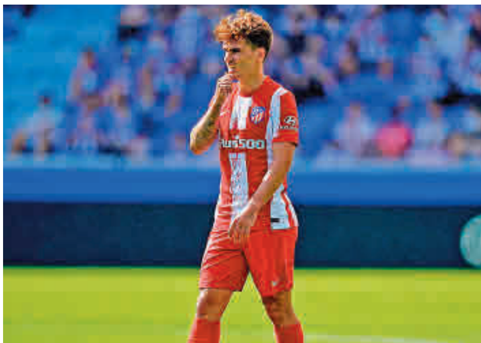
Griezmann será una de las atracciones del partido

El empate sin goles ante el Villarreal y, sobre todo, la inesperada y sorprendente derrota ante el modesto Sheriff (1-2) en la Liga de Campeones han rebajado la euforia que se había desatado tras los triunfos ante rivales como el Inter de Milán. Para recuperar esas buenas sensaciones, el Real Madrid tratará de hacer buena la estadística, que dice que solo ha perdido en una ocasión (1-0, campaña 2017-2018) desde que el Espanyol se mudó a Cornellá-El Prat. Los locales son decimocuartos en la tabla con seis puntos.