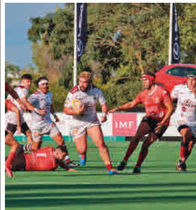
El Alcobendas, candidato a todo