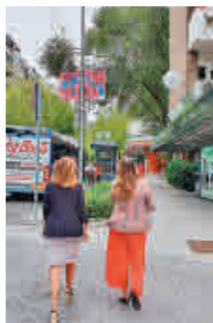
Banderolas en las farolas

Esta iniciativa que cuenta con la colaboración de las principales asociaciones y empresarios de Moratalaz, se puede ver ya en los principales ejes comerciales del distrito debido a la instalación de banderolas informativas en las farolas. Los residentes que sigan el lema de la campaña