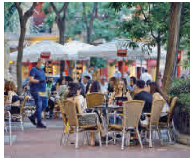
Buenas noticias para la hostelería