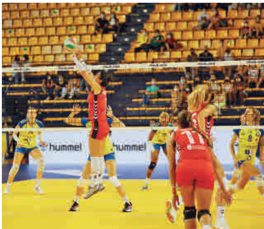
El Feel Volley Alcobendas no pudo hacerse con la Supercopa RFEVB