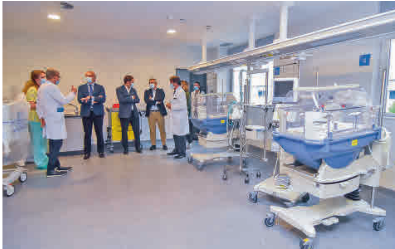
Evento para conmemorar el décimo aniversario

Hasta la fecha se han realizado 138.049 intervenciones, se han producido 21.249 nacimientos, se han pasado 3.896.913 consultas, se han efectuado 1.325.221 pruebas radiológicas y 8.778 pruebas de hemodinámica, se han atendido 991.047 urgencias, se han concretado 236.434 hospitalizaciones o se han inoculado 76.111 dosis de vacunas.