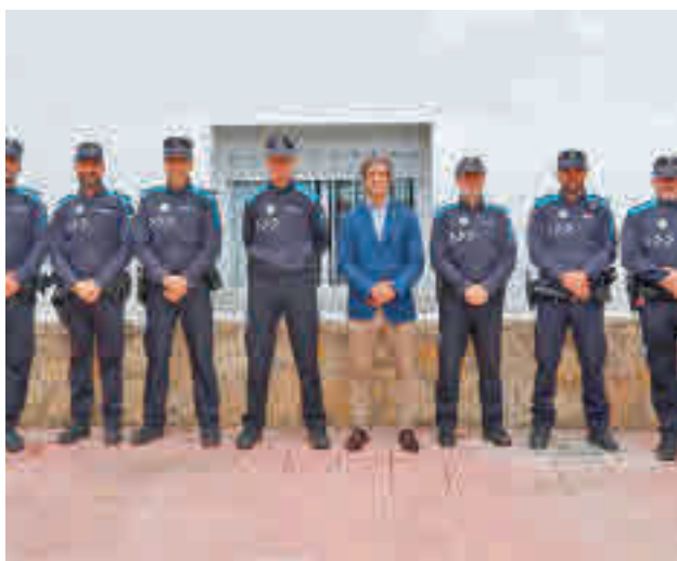
Foto de familia de esta unidad de la Policía Local